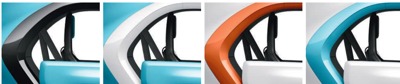
Diamond Black (1)