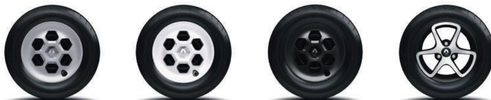
Capac Slate grey (standard) (2)