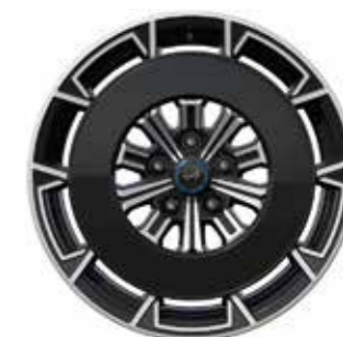
05_ GLANZEND ZWARTE AERO-SCHIJVEN VOOR SNOWFLAKE-VELGEN*