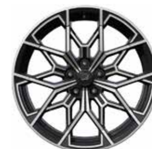
04_ 19"-VELGEN 'SNOWFLAKE', GLANZEND ZWART, GEDIAMANTEERD