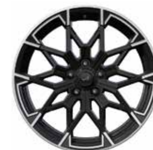
03_ 19"-VELGEN 'SNOWFLAKE', GLANZEND ZWART, HALFGEDIAMANTEERD