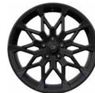
02_ 19"-VELGEN 'SNOWFLAKE', GLANZEND ZWART