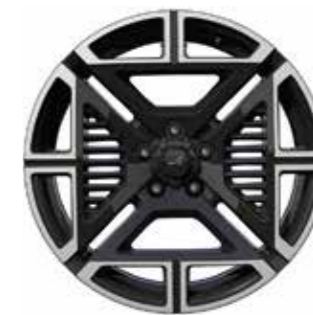
01_ 19"-VELGEN 'ICONIC', GLANZEND ZWART, GEDIAMANTEERD