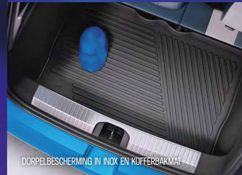
DORPELBESCHERMING IN INOX EN KOFFERBAKMAT