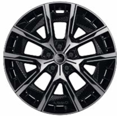
DISKY KOL Z LEHKÝCH SLITIN 20", CRISTAL S DIAMANTOVÝM EFEKTEM, NOIR