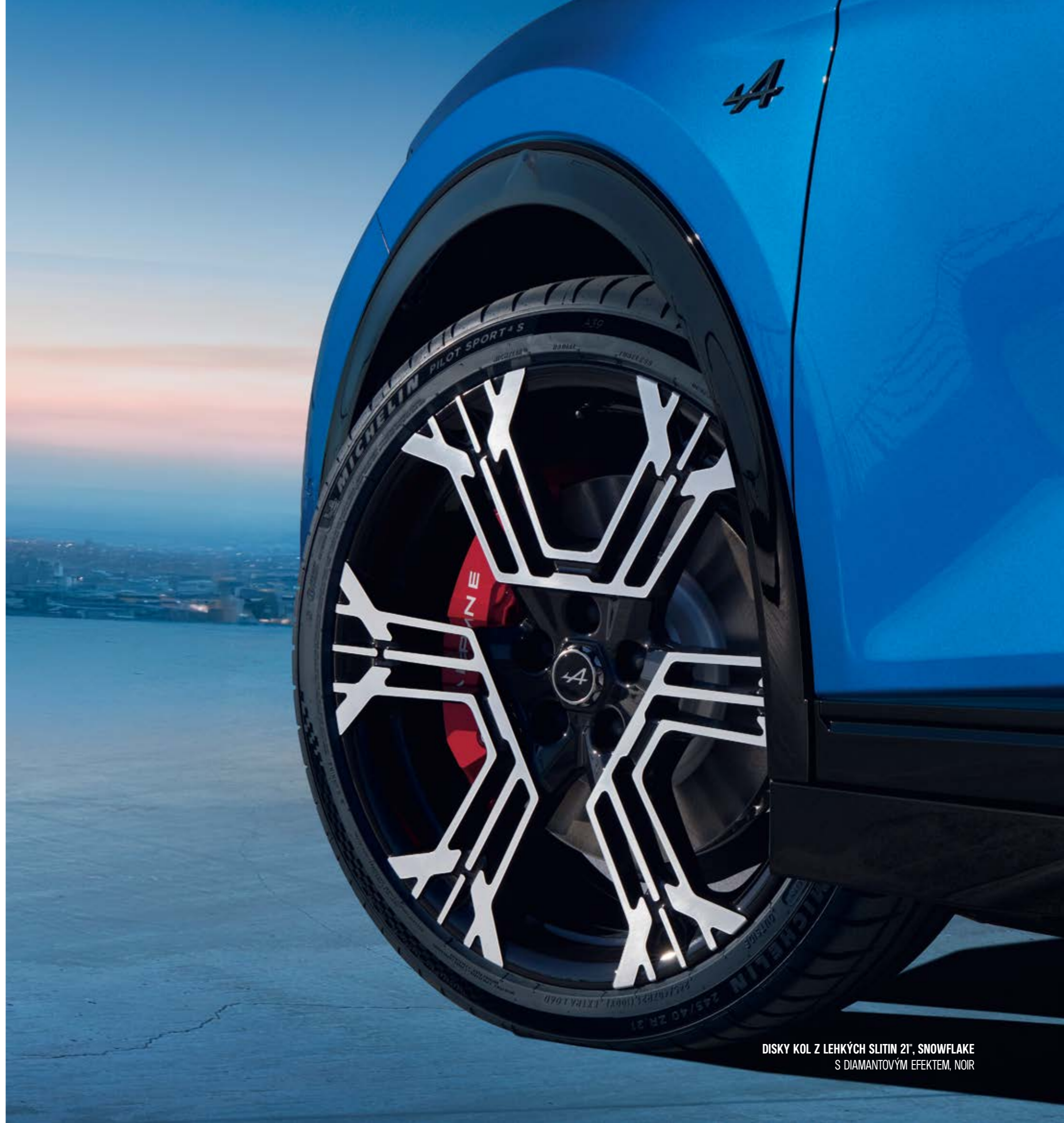
DISKY KOL Z LEHKÝCH SLITIN 21", SNOWFLAKE S DIAMANTOVÝM EFEKTEM, NOIR