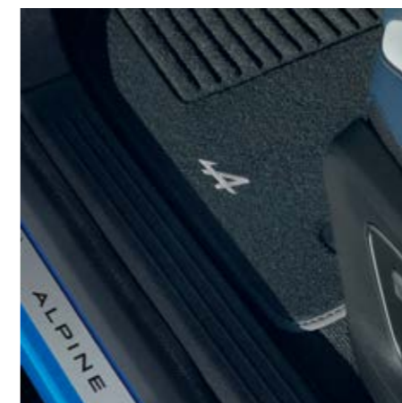
TEXTILNÍ KOBERCE ALPINE