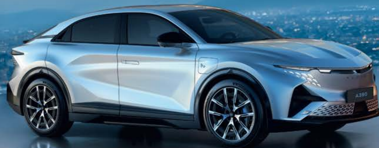
ALPINE A390 GT