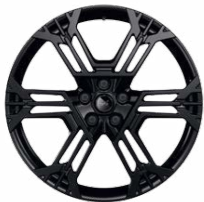
DISKY KOL Z LEHKÝCH SLITIN 21", SNOWFLAKE KOVANÉ, NOIR MAT