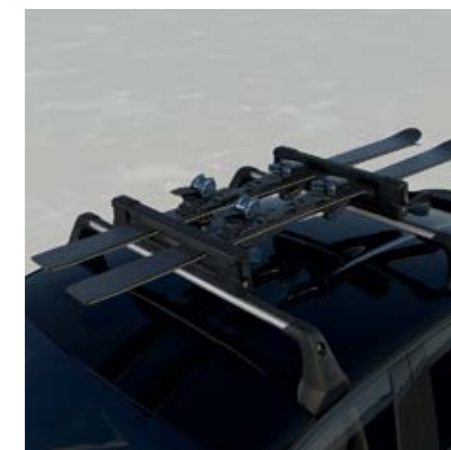
NOSIČ NA 4 PÁRY LYŽÍ NA STŘEŠNÍ TYČE