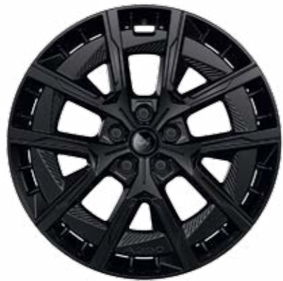
DISKY KOL Z LEHKÝCH SLITIN 20", CRISTAL ČERNÉ LAKOVANÉ, NOIR MAT