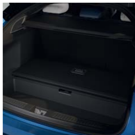
DVOJITÉ DNO ZAVAZADLOVÉHO PROSTORU