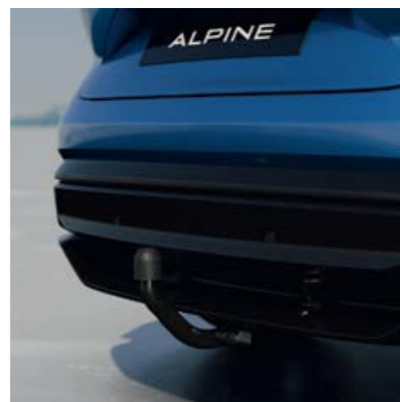
DEMONTOVATELNÉ TAŽNÉ ZAŘÍZENÍ