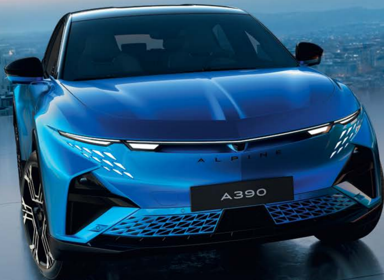
ALPINE A390 GTS *