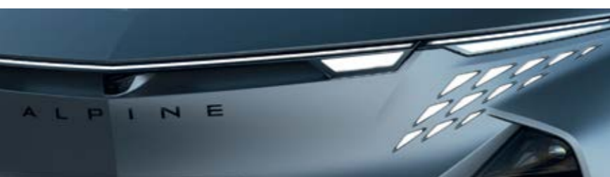
GRIS TONNERRE MAT [ATELIER ALPINE]