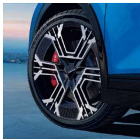
STŘEDOVÁ KRYTKA SNOWFLAKE