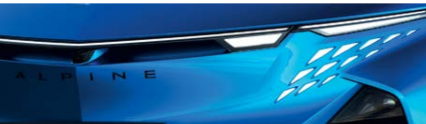
BLEU ALPINE VISION