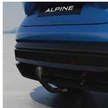
OHNE WERKZEUG ABMONTIERBARE ANHÄNGERKUPPLUNG