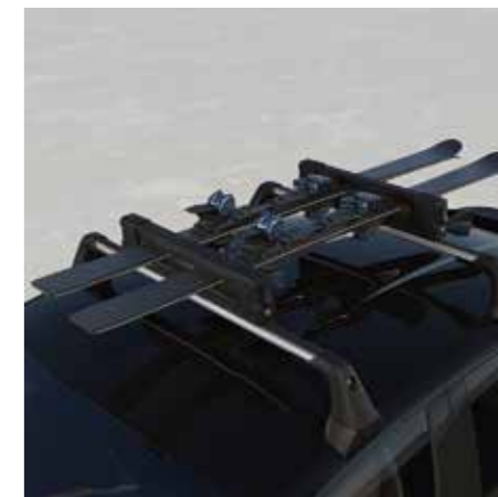
SKITRÄGER FÜR 4 PAAR AUF DEN DACHTRÄGERN