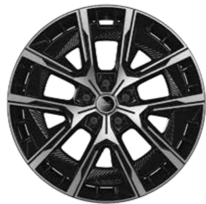
20" CRISTAL DIAMANTÉES NOIR BRILLANT