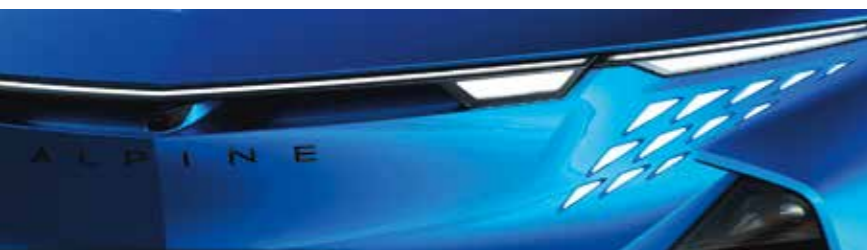
BLEU ALPINE VISION