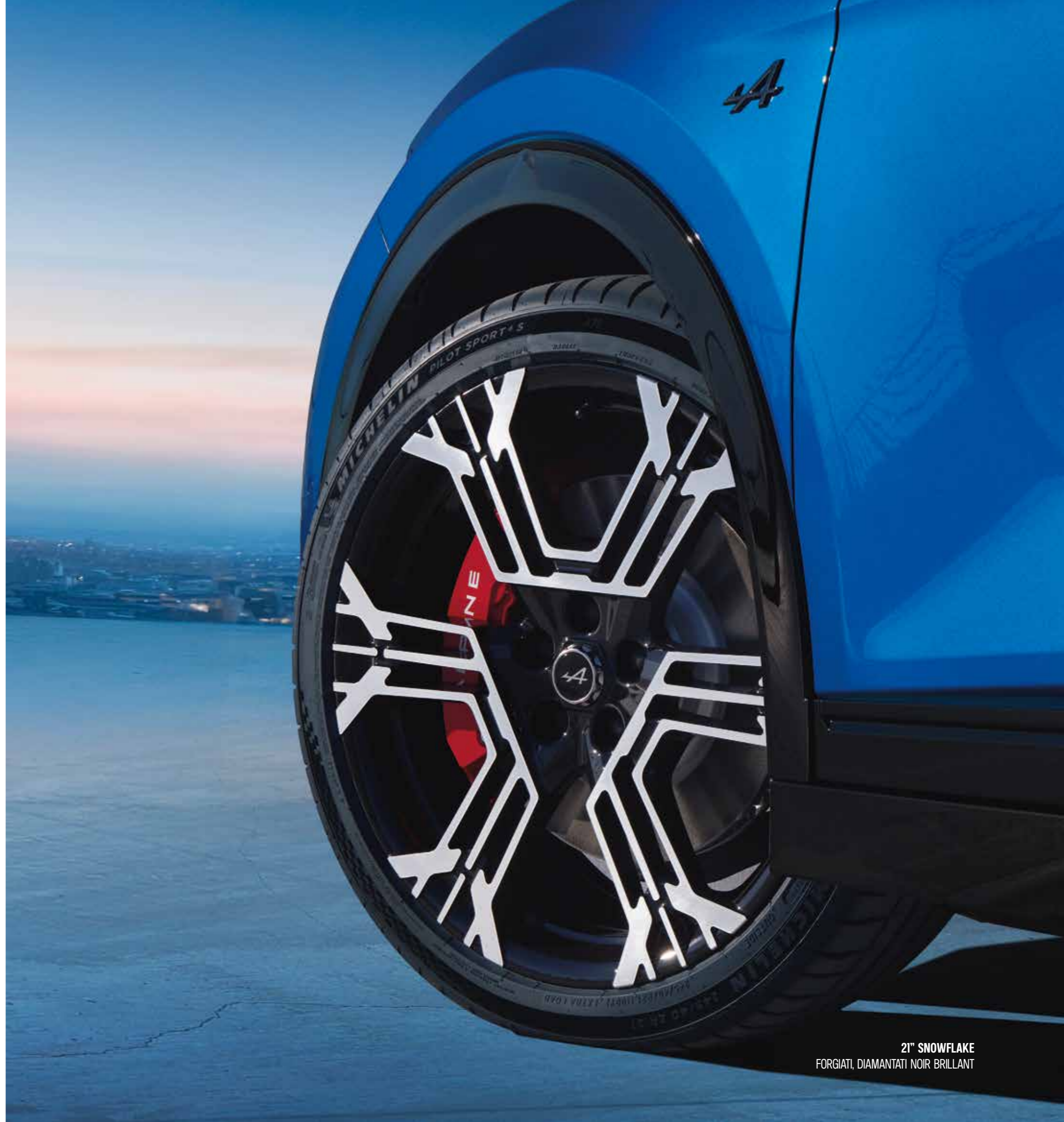
21" SNOWFLAKE FORGIATI, DIAMANTATI NOIR BRILLANT