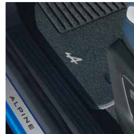
TAPPETINI IN TESSUTO ALPINE