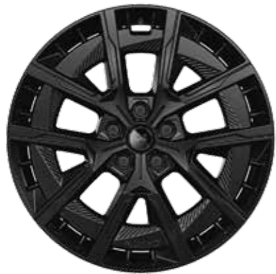
20" CRISTAL NOIR [OFFERTA ATELIER]