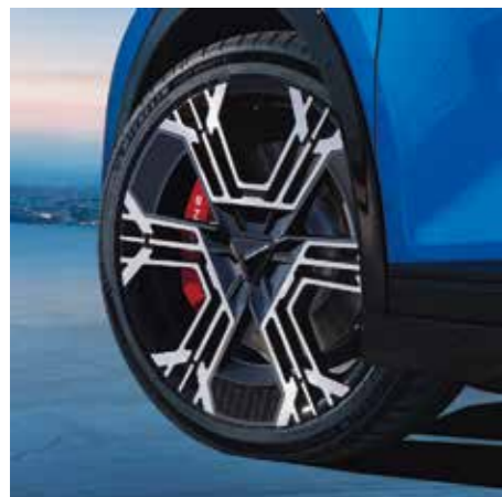
INSERTI PER CERCHI [PER CERCHI 21"]