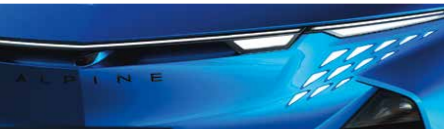
BLEU ALPINE VISION