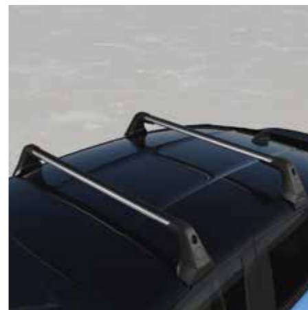
BARRE SUL TETTO IN ALLUMINIO