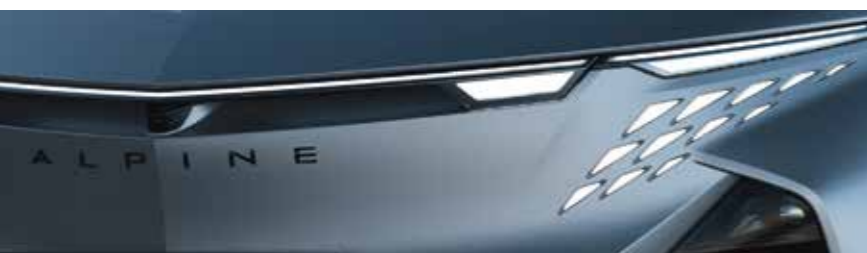
GRIS TONNERRE OPACO [OFFERTA ATELIER]