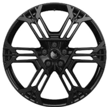
21" SNOWFLAKE FORGIATI NOIR [OFFERTA ATELIER]