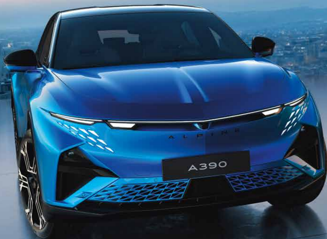
ALPINE A390 GTS