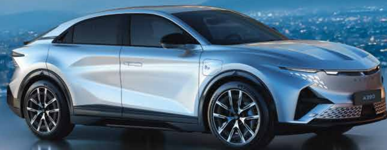
ALPINE A390 GT