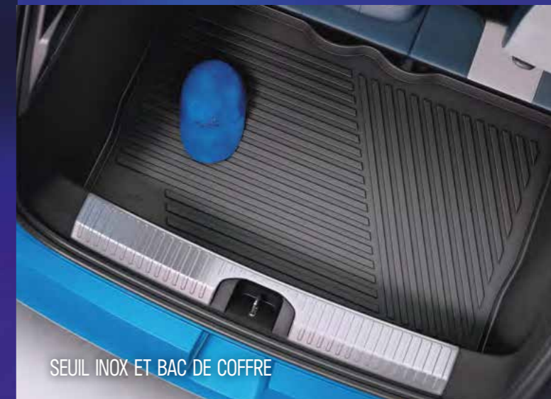
SEUIL INOX ET BAC DE COFFRE