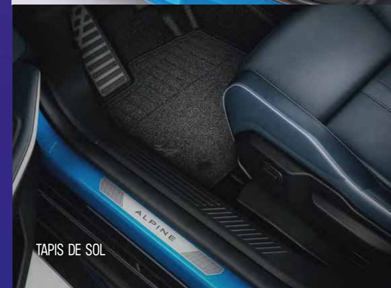
TAPIS DE SOL