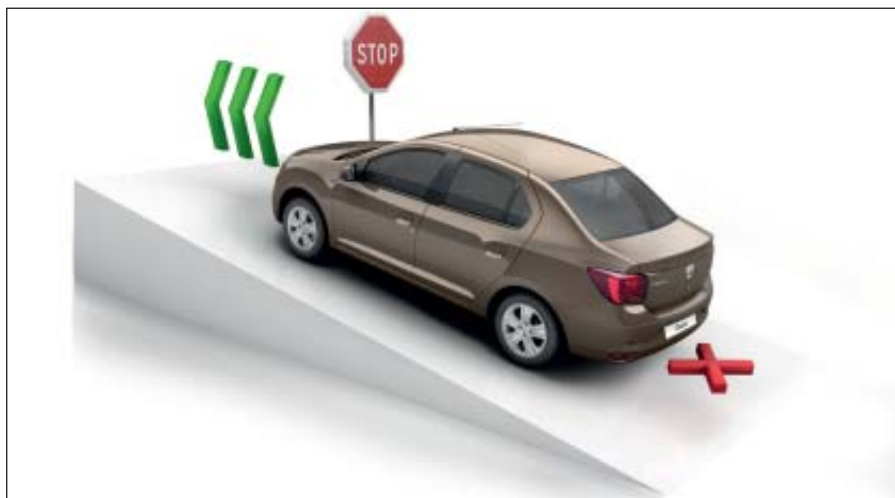
Aide au démarrage en côte : Cette aide vous permet de démarrer en côte en toute sécurité et sans précipitation.

antipatinage (ASR) garantissent un freinage efficace et une stabilité accrue du véhicule. Également dotées d'airbags frontaux et latéraux avant, du système de fixation Isofix pour les sièges enfants situé sur les places latérales arrière, de l'aide au démarrage en côte et des aides au parking arrière... Vous pouvez prendre la route en toute sérénité!