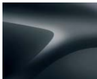
GRIS COMÈTE (KNA)