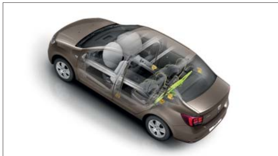
Protection : Structure renforcée, airbags frontaux et latéraux avant, système de fixation Isofix situé au niveau des places latérales arrière.