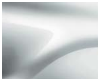
BLANC GLACIER (369) (1)