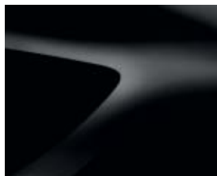
NOIR NACRÉ (676)