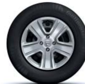
ENJOLIVEUR 15" POPSTER