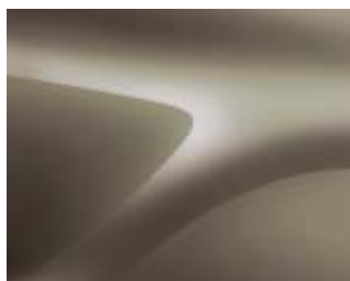
BEIGE DUNE (HNP)