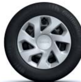
ENJOLIVEUR 15" GROOMY