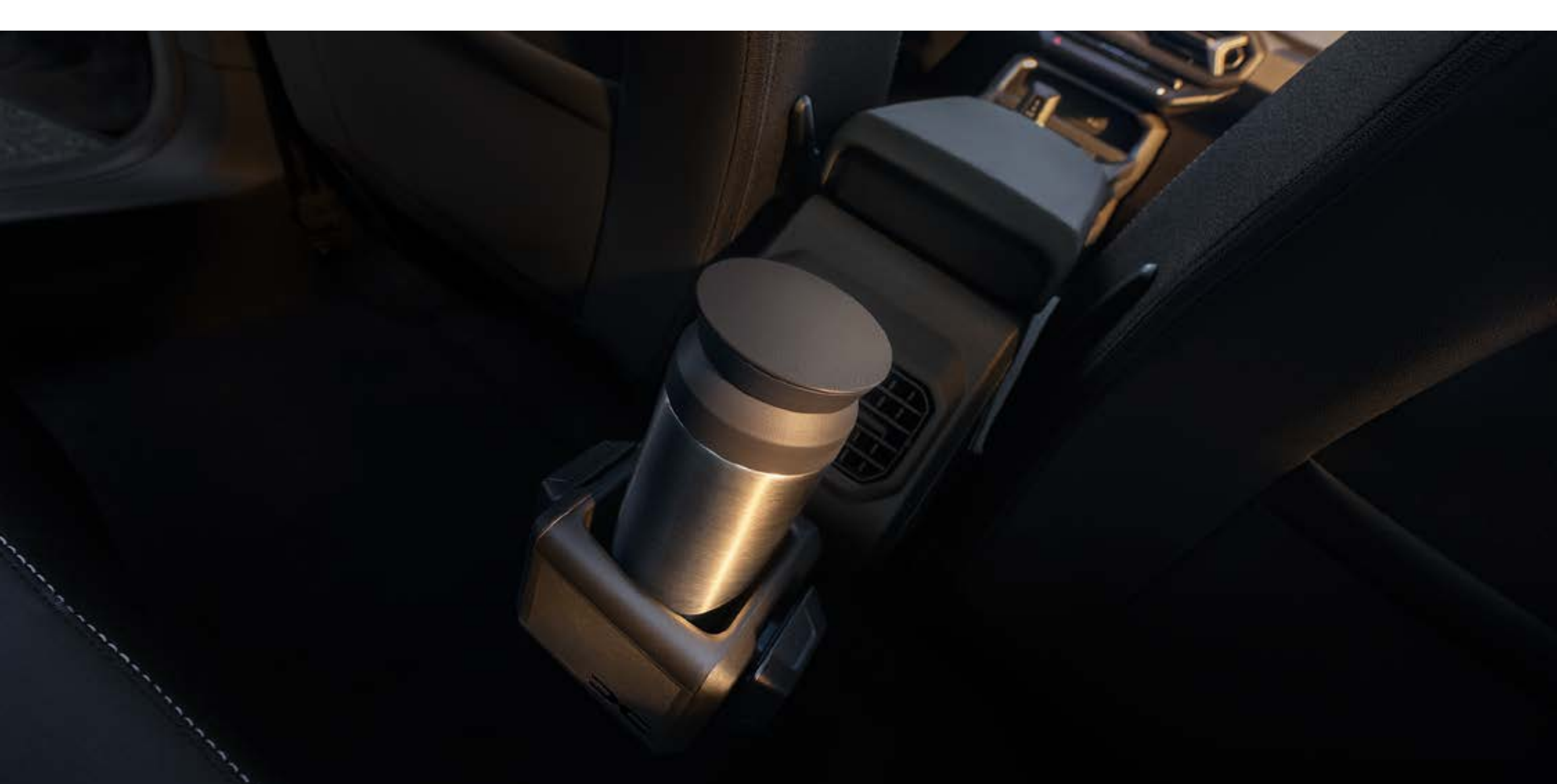
YouClip 3 in 1