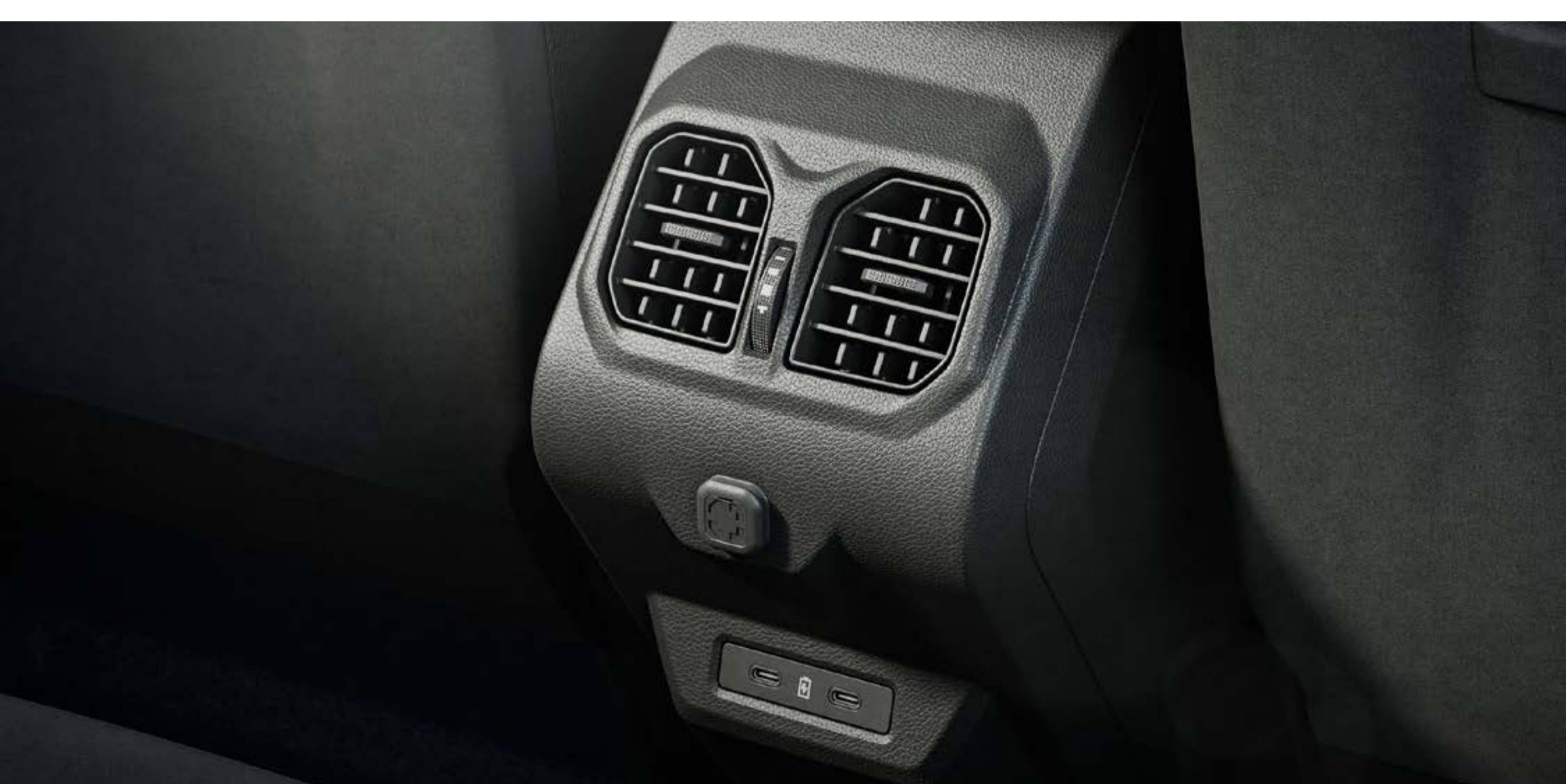
Bocchette di aerazione posteriore