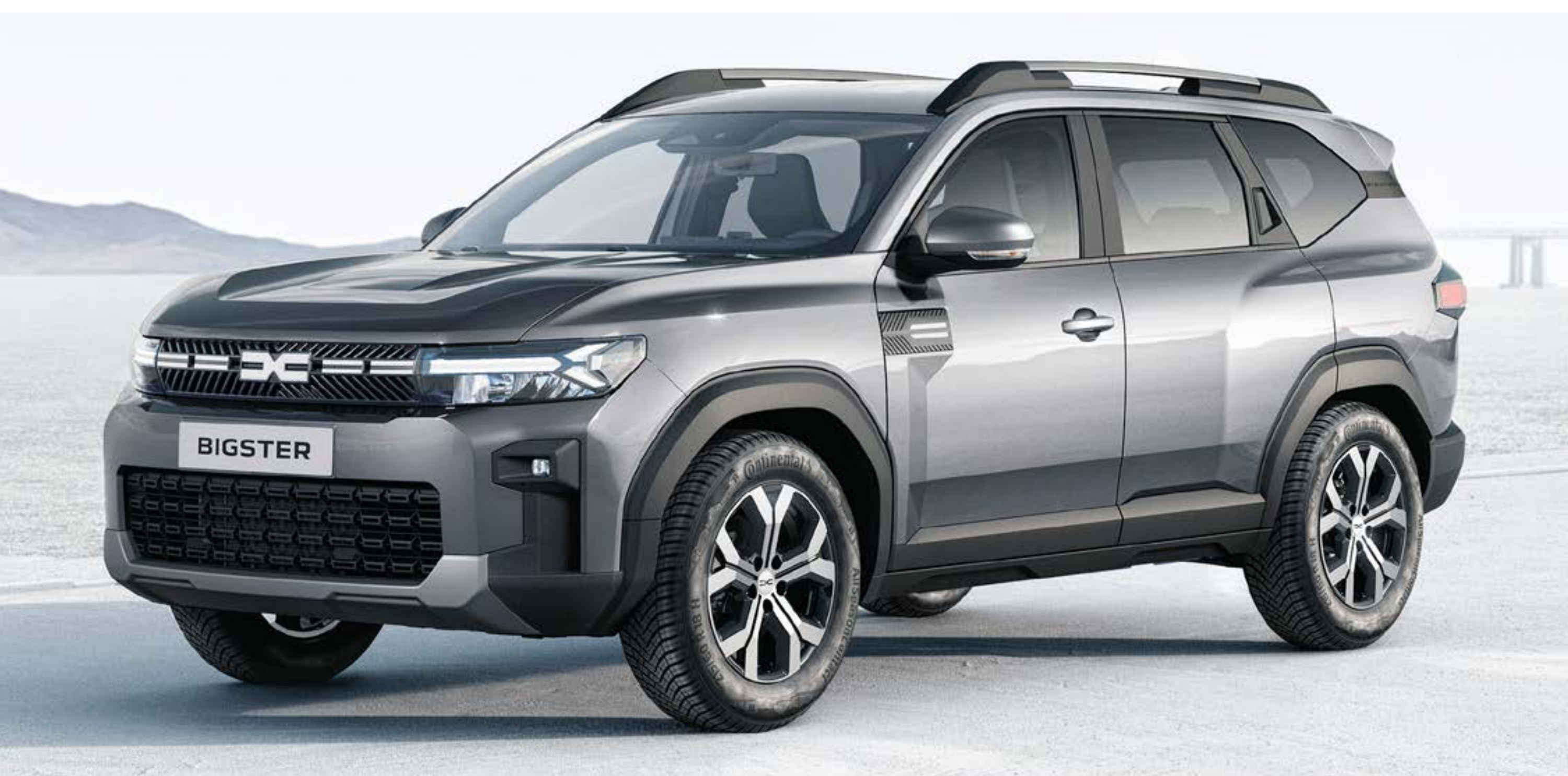
GRIS SCHISTE (2)