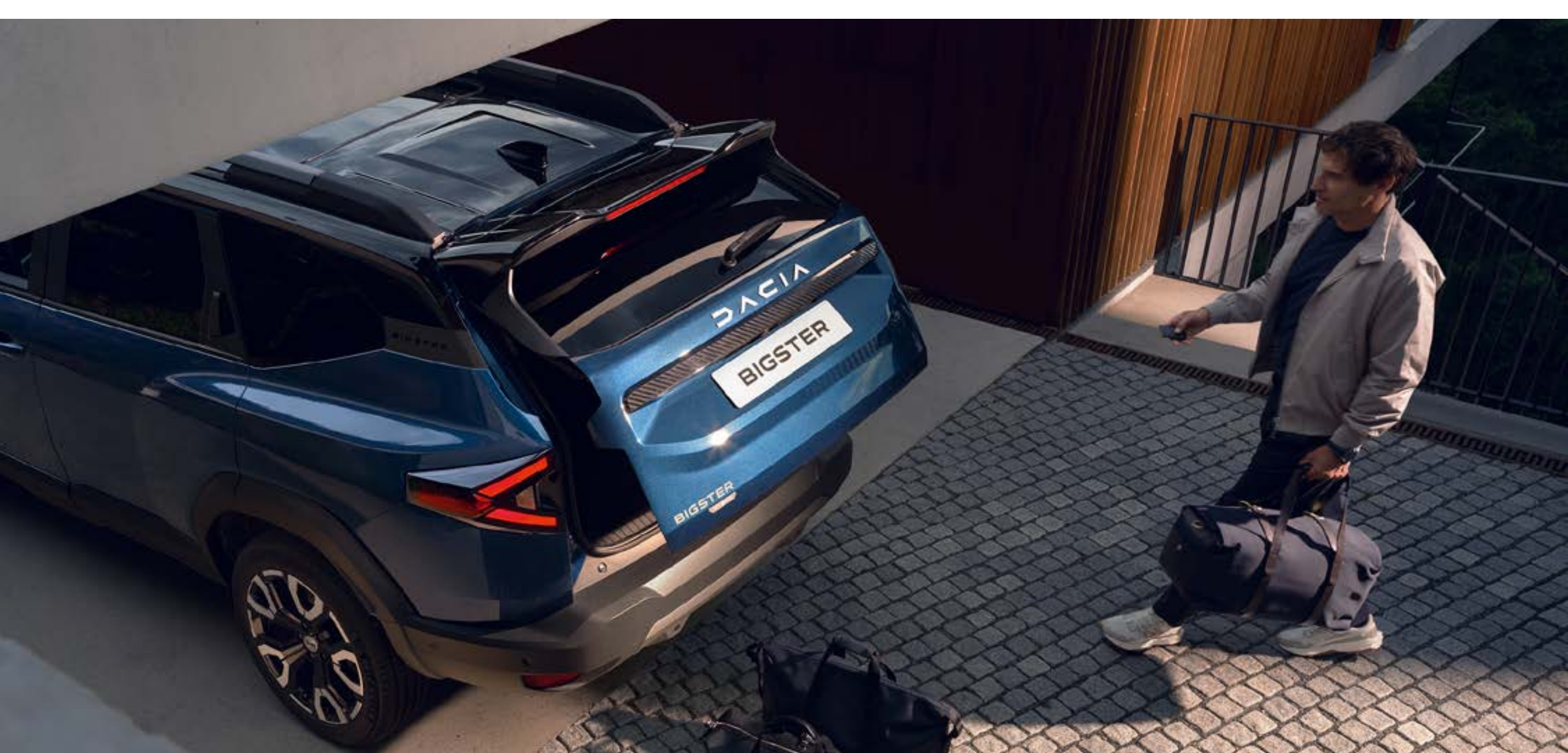
Portellone posteriore elettrico