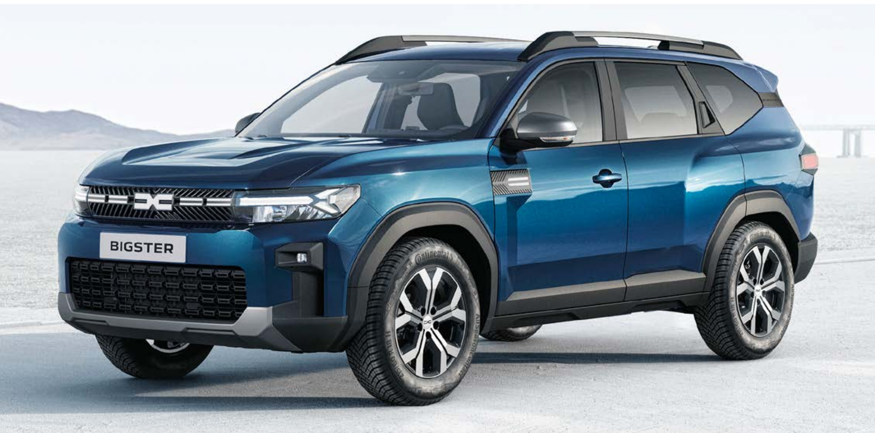
BLEU INDIGO (2)