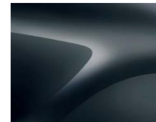
GRIS COMÈTE (KNA) (2)