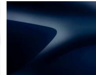
BLEU NAVY (D42) (1)