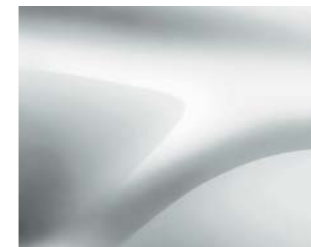
BLANC GLACIER (369) (1)