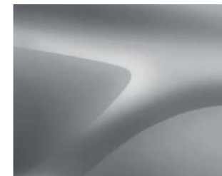
GRIS HIGHLAND (KQA) (2)