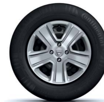
COPRICERCHIO DA 15" POPSTER