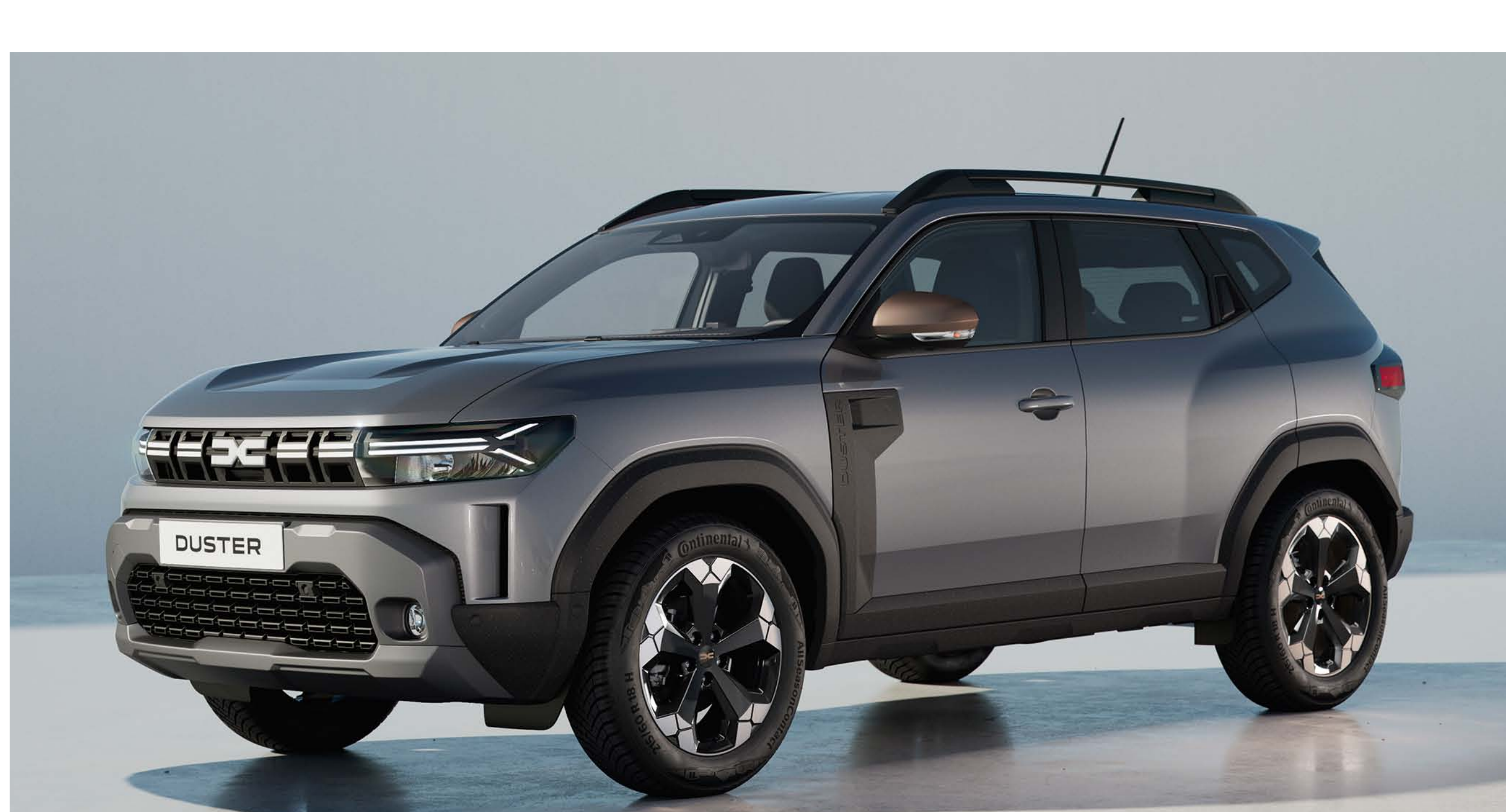
GRIS SCHISTE (1)