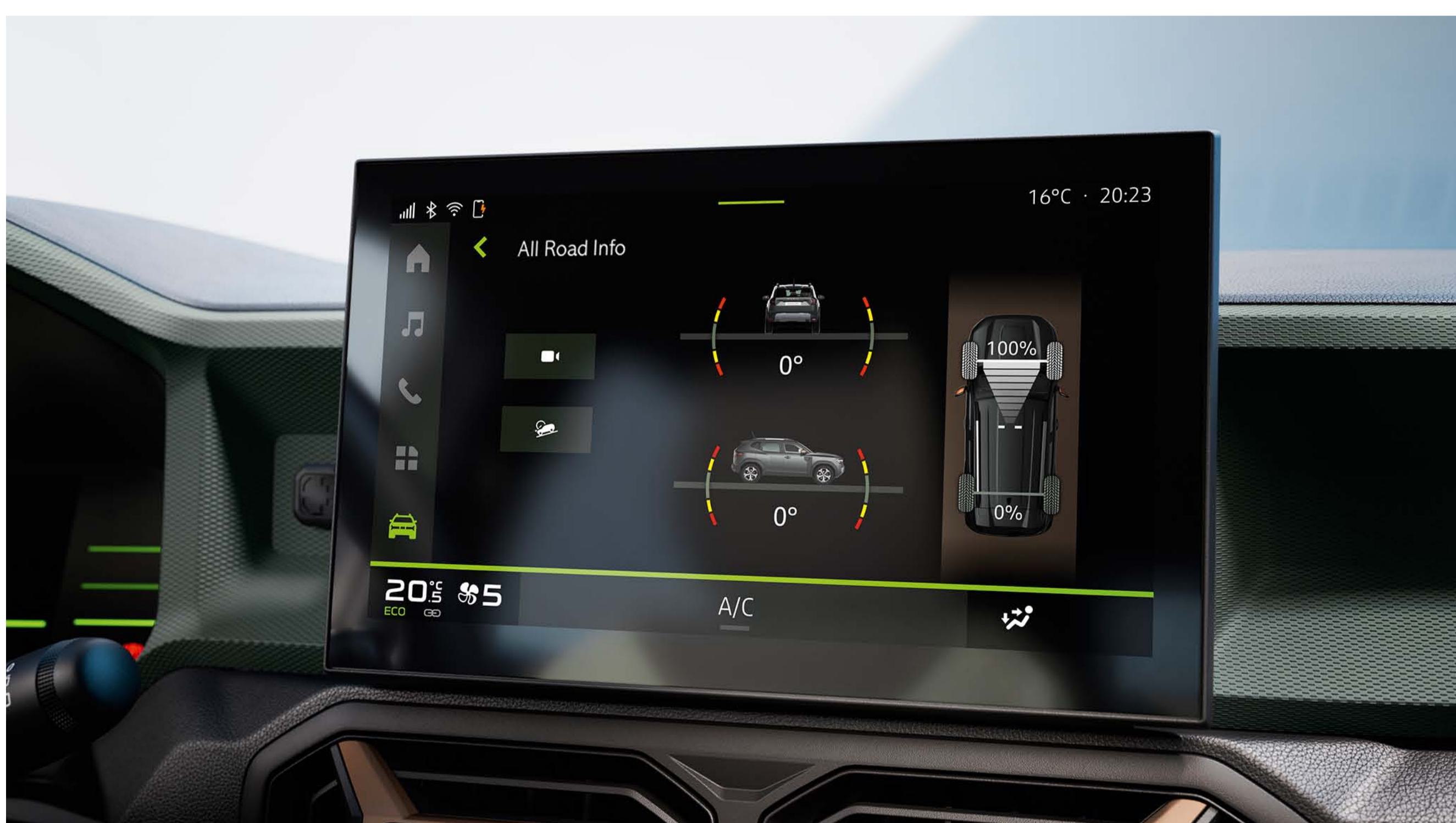
Touchscreen mit Höhenmesser

Dank einer erhöhten Bodenfreiheit bis zu 217 mm, einem Böschungswinkel vorne von bis zu 31°, um mit Allradantrieb jede Steigung zu erklimmen, und kratzfestem Starkle ® -Kunststoff bleibt der neue Dacia Duster seiner DNA als SUV treu und beweist seine hervorragende Geländetauglichkeit.