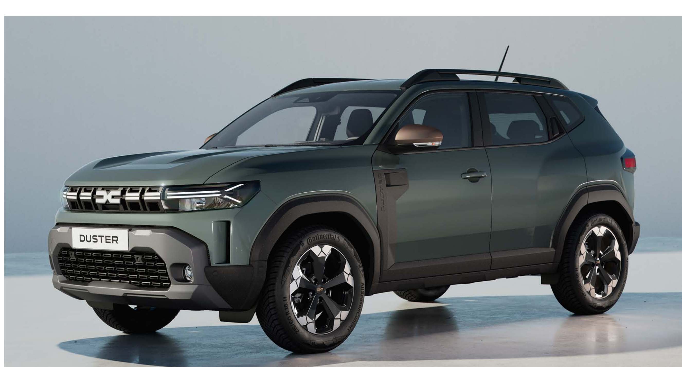
KAKI LICHEN (2)