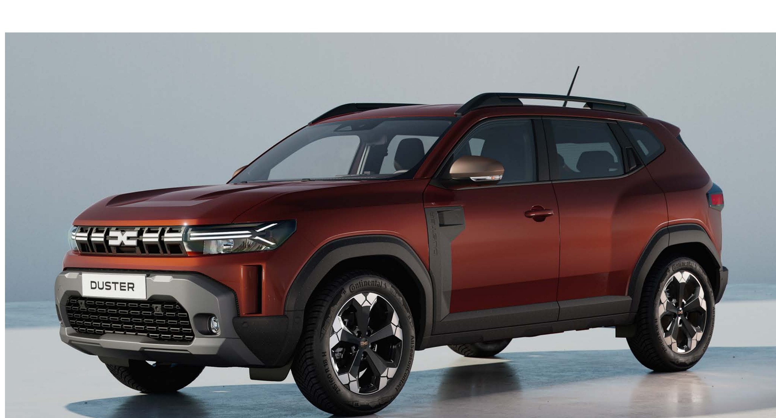
BRUN TERRACOTTA (1)