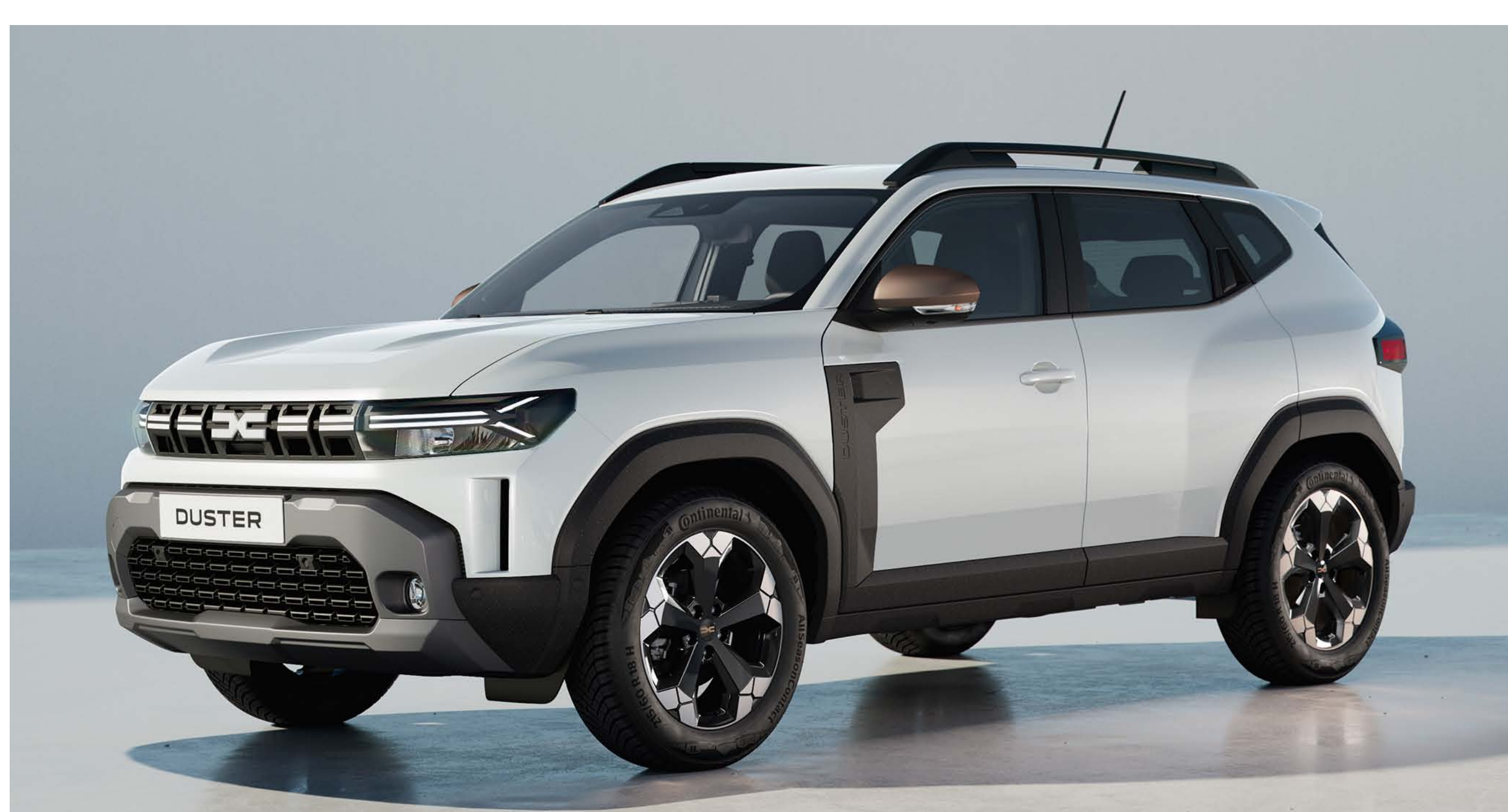
BLANC GLACIER (2)