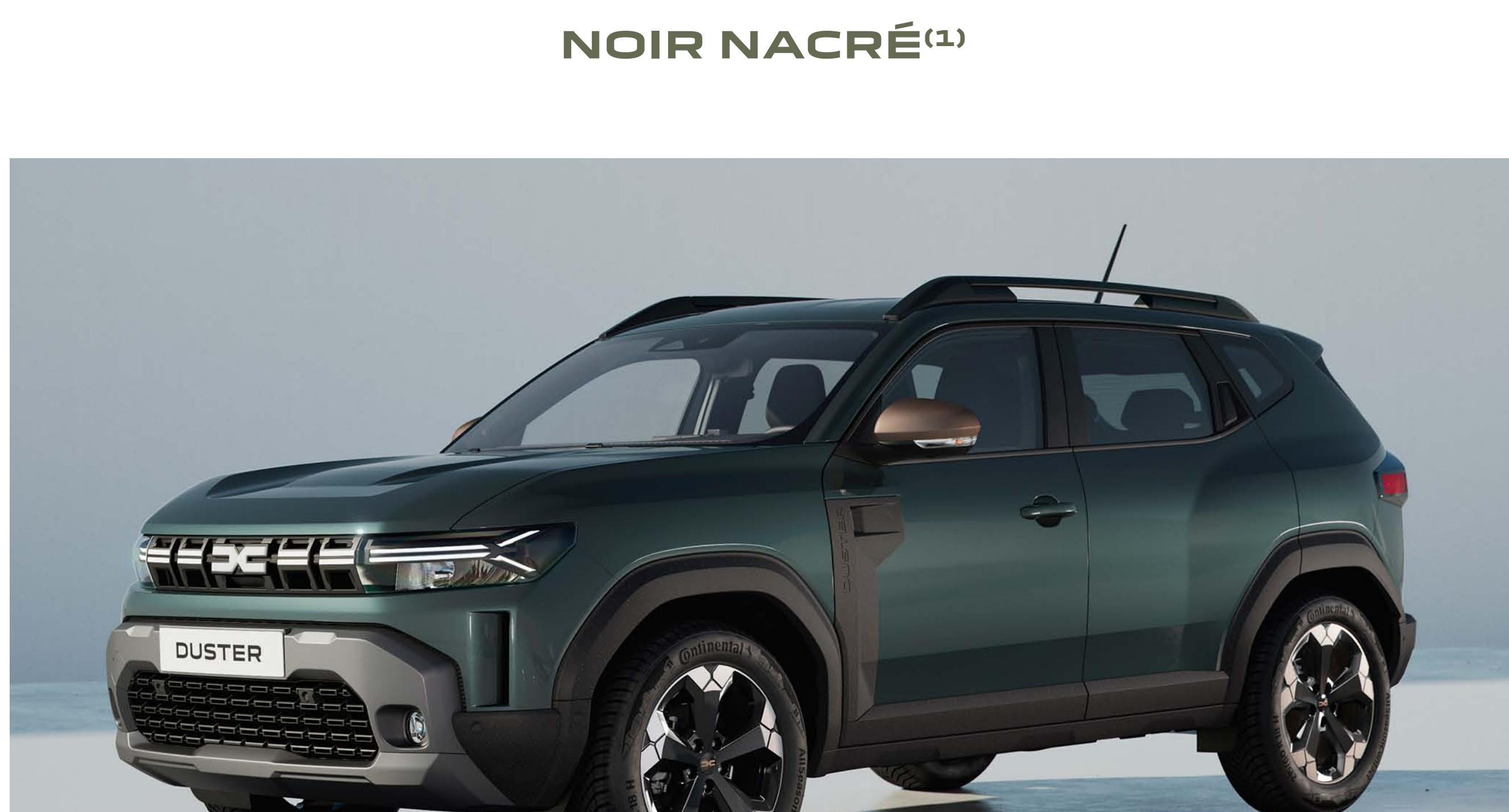
VERT CÈDRE (1)