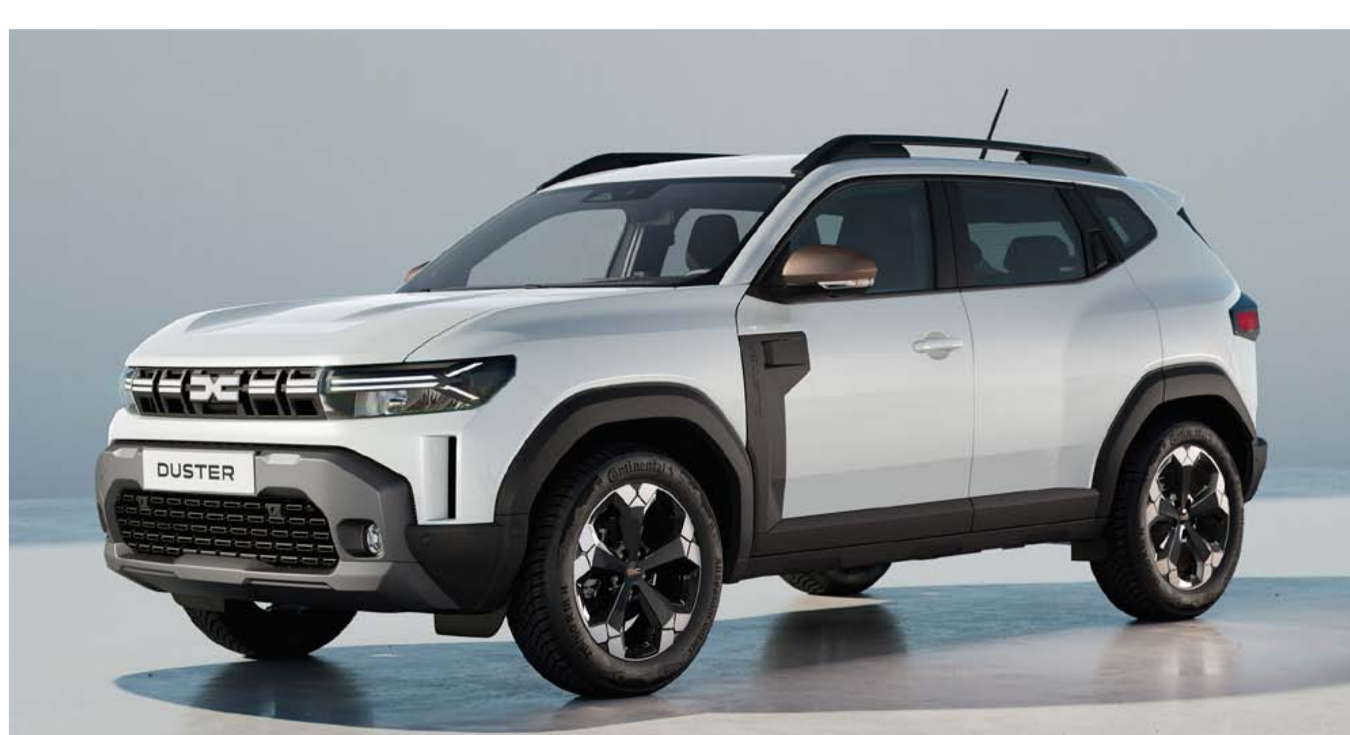
BLANC GLACIER (2)