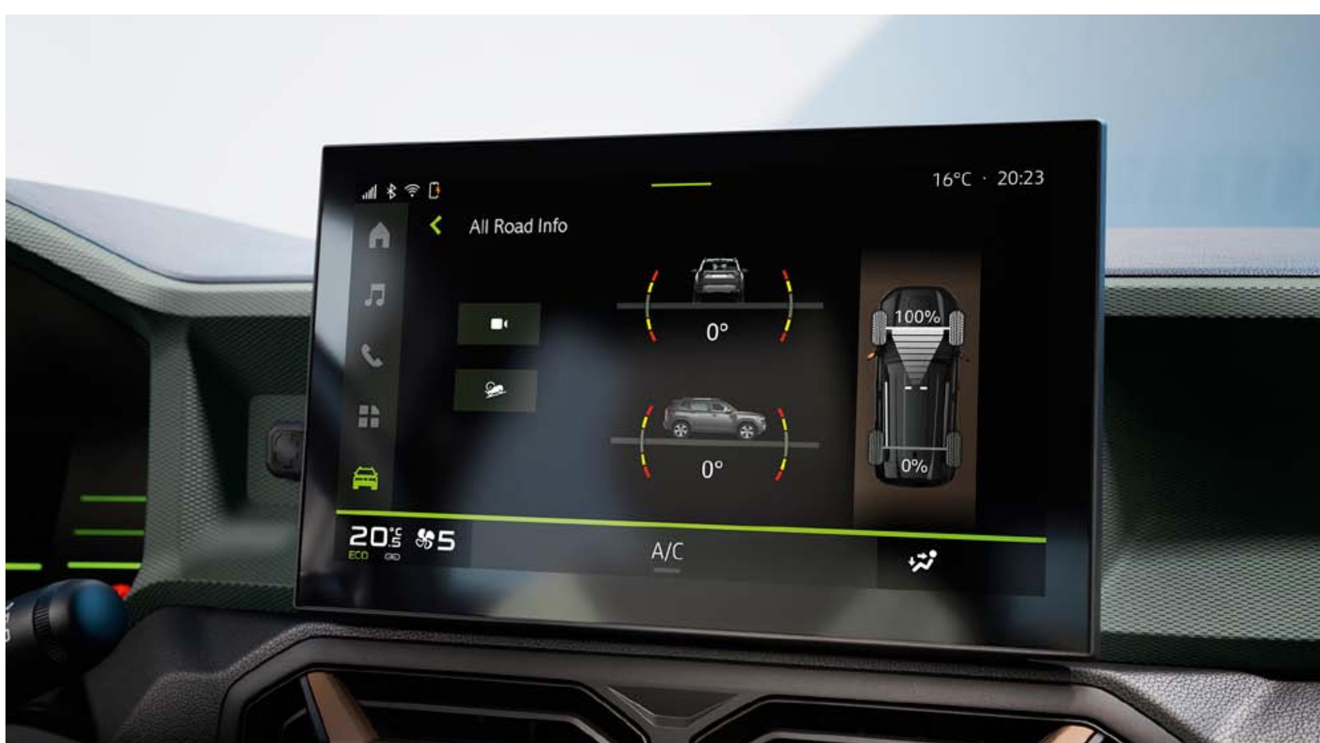
Schermo tattile con altimetro

Con un'altezza da terra aumentata fino a 217 mm, un angolo d'attacco fino a 31° per scalare le pendenze con trazione 4x4 e materiali antigraffio Starkle ® , nuovo Dacia Duster è fedele al suo DNA di SUV e vanta un'eccezionale capacità da fuoristrada.