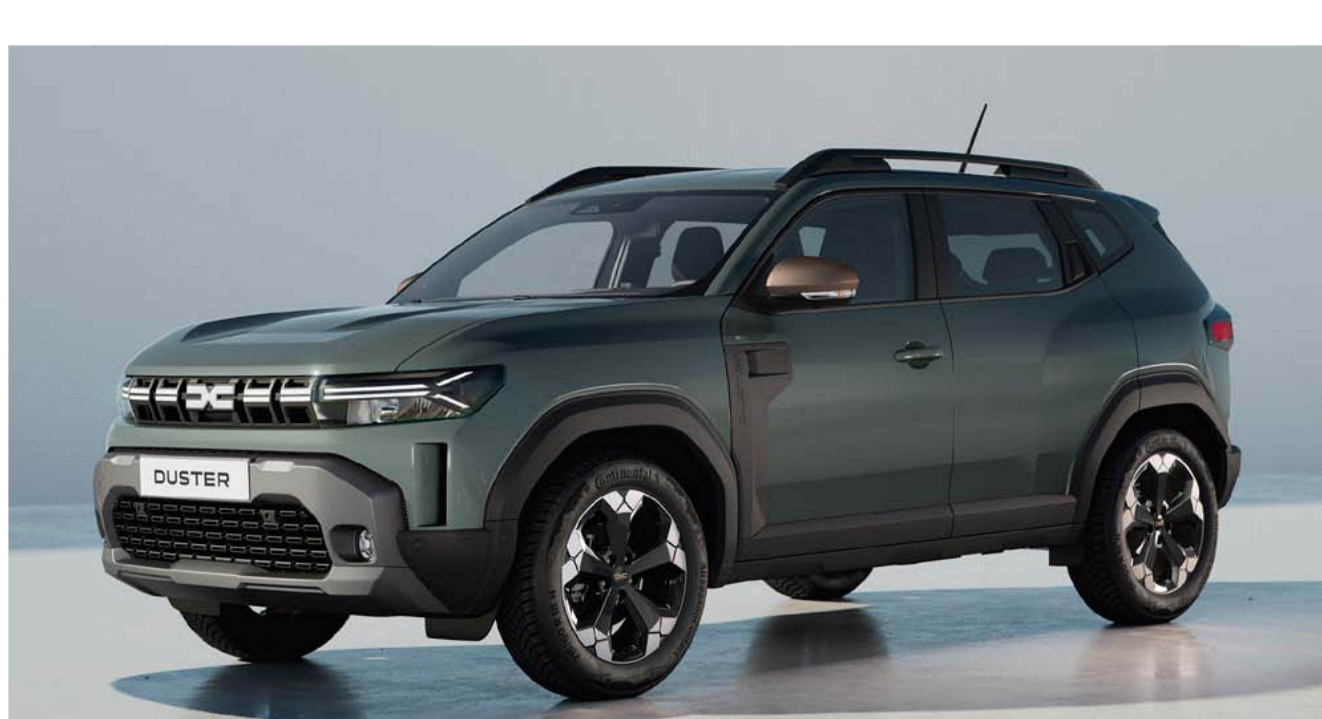
KAKI LICHEN (2)