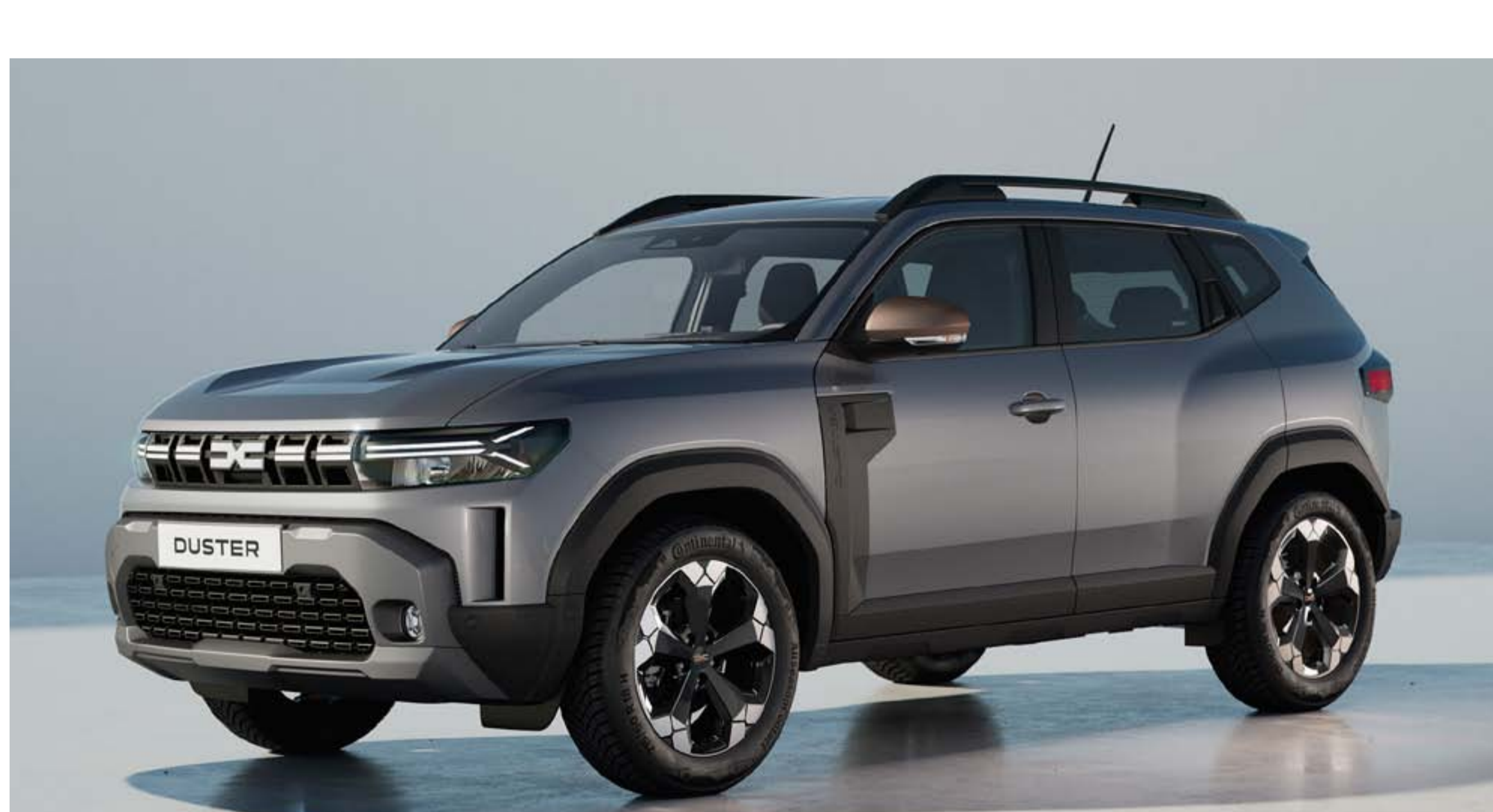
GRIS SCHISTE (1)