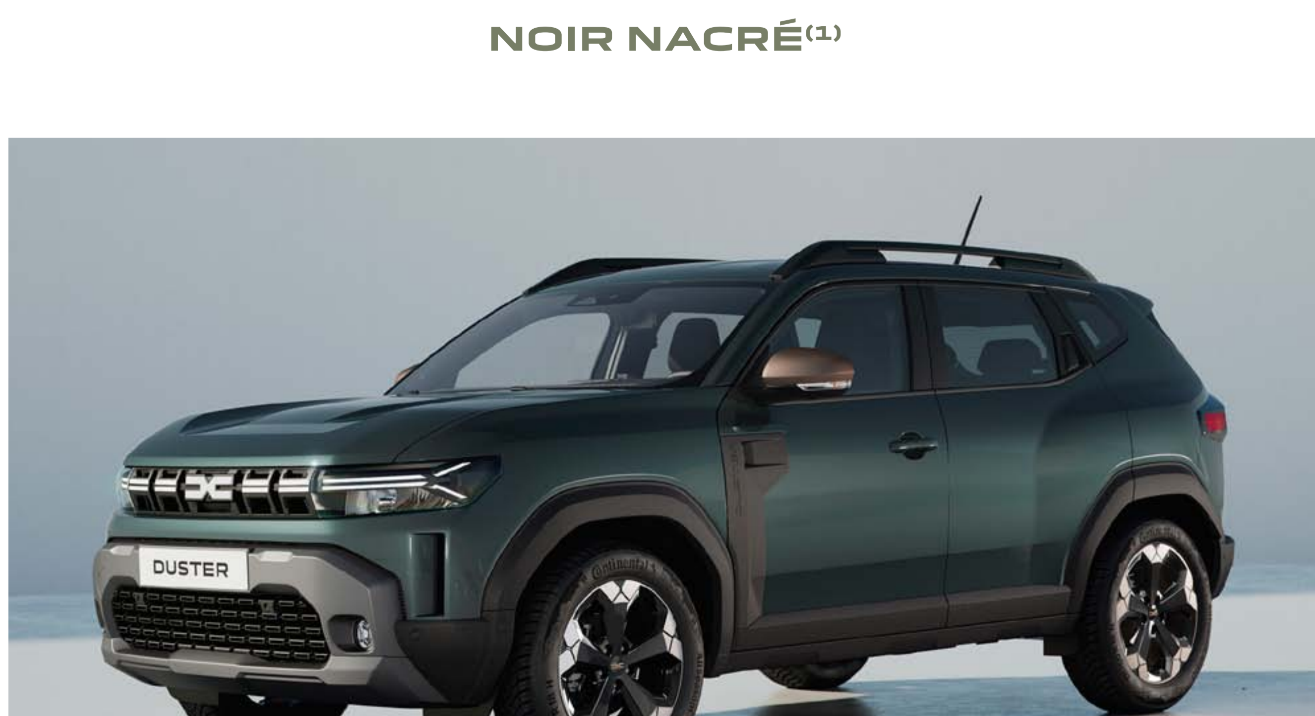
VERT CÈDRE (1)