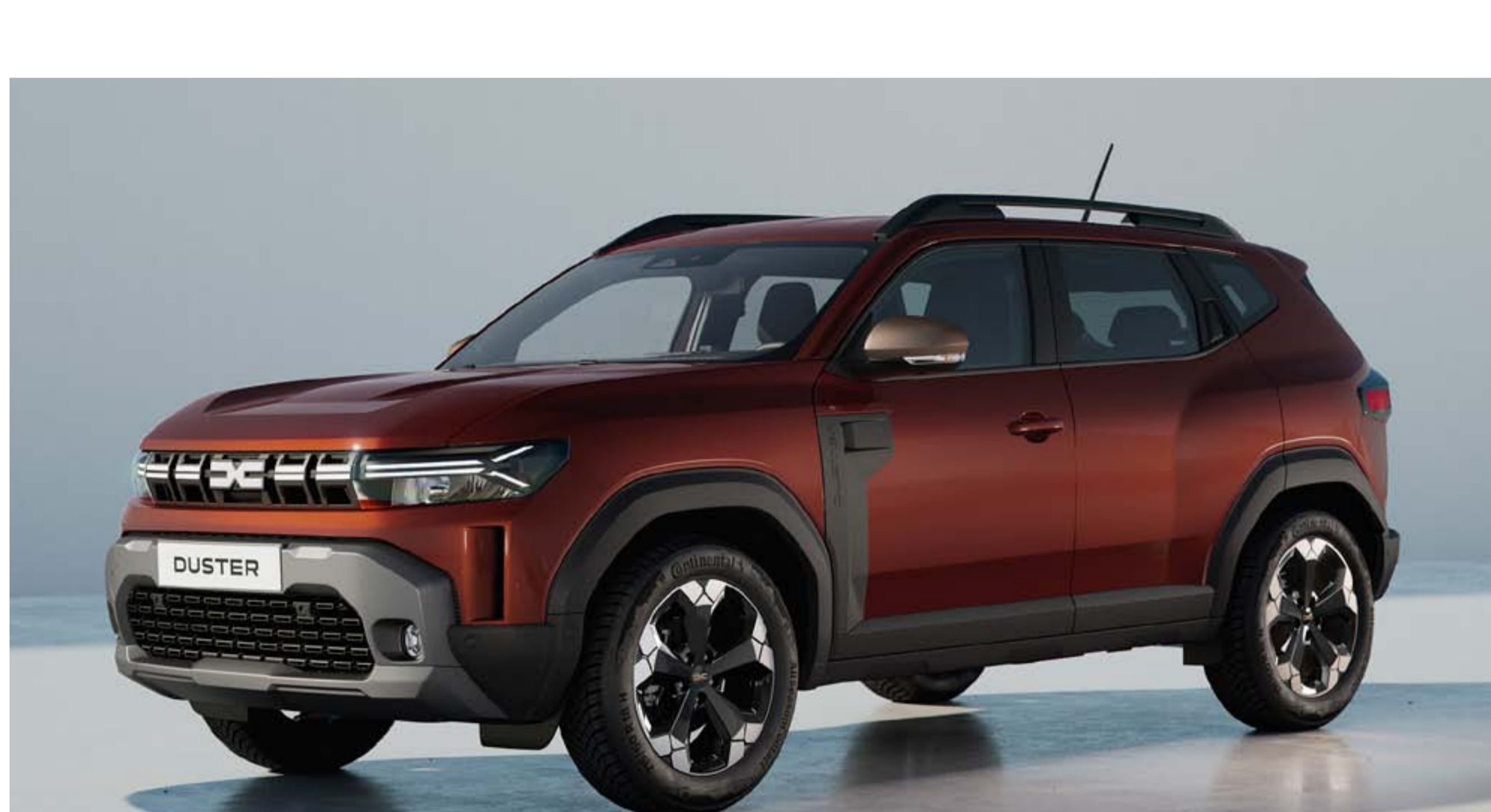
BRUN TERRACOTTA (1)