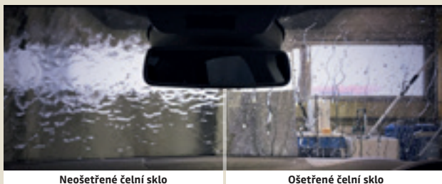
Neošetřené čelní sklo