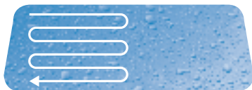
Horizontální aplikace přípravku

Vysušení: Ihned po nanesení přípravku na celý povrch čelního skla utřete sklo čistým suchým hadrem.