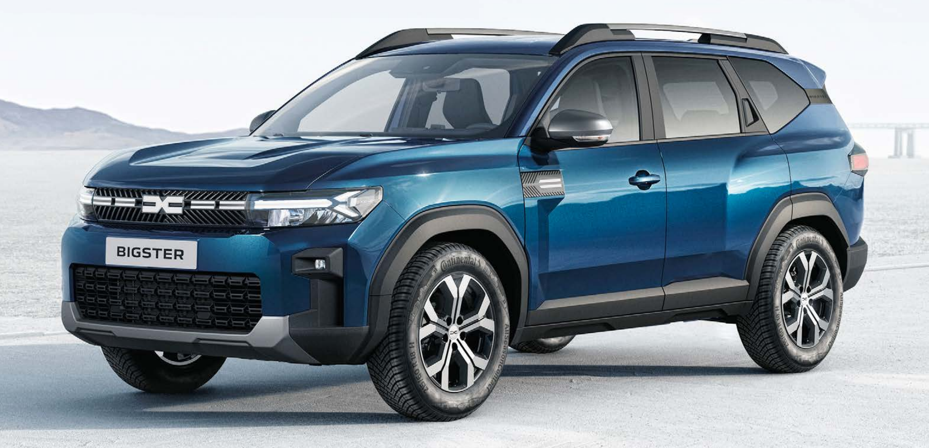
MODRÁ INDIGO (2)