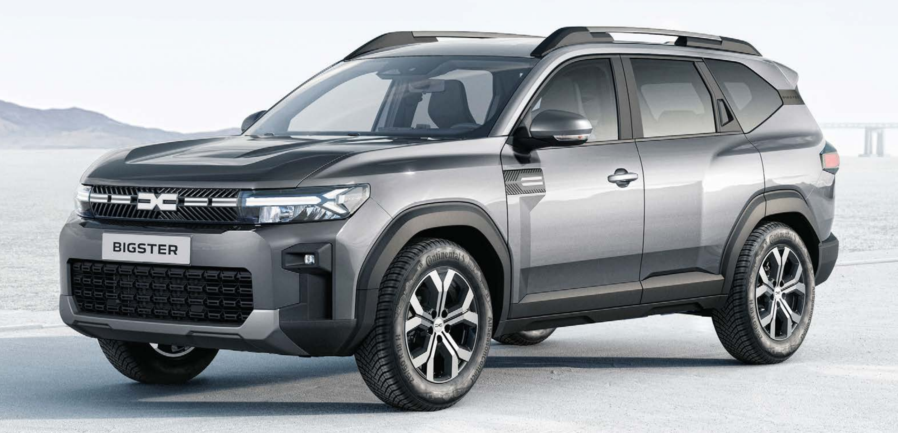
ŠEDÁ SCHISTE (2)