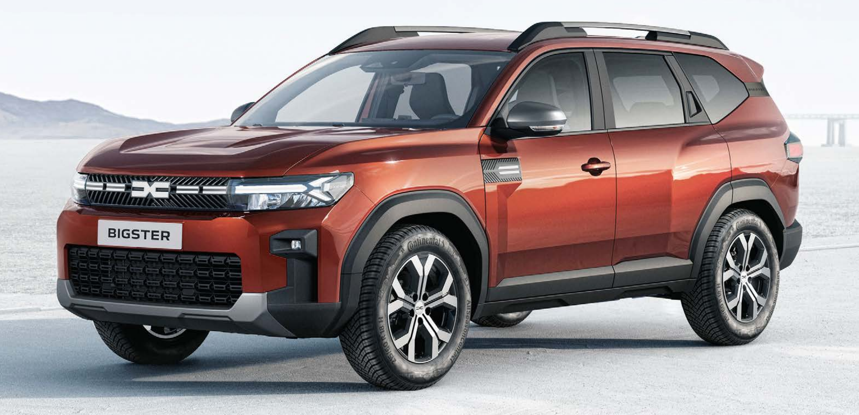
HNĚDÁ TERRACOTTA (2)

(1) Nemetický lak. (2) Metalický lak. Fotografie nejsou smluvně závazné.