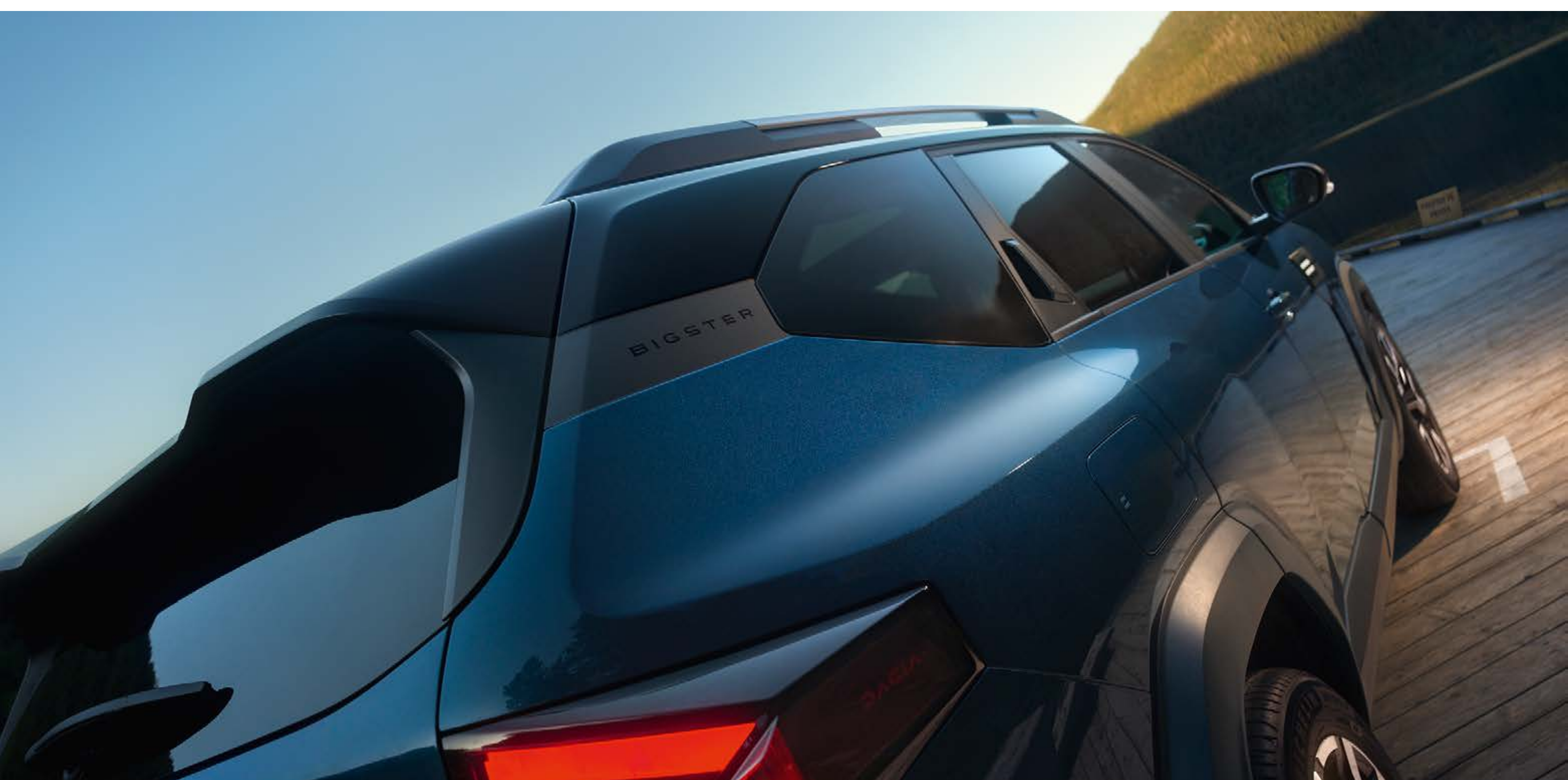
Exkluzivní dvoubarevné provedení karoserie