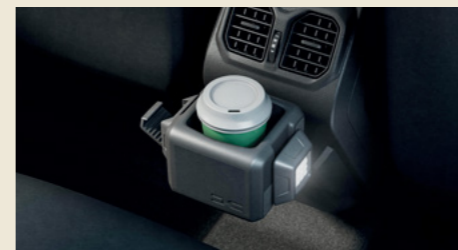
Držák nápojů YOUCLIP