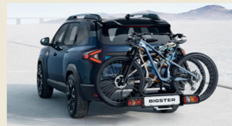
Nosič jízdních kol na tažné zařízení