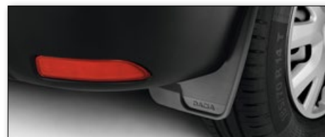
Přední a zadní zástěrky

V ceně vozu není zahrnuta povinná výbava.