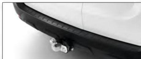
Tažné zařízení Standard vč. kabeláže