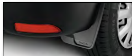
Přední a zadní zástěrky