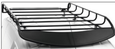
Střešní ocelová galerie