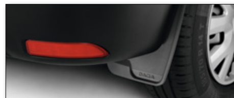
Přední a zadní zástěrky