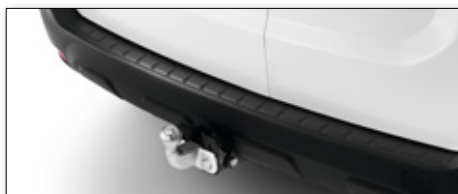
Tažné zařízení Standard vč. kabeláže