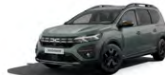
ZELENÁ DUSTY (2)