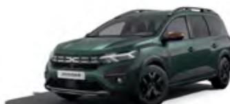
ZELENÁ CĚDRE (1)