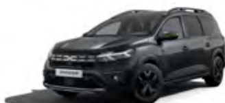
ČERNÁ NACRÉ (1)