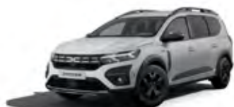
BÍLÁ GLACIER (2)