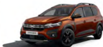
HNĚDÁ TERRACOTTA (1)