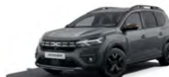
ŠEDÁ URBAN (2)