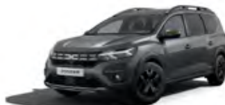
ŠEDÁ SCHISTE (1)