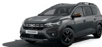
ŠEDÁ SCHISTE (1)