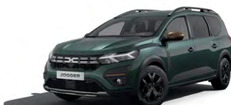
ZELENÁ CĚDRE (1)