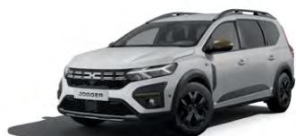
BÍLÁ GLACIER (2)