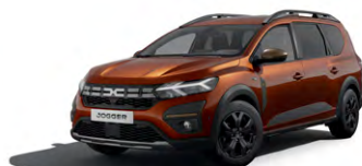
HNĚDÁ TERRACOTTA (1)