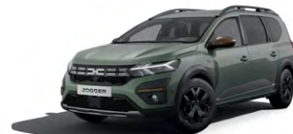
ZELENÁ DUSTY (2)