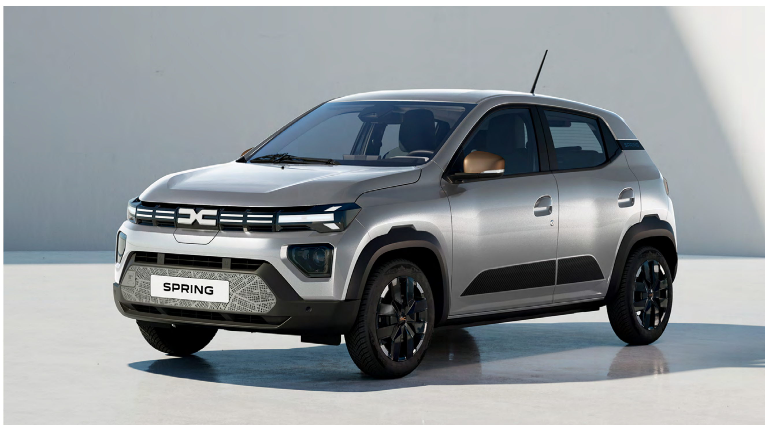
LIGHTNING-GRAU 1, 2