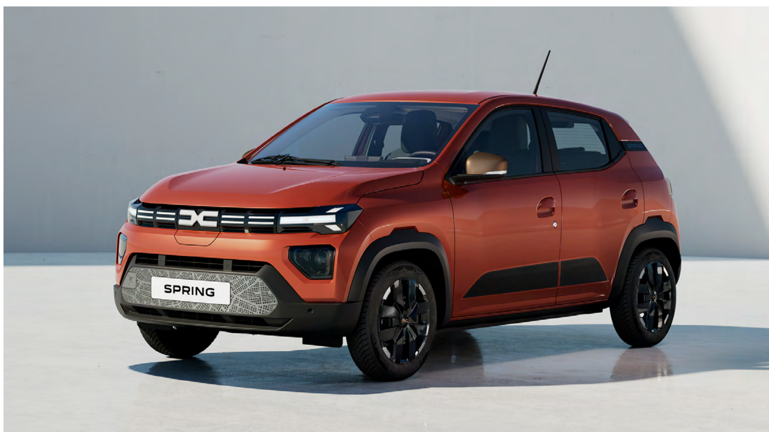
BRICK RED 1