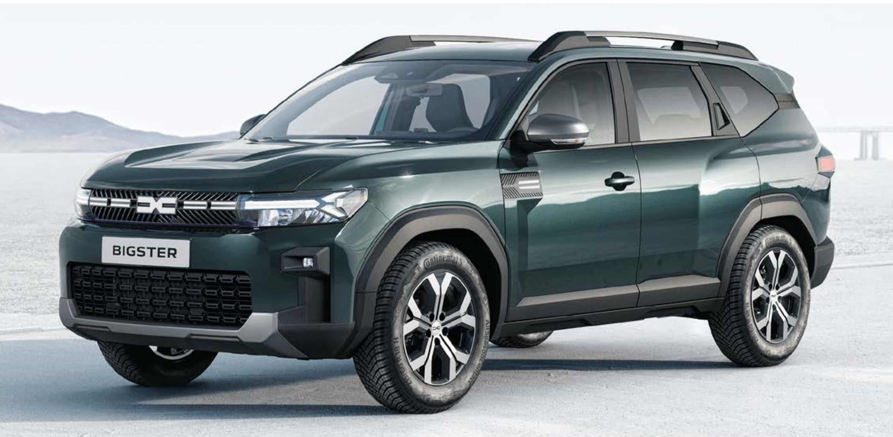
VERDE CEDRO (2)