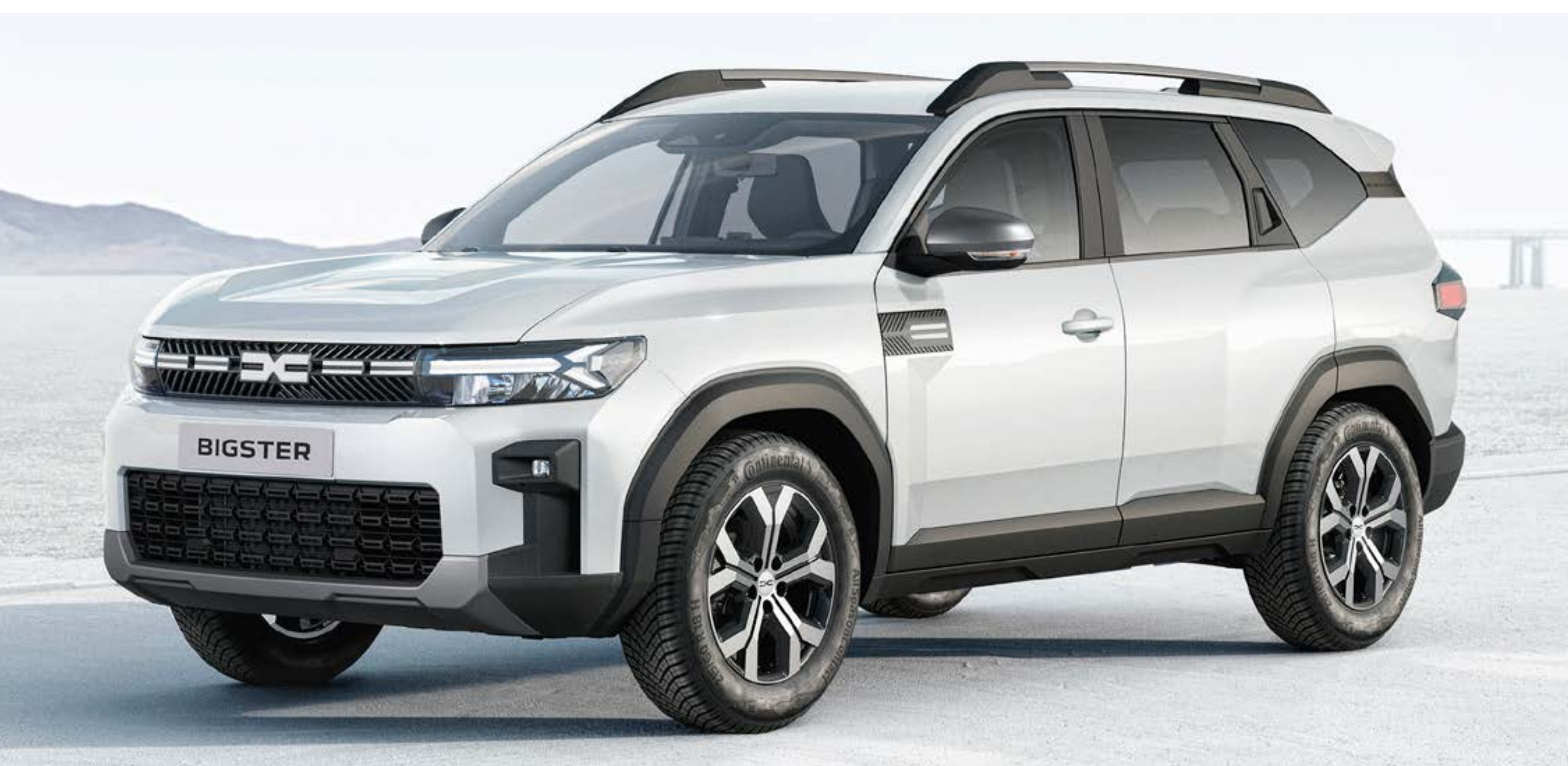
BLANCO GLACIAR (1)