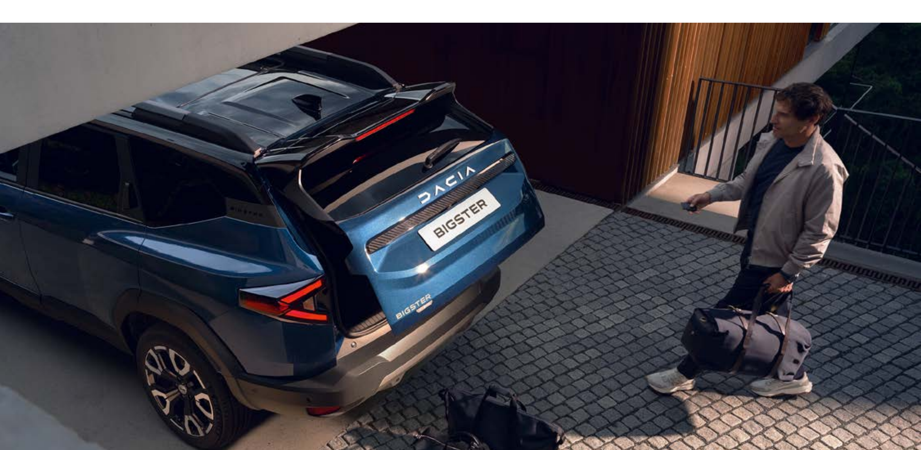
Portón trasero con apertura eléctrica