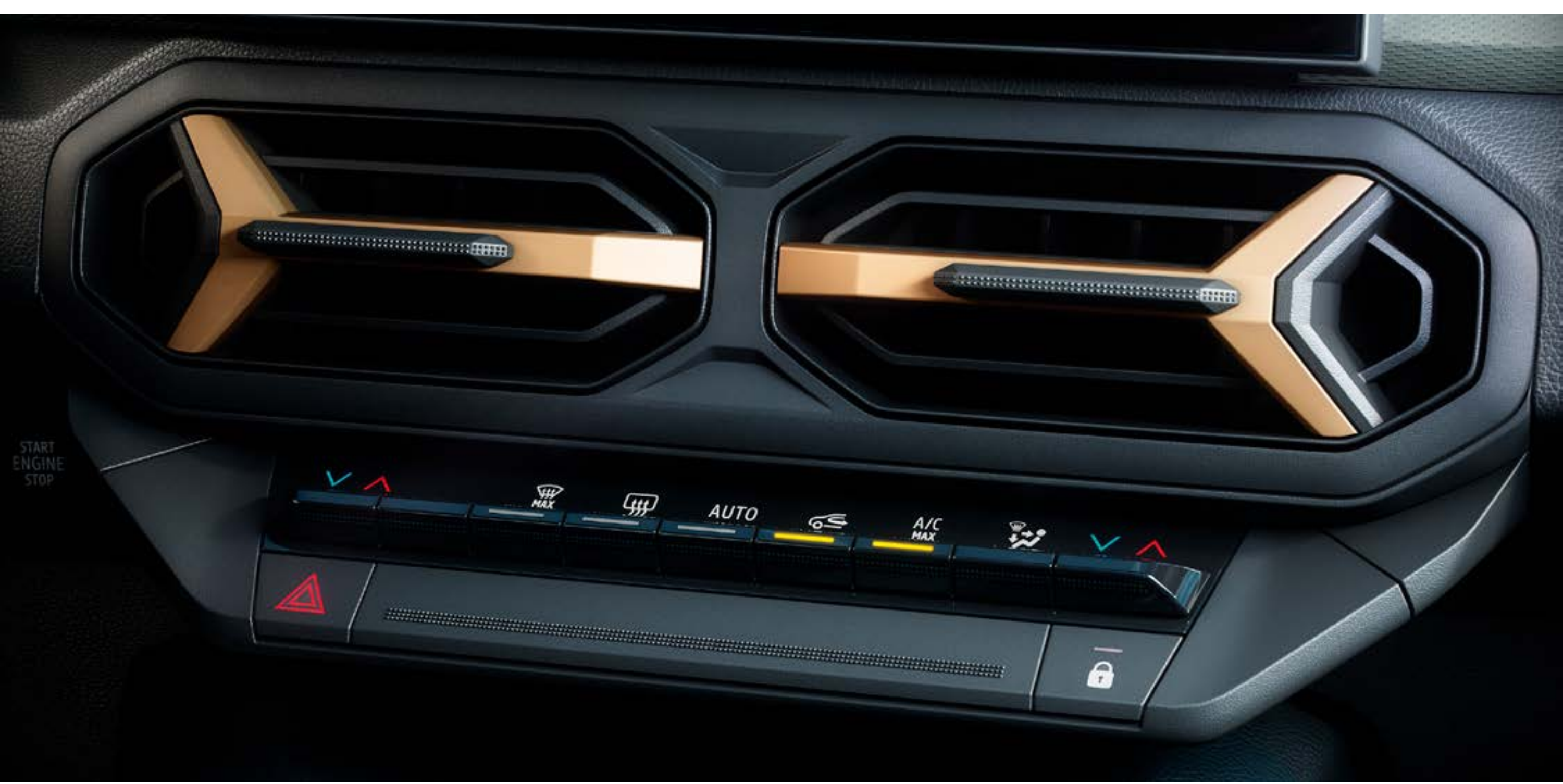
Climatización automática bizona

Diseñado para el confort de sus cinco ocupantes, el ambiente interior cuenta con un tratamiento de insonorización mejorada, un sistema de sonido 3D de Arkamys® con 6 altavoces, además de climatización automática bizona en la parte delantera, con salidas de aire en la parte trasera.