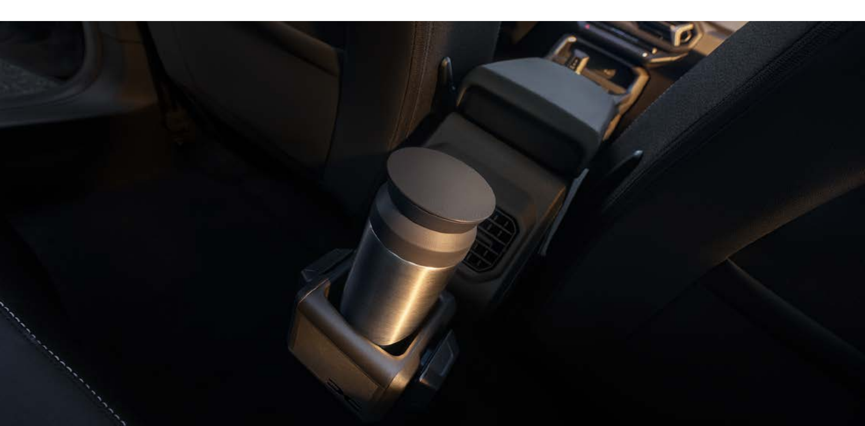
YouClip 3 en 1