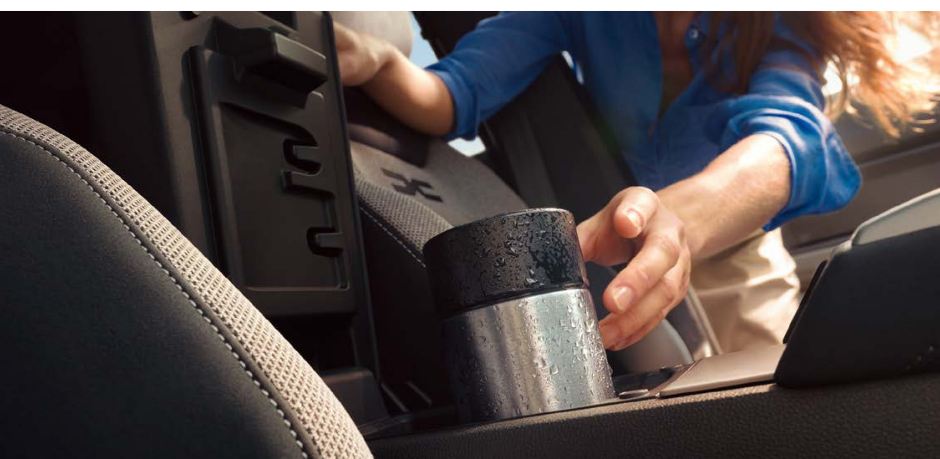
Almacenamiento refrigerado en la parte delantera

Y no te pierdas el ingenioso sistema de fijación YouClip: 5 puntos repartidos por todo el vehículo, con la posibilidad de añadir, como accesorio, dos puntos adicionales en el soporte del reposacabezas. Con este sistema podrás colocar de forma segura todos tus objetos (teléfono, tablet, botella, etc.).