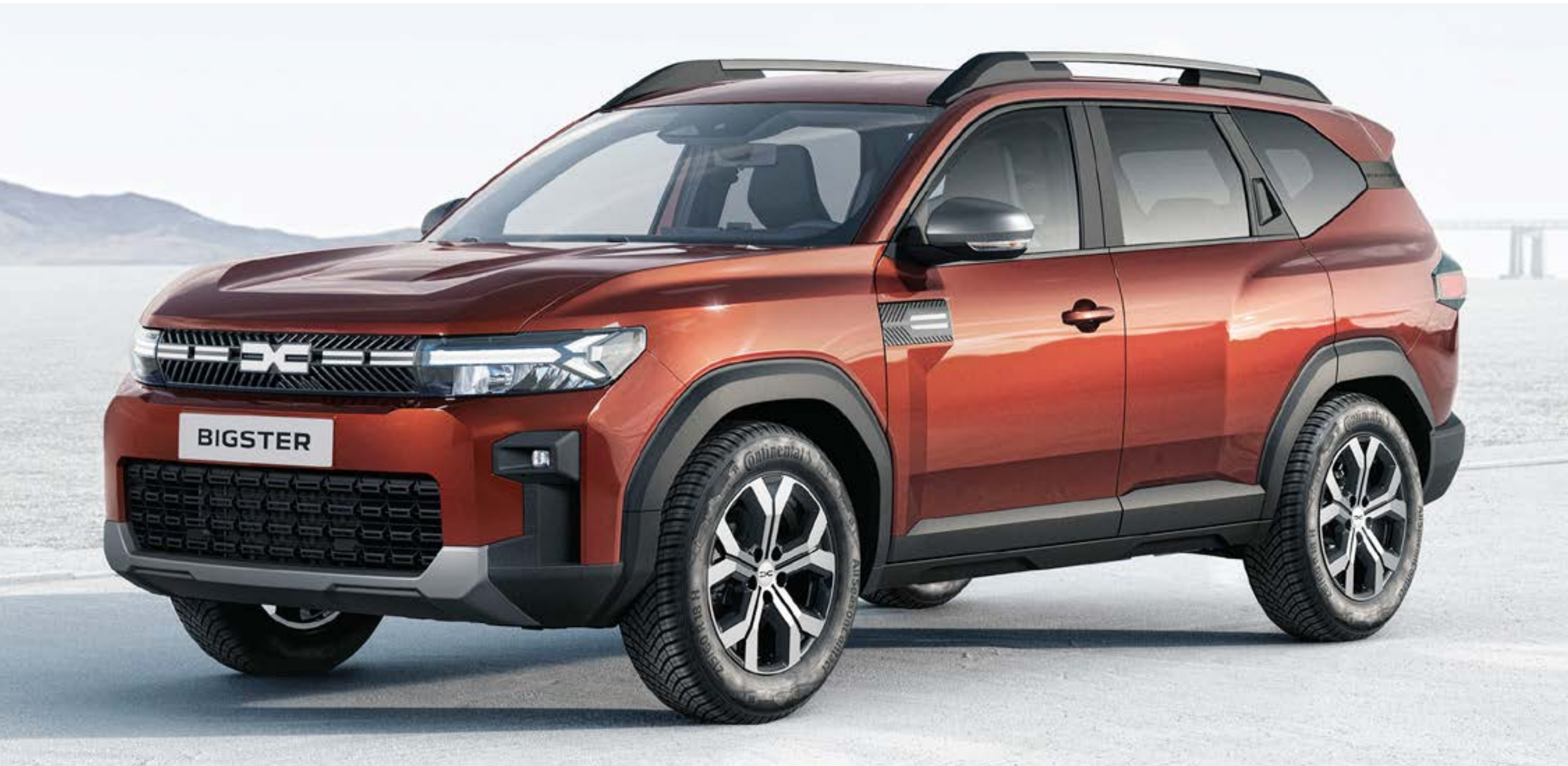
NARANJA TERRACOTA (2)

(1) Pintura opaca. (2) Pintura metalizada. Imágenes no contractuales.