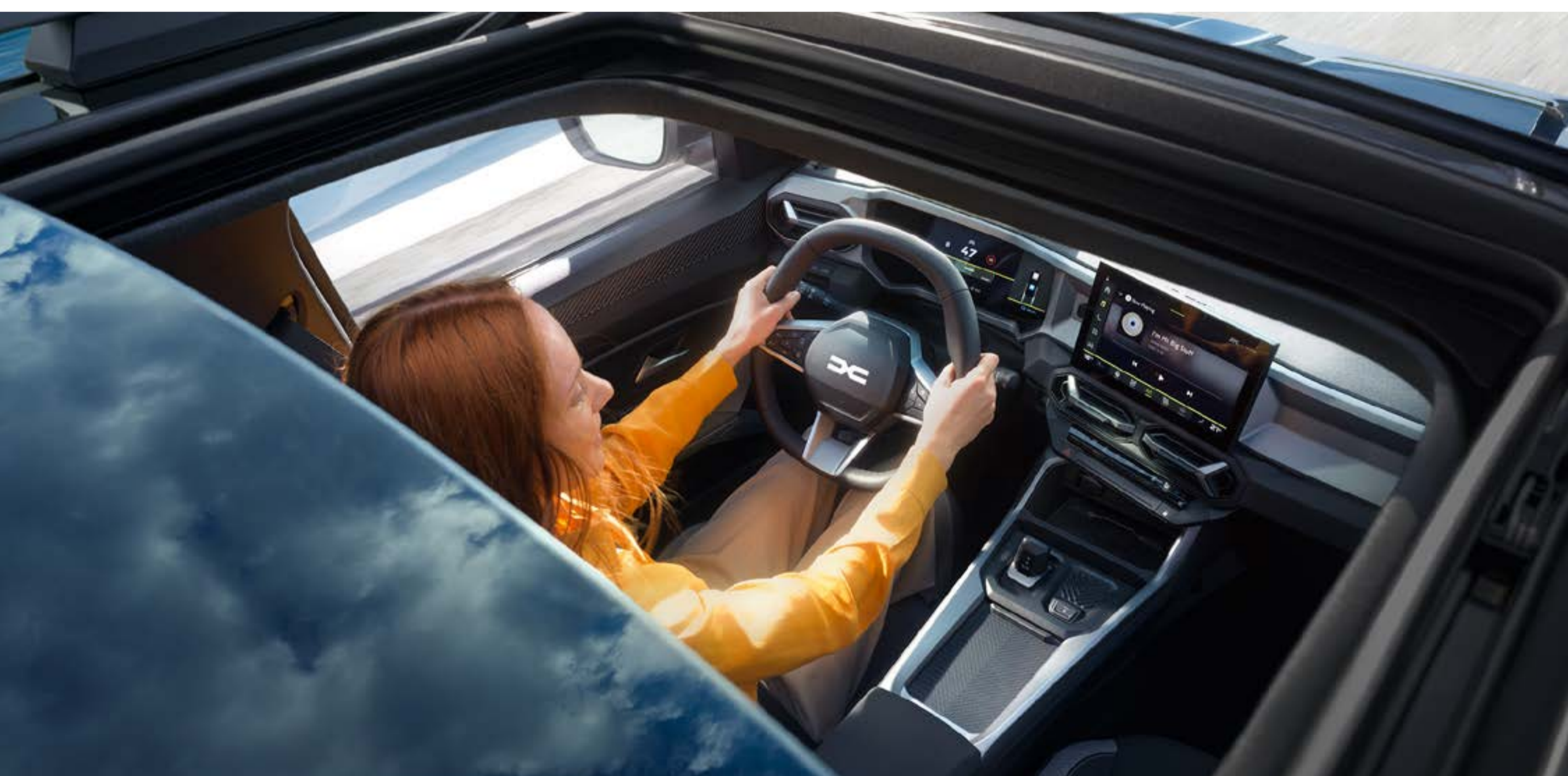
Techo solar panorámico con apertura eléctrica

Disfruta de la elegancia de la versión bitono, del techo solar panorámico que aporta una luminosidad única al interior, así como de un toque adicional de distinción con el exclusivo color Azul Índigo.