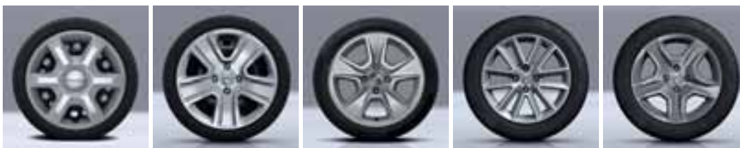
15" UKRASNI POKROV ARACAJU