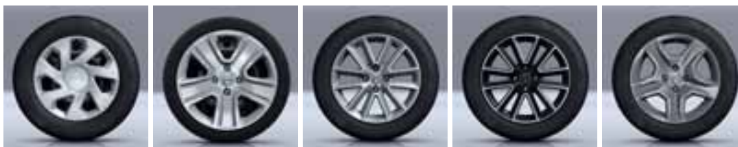
15" UKRASNI POKROV GROOMY