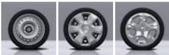
14" UKRASNI POKROV BOL 15" UKRASNI POKROV TISA 15" NAPLATCI EMPREINTE