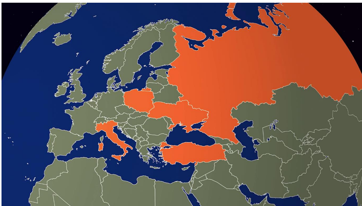
Najveći ljubitelji LPG-a su Rusija, Turska, Poljska, Ukrajina i Italija.