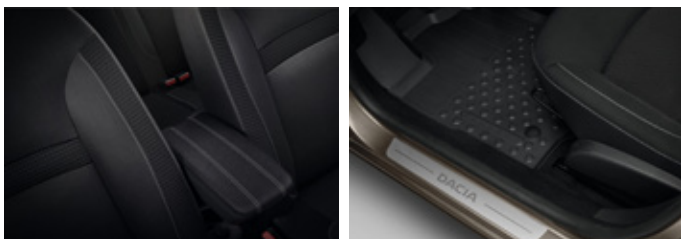
Vízszintes csomagtér háló, első könyöktámasz, gumiszőnyeg 64 990 Ft