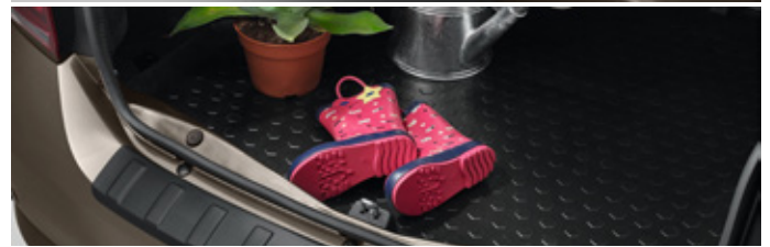
Hattyúnyakas vonóhorog, csomagtér tálca 130 990 Ft