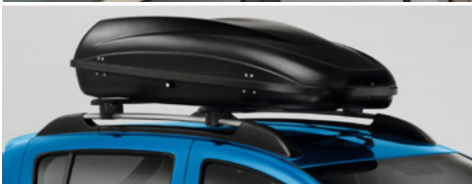
Acél tetőrúd, merevfalú tetőbox 93 990 Ft