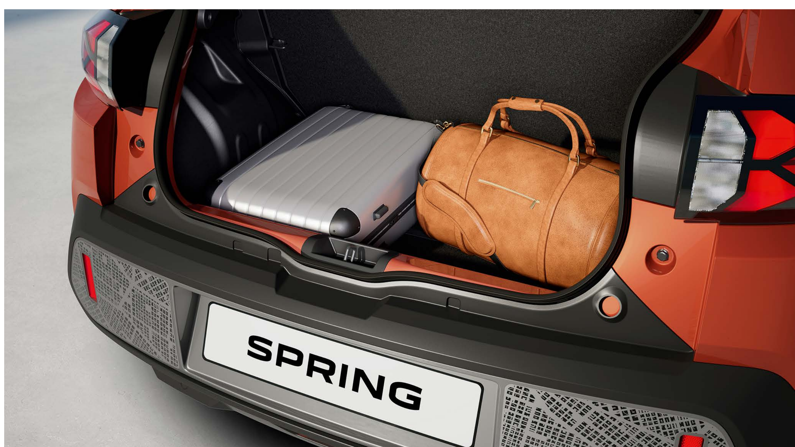
Bagagliaio da 308 litri/288 dm 3 (standard VDA)