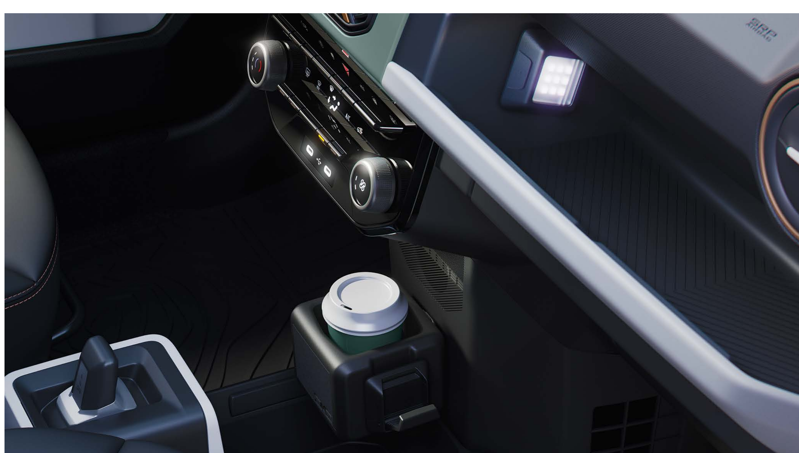
Accessorio 3-in-1 YouClip (luce, portabicchieri, appendino)

Nuova Dacia Spring è stata concepita per semplificarti la vita, grazie ai suoi 308 litri di bagagliaio, il più ampio della categoria, e all'ingegnoso accessorio 3-in-1 YouClip.