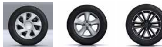
ENJOLIVEURS 15" GROOMY JANTES ALLIAGE 15" CHAMADE JANTES ALLIAGE 16" ALTICA NOIRES DIAMANTEES