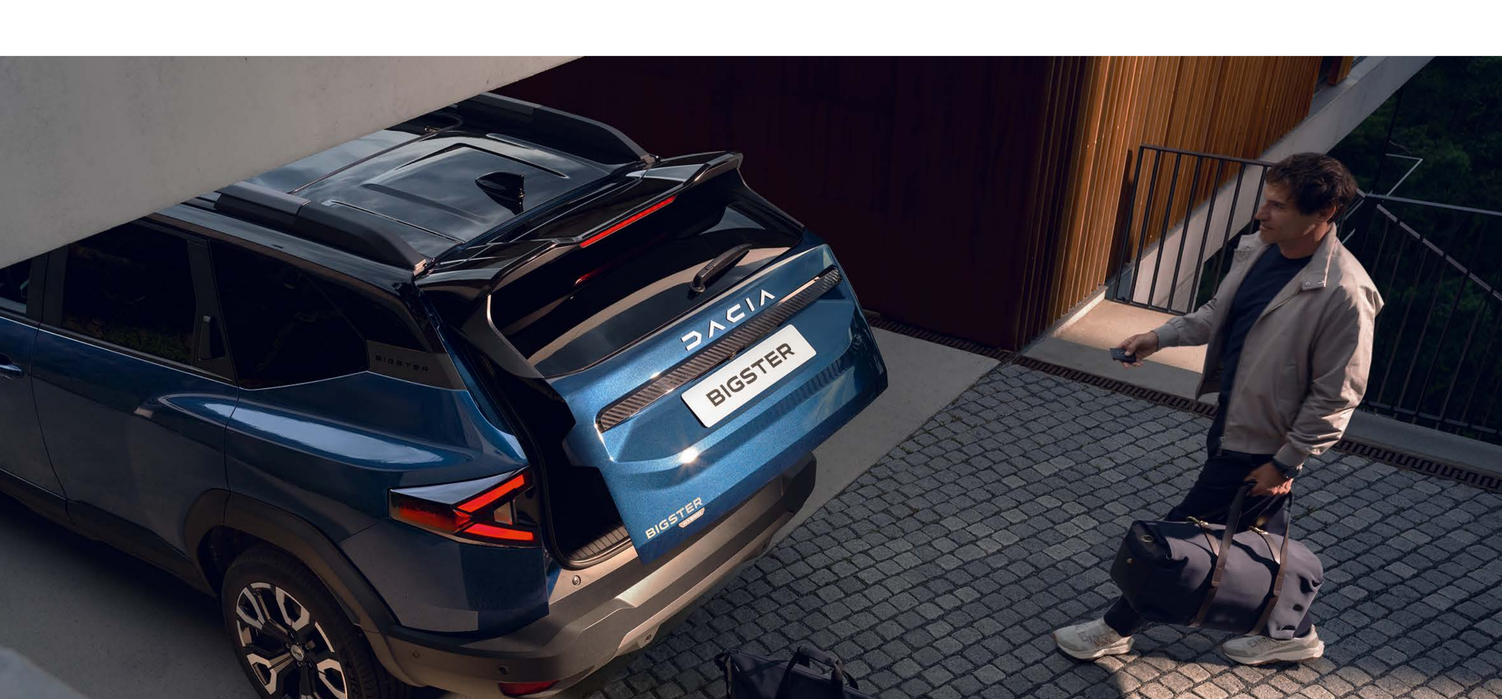
Elektrisch bedienbare achterklep