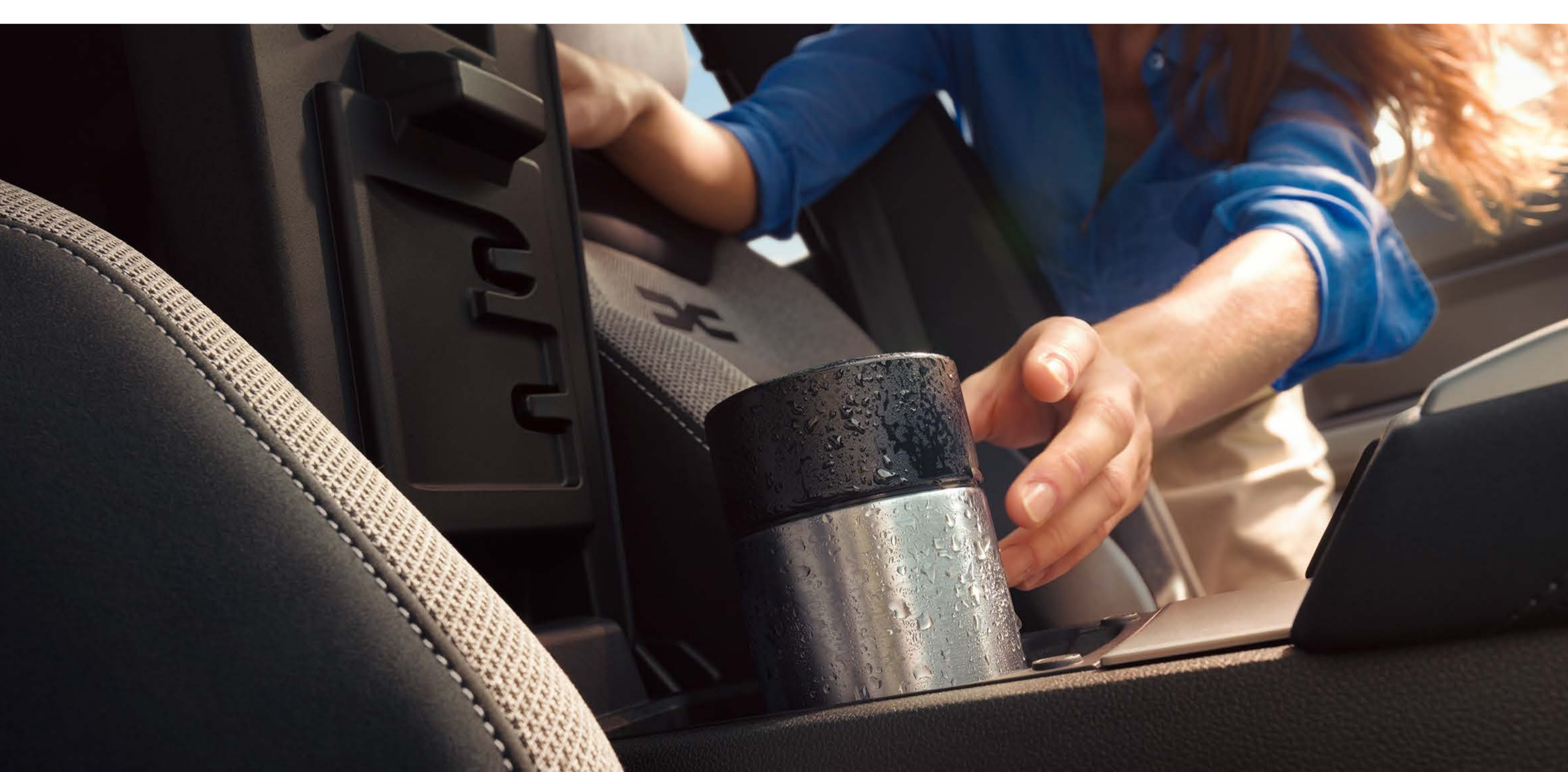
Gekoeld opbergvak in middenconsole

Bovendien kun je gebruik maken van het handige YouClip-systeem: vijf slimme bevestigingspunten in de auto, met de optie om er twee extra toe te voegen in de hoofdsteunen. Ideaal om je telefoon, tablet, beker of wat je maar wilt veilig en binnen handbereik op te bergen!