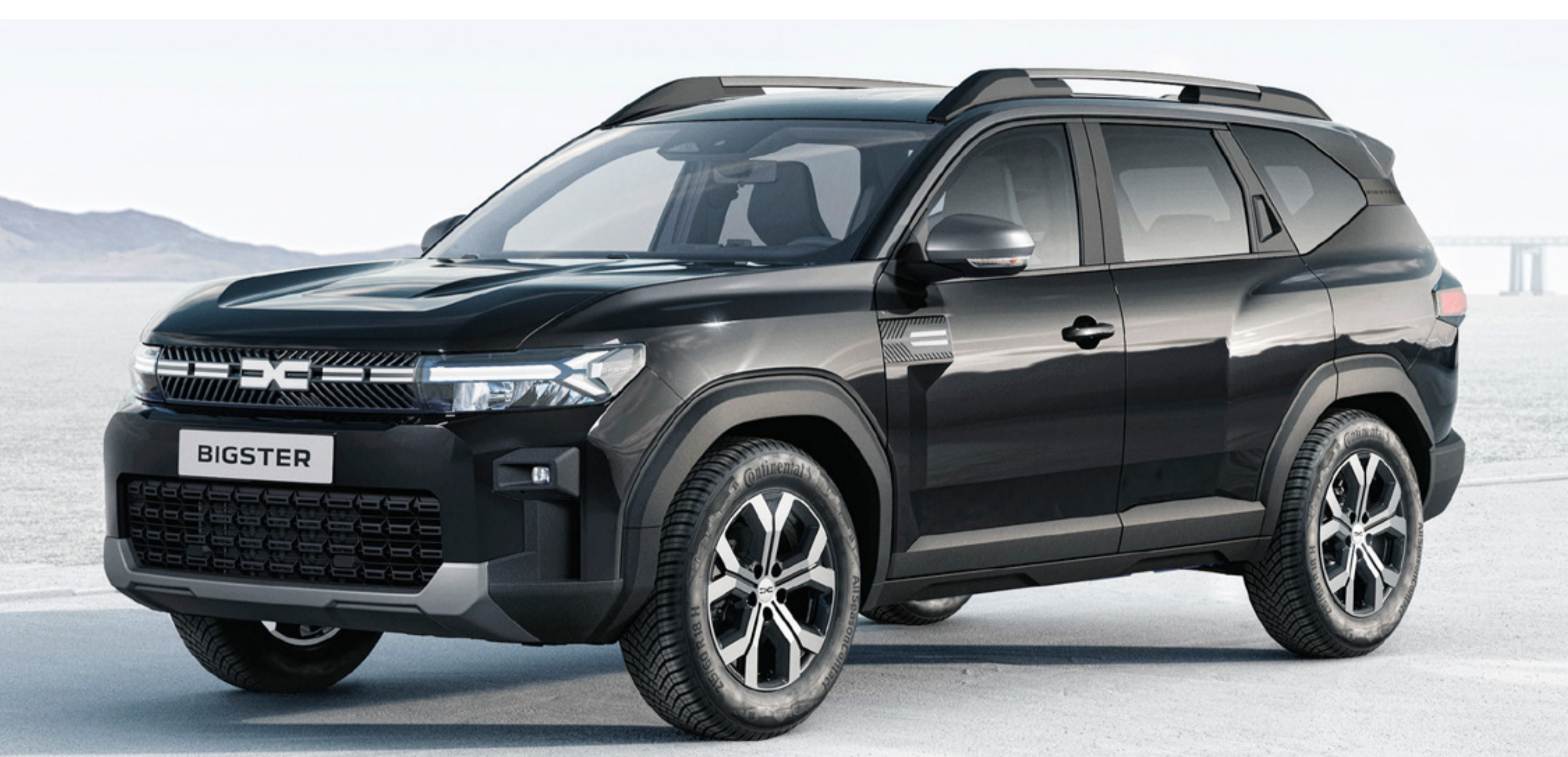
CZARNA PERŁA (2)