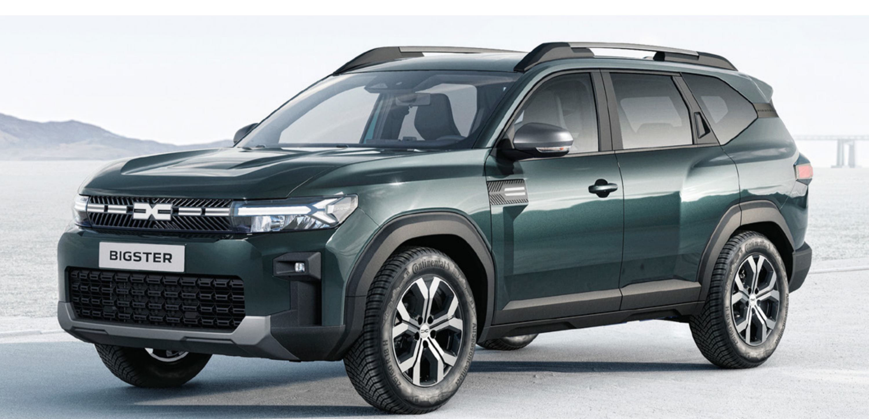
ZIELONY CEDAR (2)