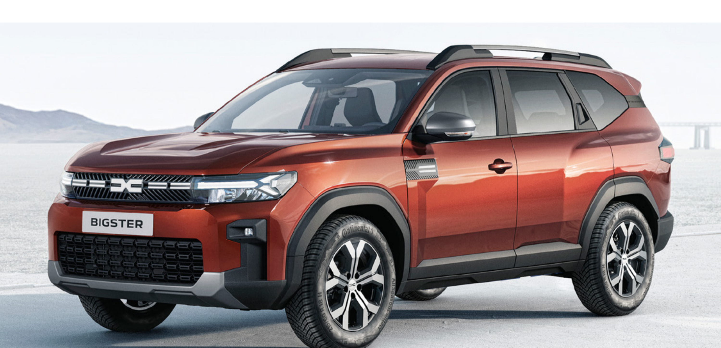
BRĄZOWY TERRACOTA (2)

(1) Lakier niemetalizowany. (2) Lakier metalizowany. Zdjęcia poglądowe.