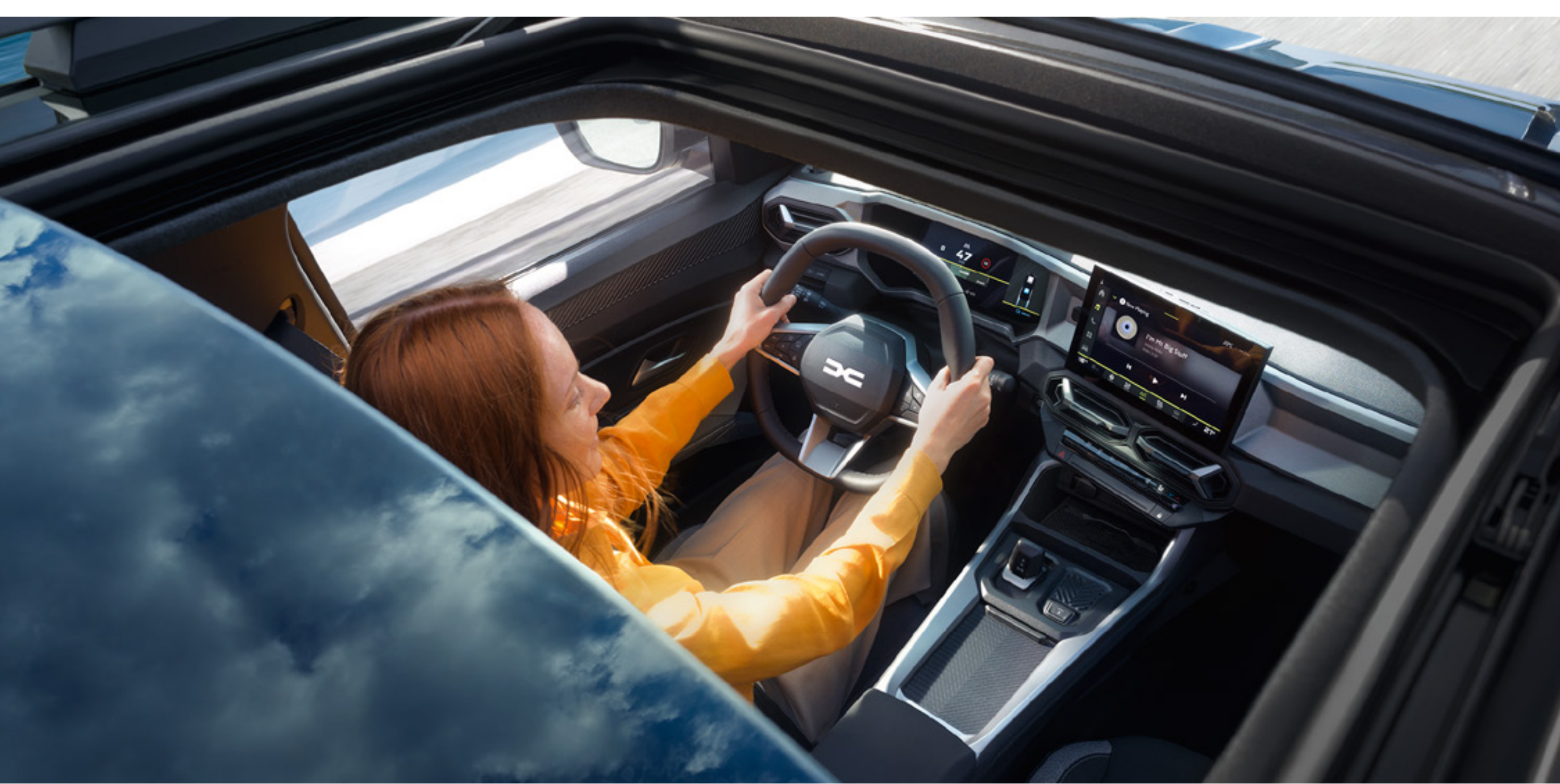
Panoramiczny otwierany szklany dach

Bigster z dwukolorowym nadwoziem prezentuje styl niewymuszonej elegancji. Panoramiczny otwierany szklany dach rozświetla wnętrze kabiny, a dodatkowym wyróżnikiem tej wersji jest specjalny lakier w kolorze niebieskim Indigo. Każdy znajdzie odpowiedniego Bigstera dla siebie.