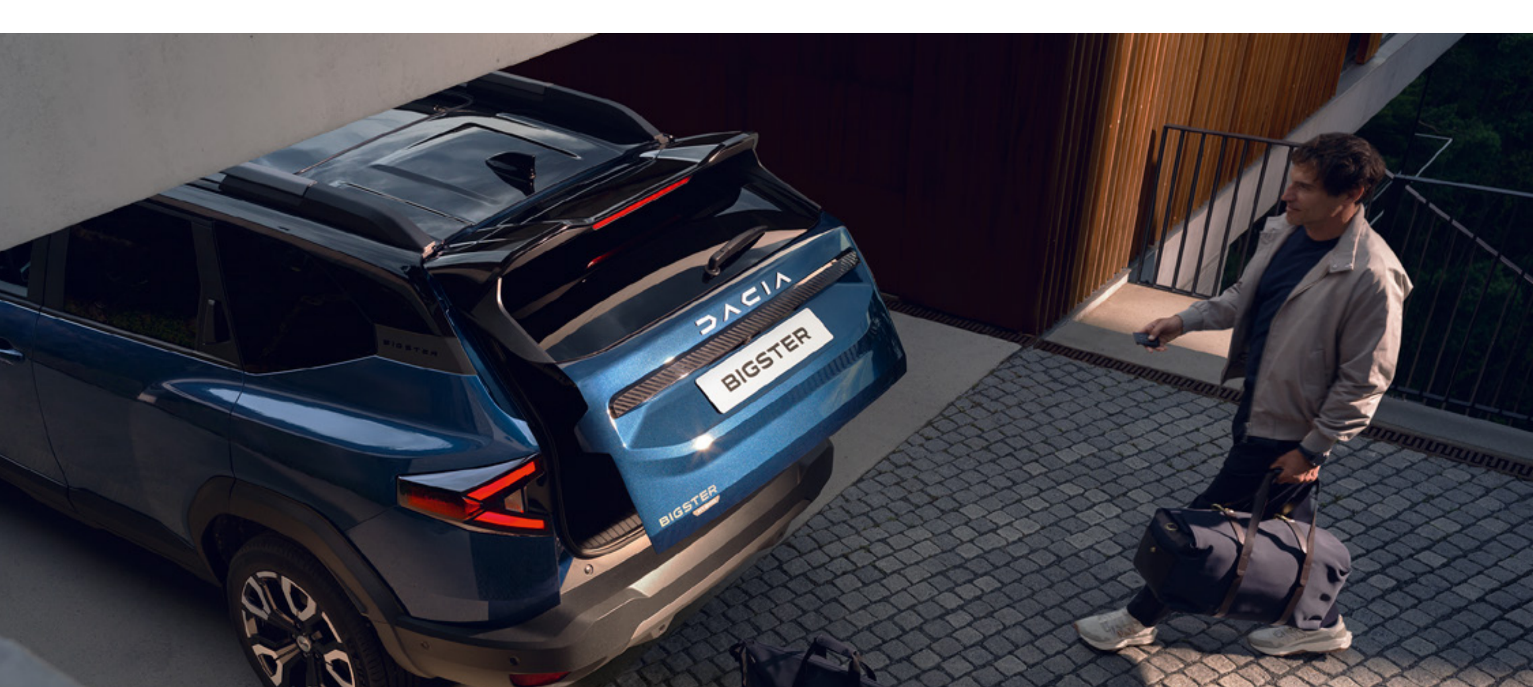
Elektrycznie otwierana kłapa bagażnika