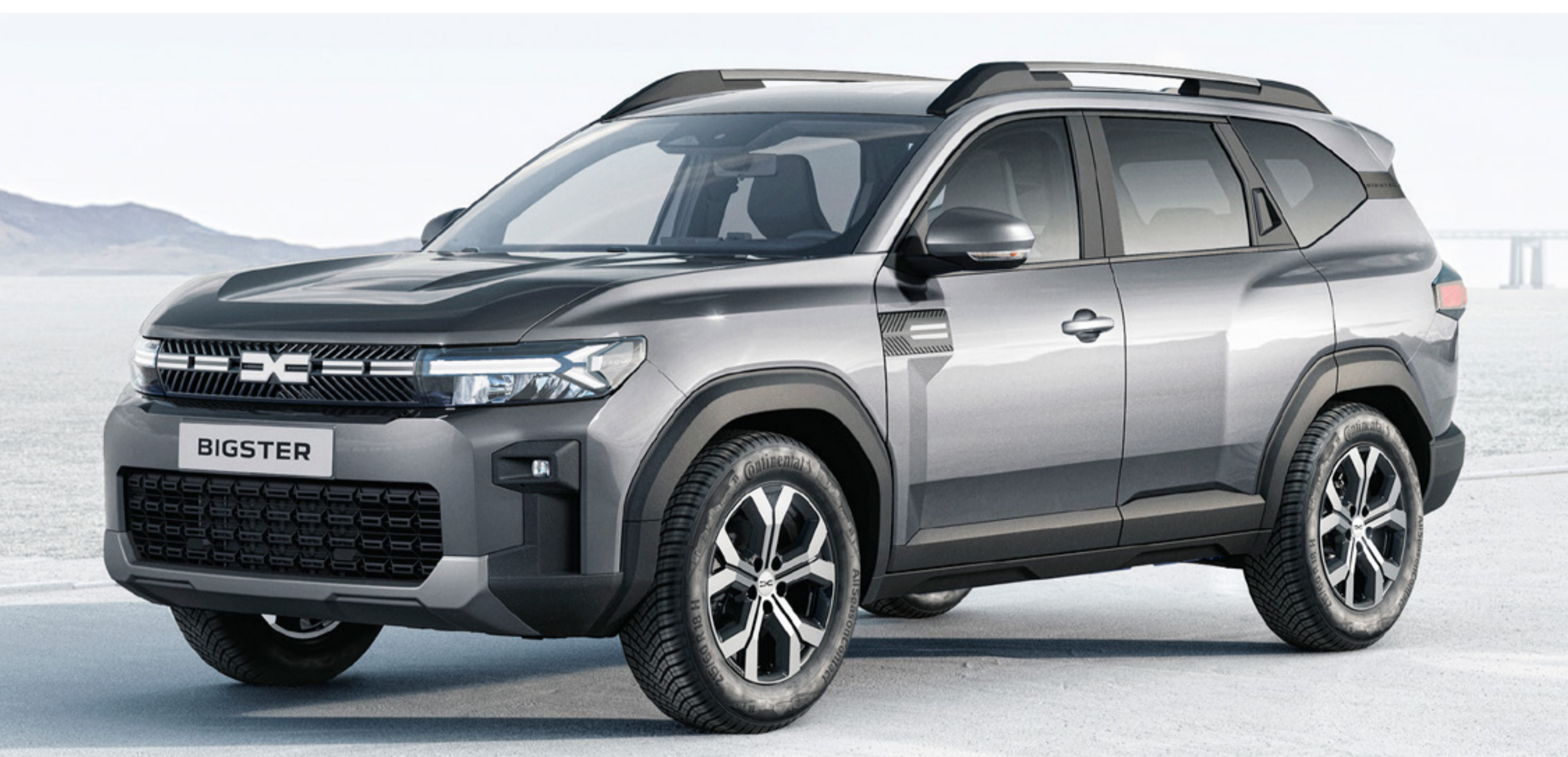
SZARY SCHIST (2)