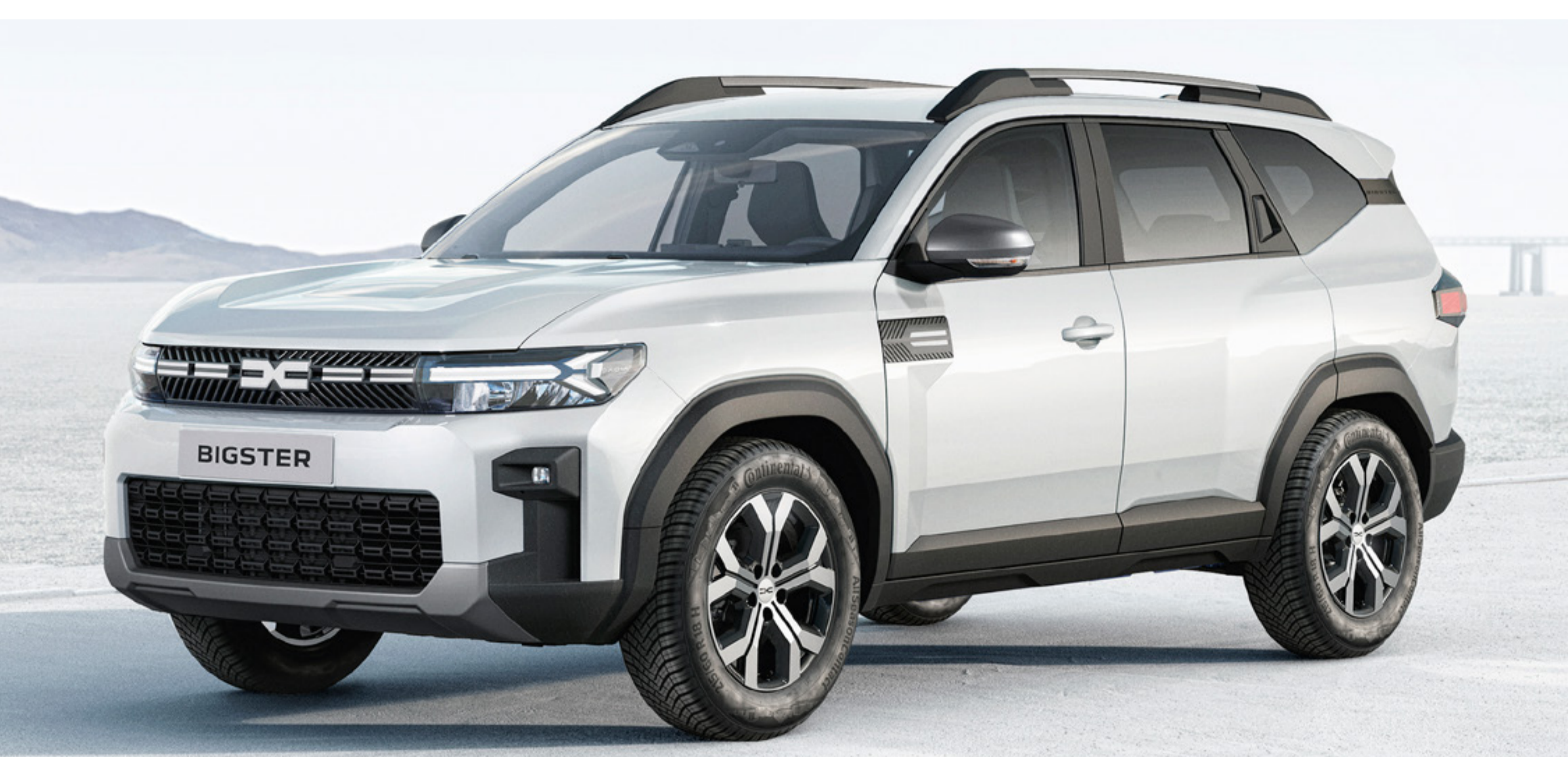
BIEL ALPEJSKA (1)