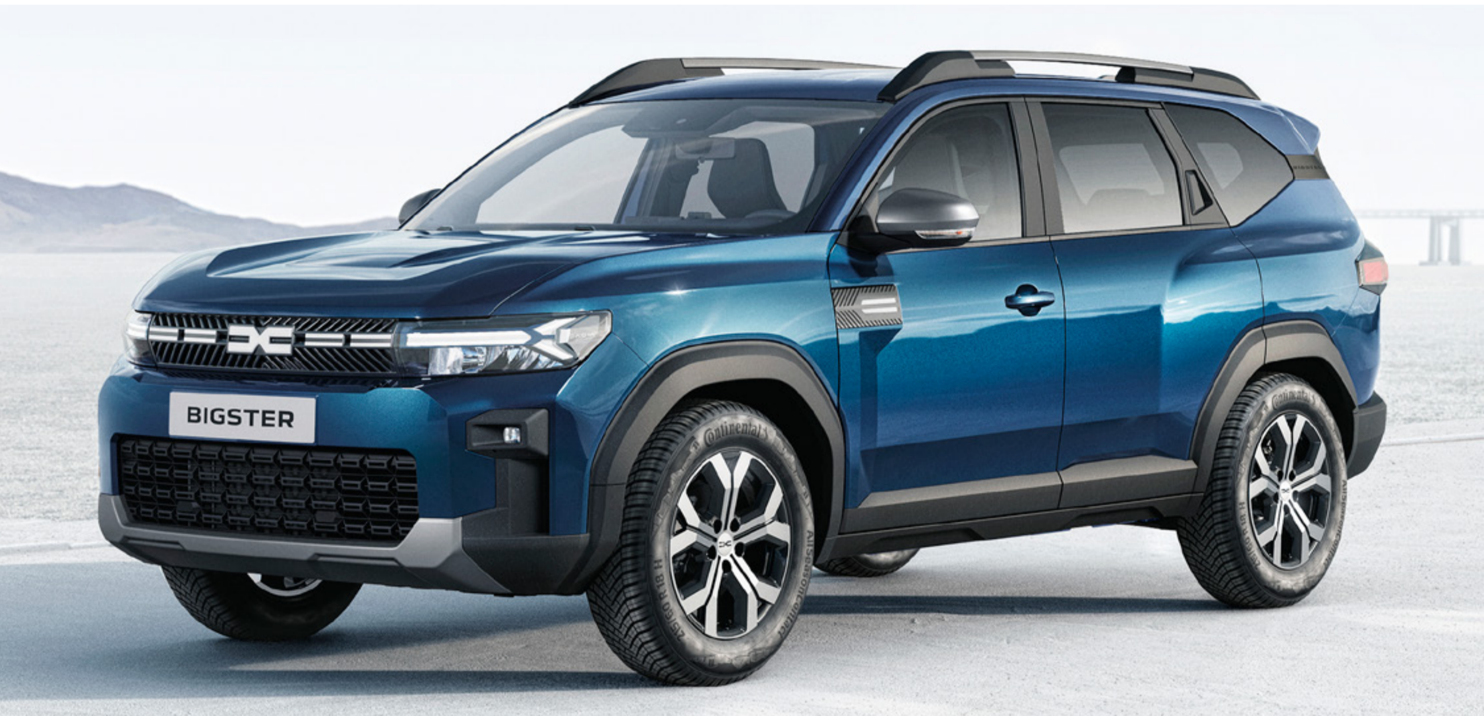
NIEBIESKI INDIGO (2)