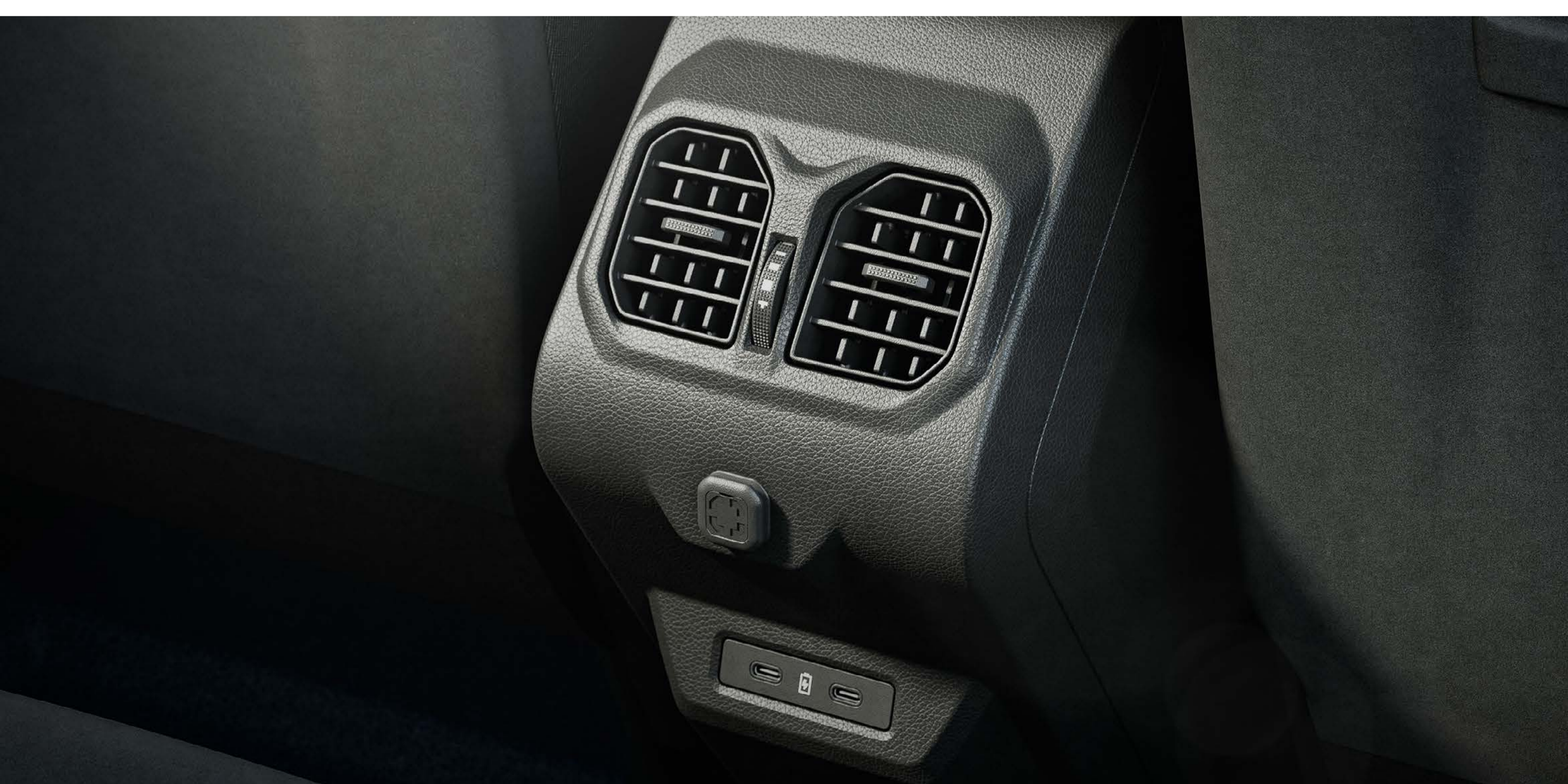
Saídas de ar traseiras