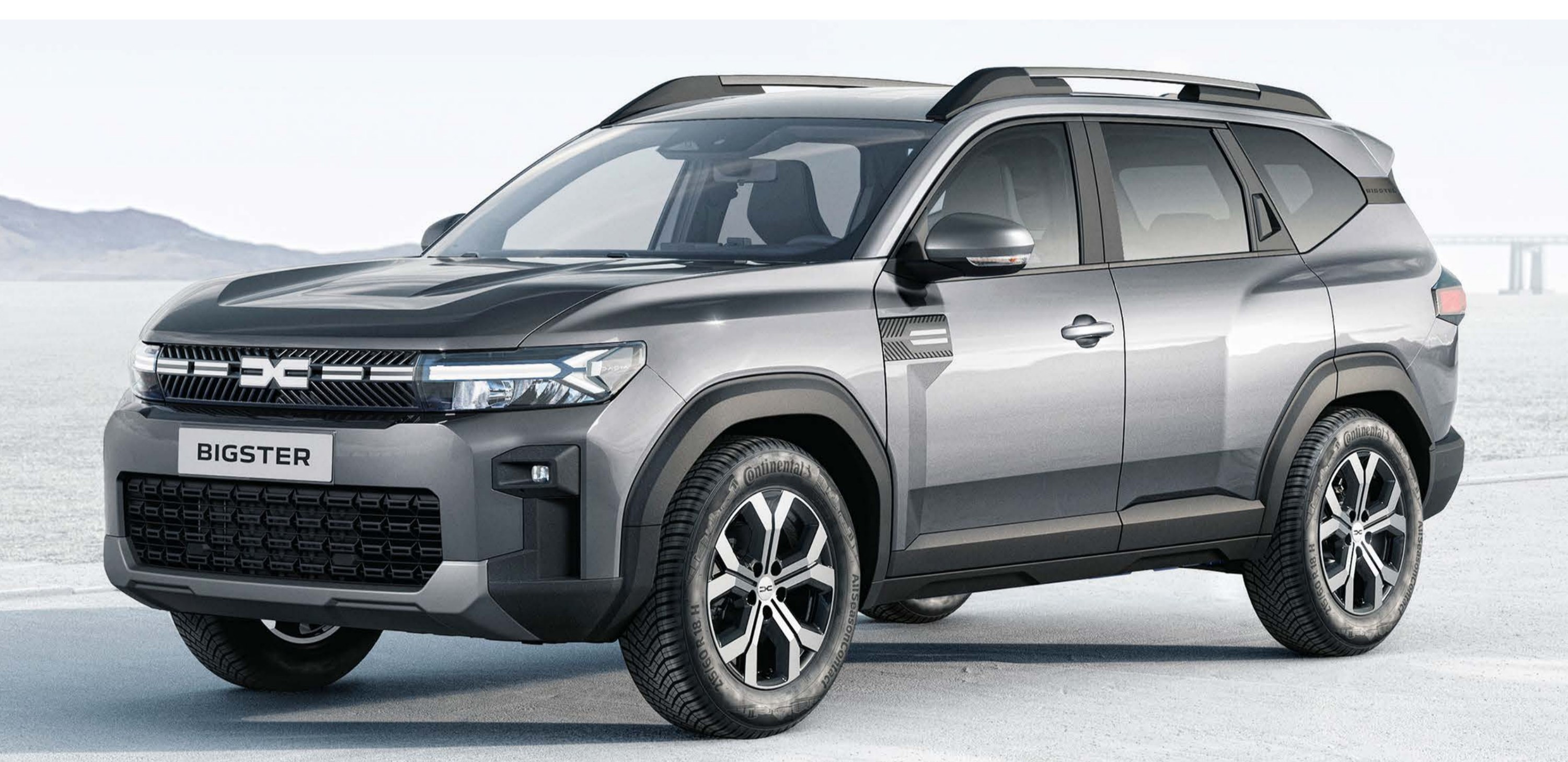
CINZENTO SCHISTE (2)