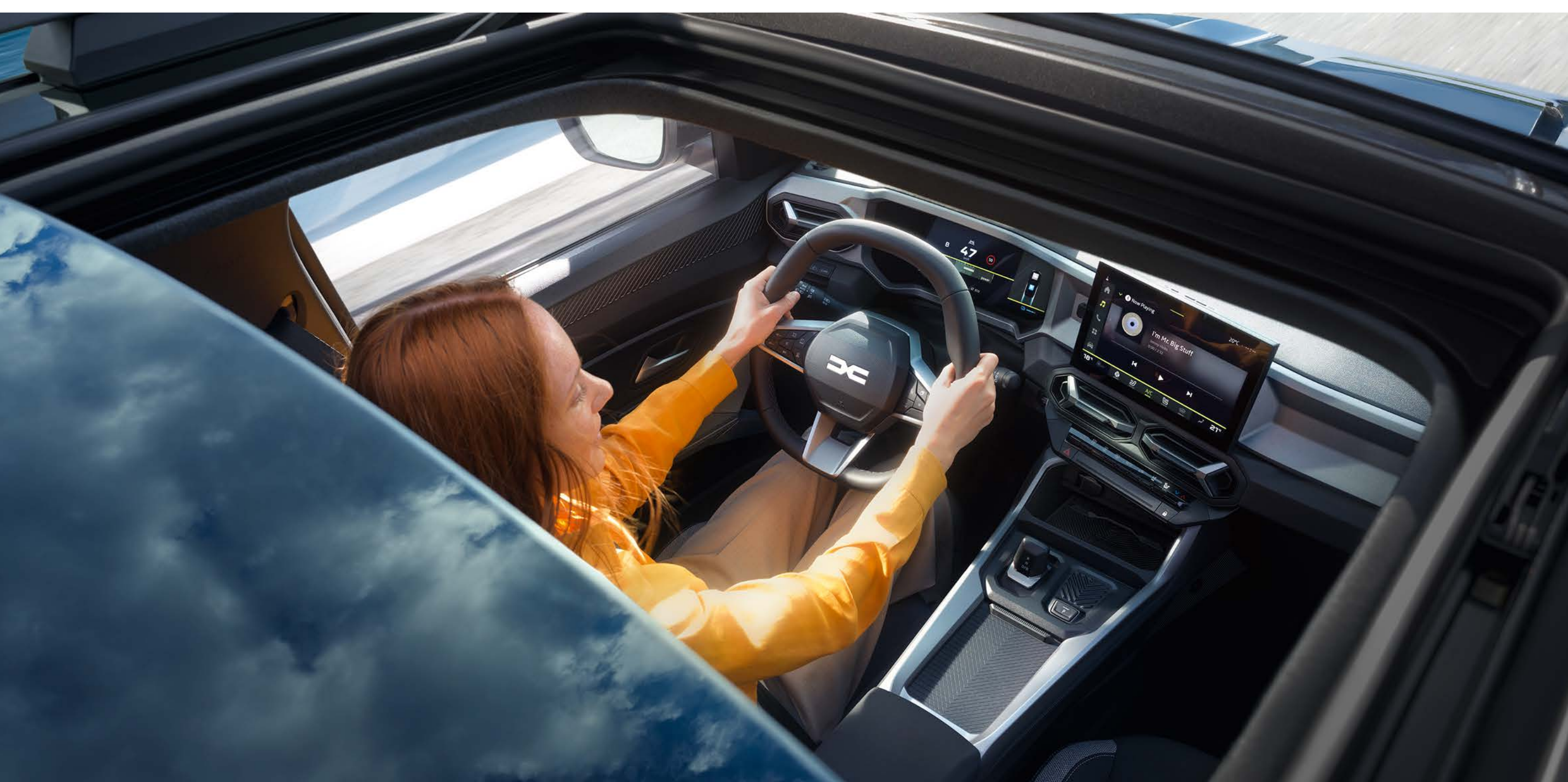
Teto de abrir panorâmico

A elegância descontraída da versão bi-tom, o teto de abrir panorâmico que oferece ao interior uma luminosidade única, e um toque extra de distinção com a cor exclusiva Azul Índigo. Um Bigster para cada um.