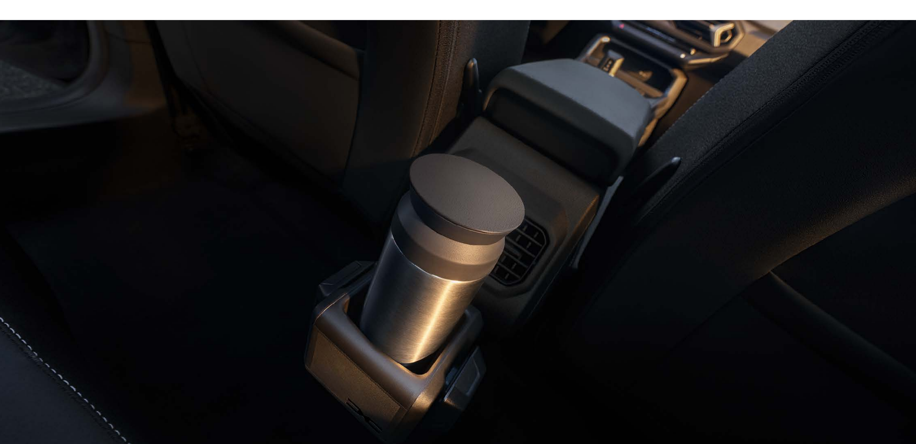
YouClip 3 em 1