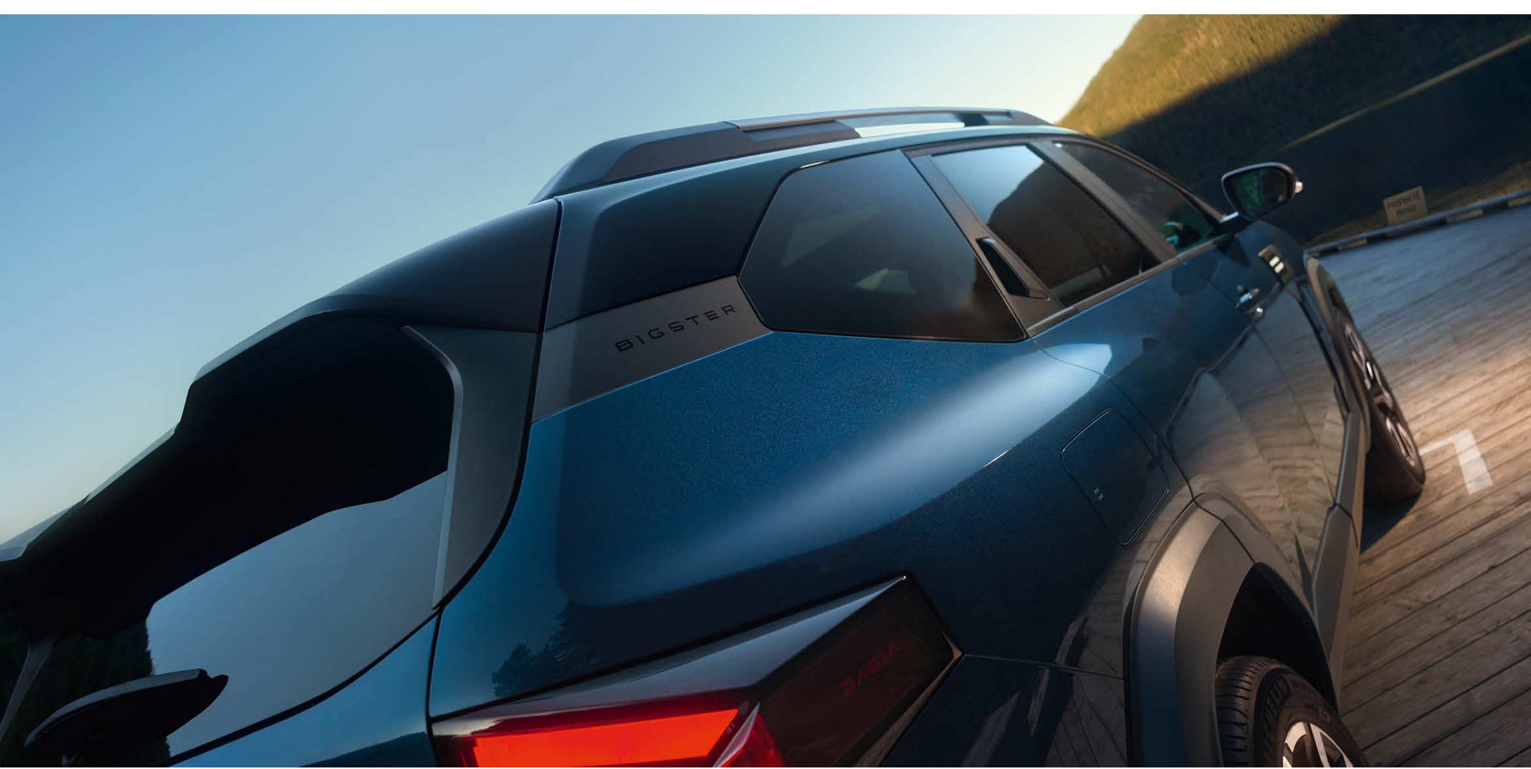
Pintura exclusiva bi-tom