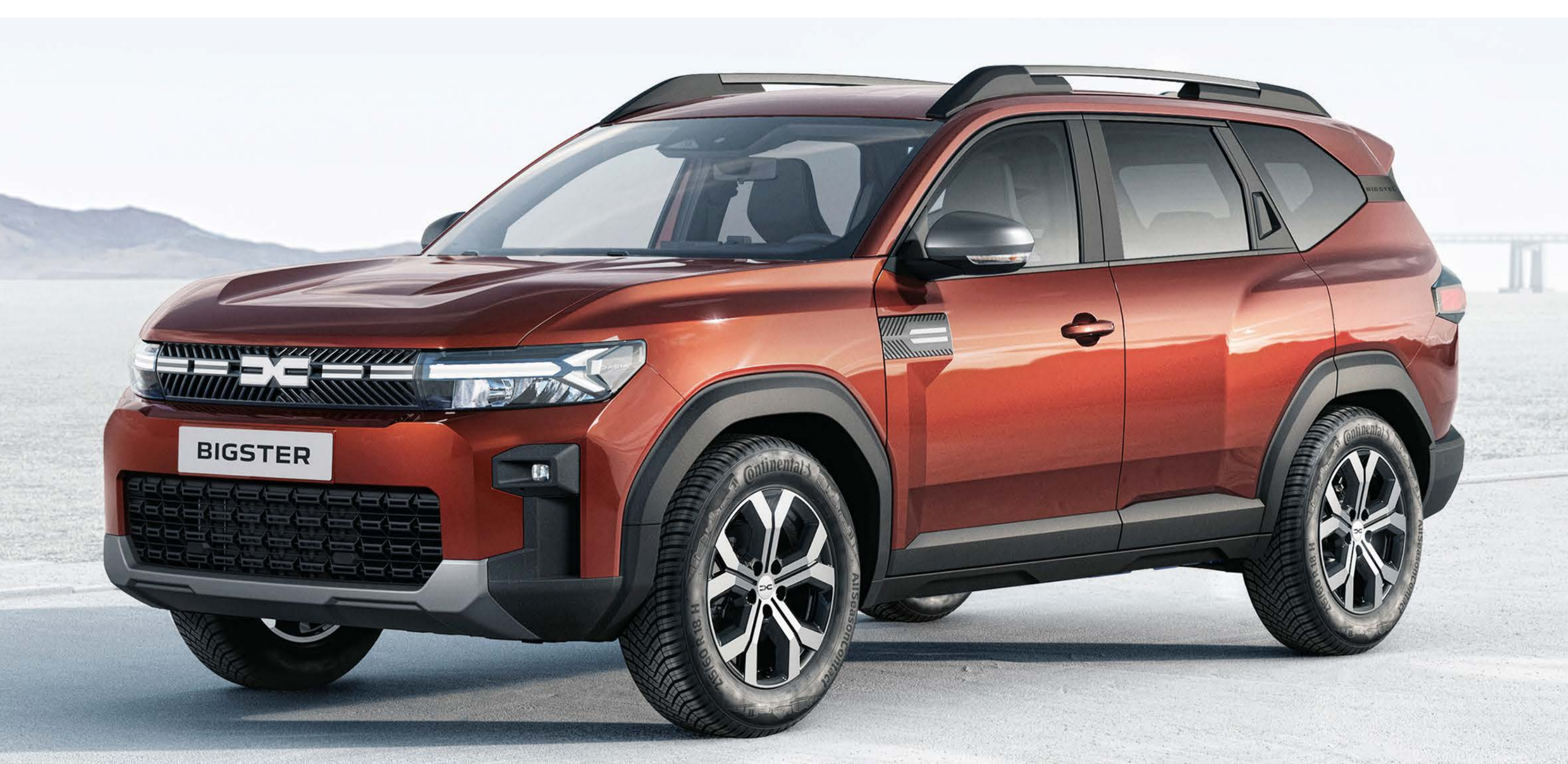
CASTANHO TERRACOTTA (2)

(1) Pintura opaca. (2) Pintura metalizada. Fotografias não contratuais.