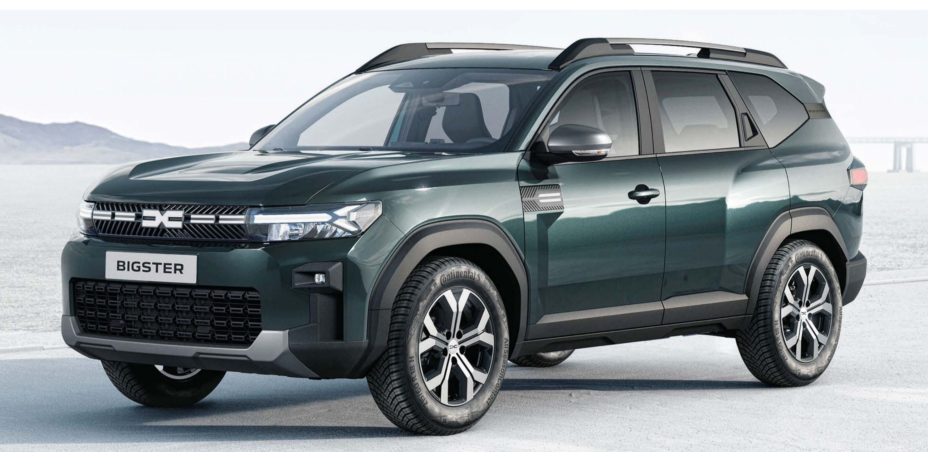
VERDE CEDAR (2)