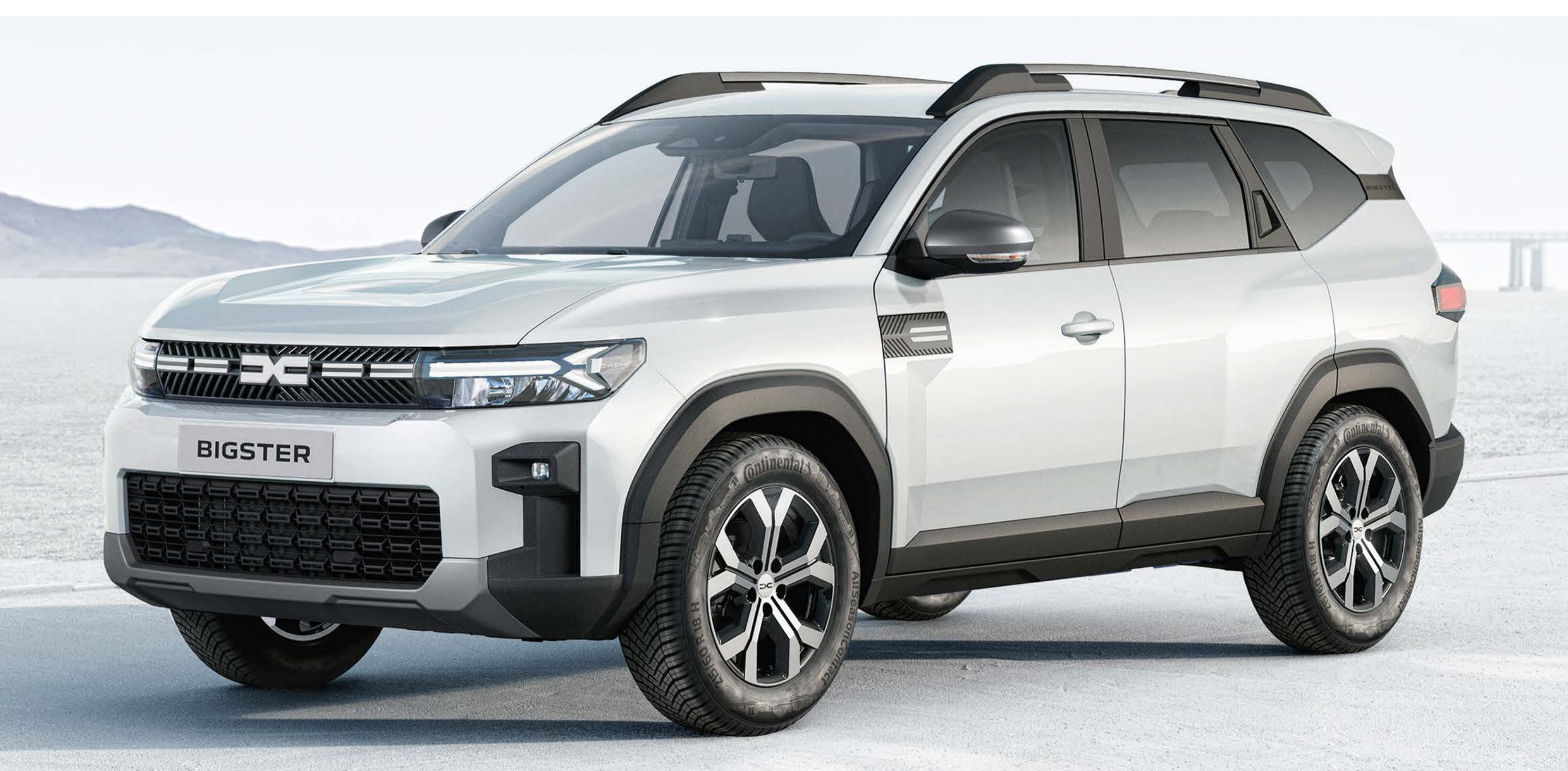
BRANCO GLACIAR (1)