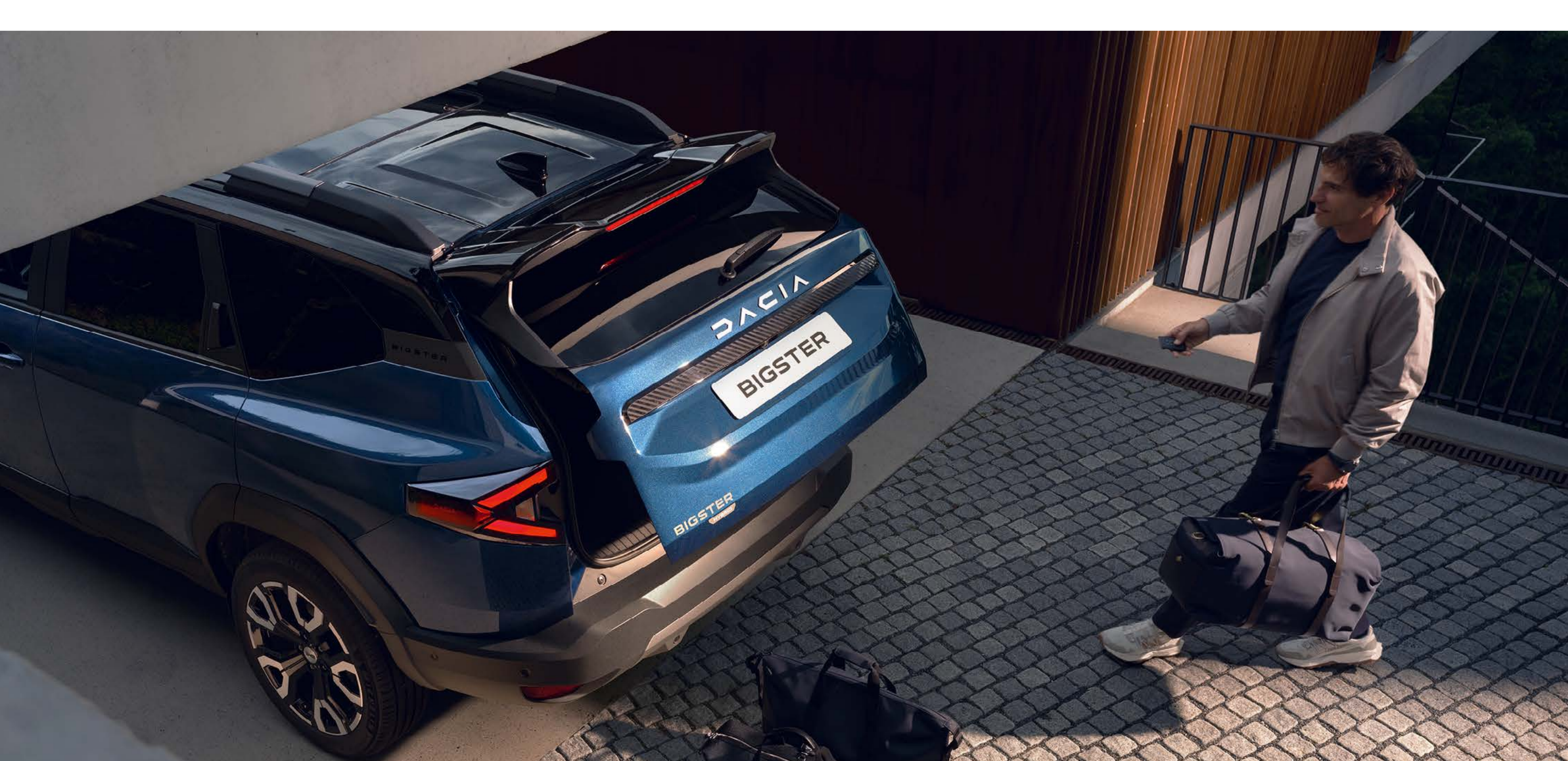
Porta da bagageira elétrica