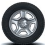
16" oțel, design Fidji