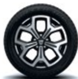
17", diamantate, design Maldive