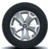
16" aluminiu, design Cyclade