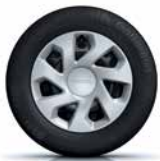
15" oțel, Groomy