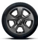
16" oțel, design Genea Dark Metal