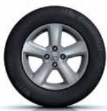
15" aluminiu, design Chamade