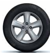
15" aluminiu, design Chamade