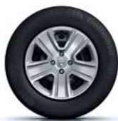
15" oțel, Popster