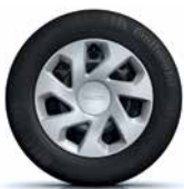
15" oțel, Groomy