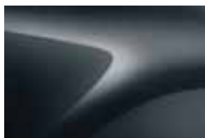
COMETE TAMNOSIVA (KNA) (2)