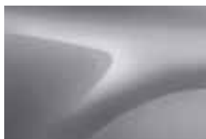
SIVA HIGHLAND (KQA) (2)