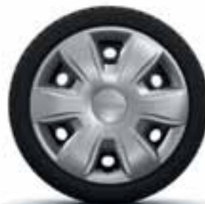
15" UKRASNI POKLOPAC TISA