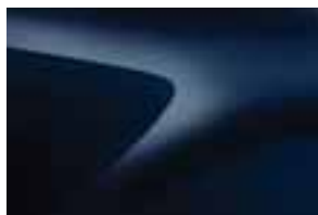
MORNARSKO PLAVA (D42) (1)