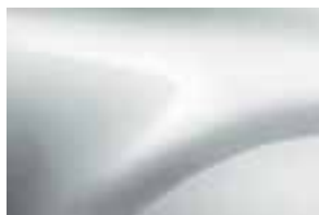
LEDENO BELA (369) (1)