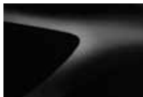
BISERNO CRNA (676) (2)