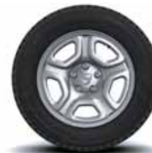
NAPLACI 16" FIDJI