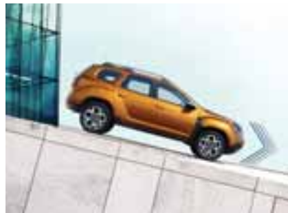
POMOĆ PRI KRETANJU NIZBRDO