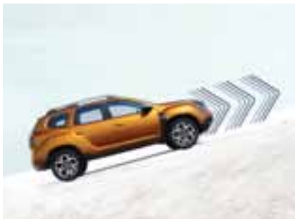
POMOĆ PRI KRETANJU NA UZBRDICI

Bilo na asfaltu ili na neuređenom terenu, Dacia Duster uvek ima odgovarajuće rešenje: pomoć pri kretanju na uzbrdici savladava uzvišenja brzo i jednostavno, a sistem za kontrolu brzine na nizbrdici obezbeđuje umerenu brzinu spuštanja. A s obzirom na to da je ponekad teško imati pogled na sve, kamera za prikaz iz više uglova otkriće sve neravnine, kamenje ili male prepreke kako bi vam olakšala vožnju.