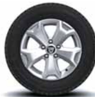
NAPLACI 16" CYCLADE