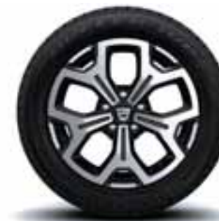
NAPLACI 17" MALDIVES