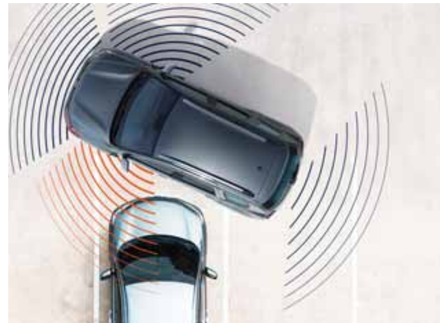
KAMERA ZA PRIKAZ IZ VIŠE UGLOVA