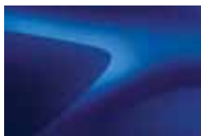
IRON PLAVA (RQH) (1)