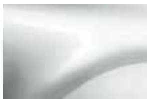
LEDENO BELA (369) (2)