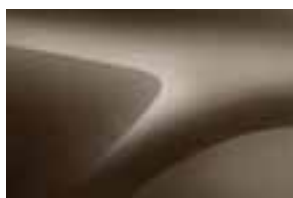
VISION SMEĐA (CNM) (1)