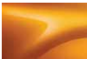
NARANDŽASTA ATACAMA (EDY) (1)