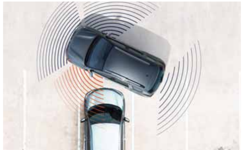
KAMERA ZA PRIKAZ IZ VIŠE UGLOVA