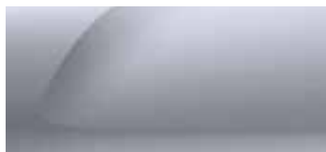
SIVA HIGHLAND (2)