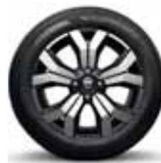
ALUMINIJUMSKI NAPLACI 41 cm (16") STEPWAY MAHALIA