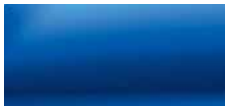
PLAVA IRON (2)