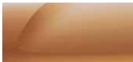
NARANDŽASTA ATAKAMA (2)