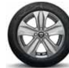
UKRASNI POKLOPAC 41 cm (16") AMARIS