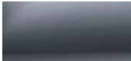
SIVA COMETE (2)