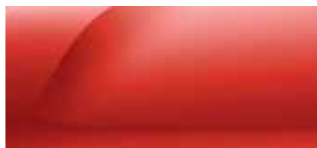
CRVENA FUSION (2)