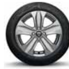
UKRASNI POKLOPAC 41 CM (16") AMARIS