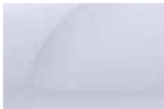
LEDENO BELA (1)