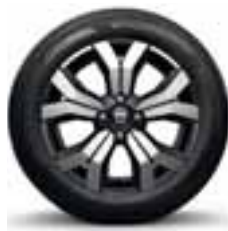
ALUMINIJUMSKI NAPLACI 41 CM (16") STEPWAY MAHALIA