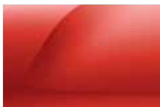
CRVENA FUSION (2)