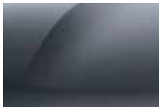
SIVA COMETE (2)