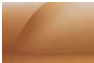
NARANDŽASTA ATAKAMA (2)