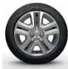
UKRASNI POKLOPAC 41 CM (16") FLEXWHEEL SARIA