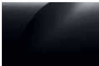
BISERNO CRNA (2)