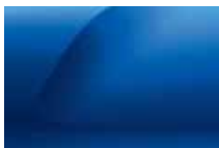
PLAVA IRON (2)