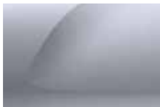
SIVA HIGHLAND (2)