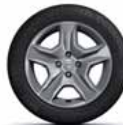
41 CM (16") UKRASNI POKLOPAC BAYADÈRE DARK METAL**