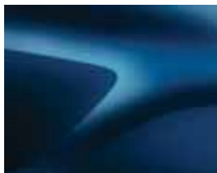
COSMOS PLAVA (RPR) (2)