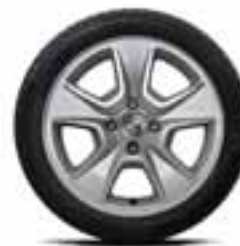
38 CM (15") ALU NAPLATAK NEPTA