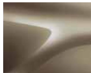
BEŽ DUNE (HNP) (2)