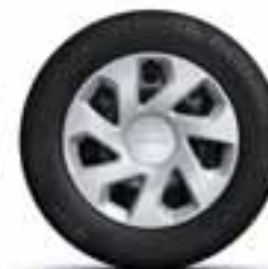
38 CM (15") UKRASNI POKLOPCI GROOMY*