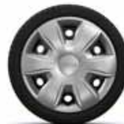
38 CM (15") UKRASNI POKLOPCI TISA*