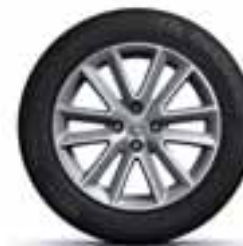
41 CM (16") ALU NAPLATAK ALTICA*