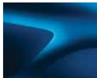
AZURITE PLAVA (RPL) ** (2)