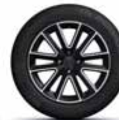
41 CM (16") ALU NAPLATAK ALTICA CRNE BOJE SA DIJANTSKIM SJAJEM*