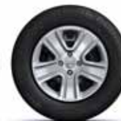
38 CM (15") UKRASNI POKLOPCI POPSTER*