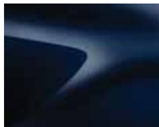
MORNARSKO PLAVA (D42) *(1)