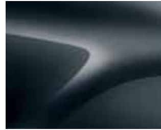
COMETE SIVA (KNA) (2)