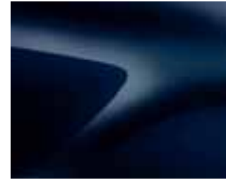
NAVY MODRA (D42)* (1)