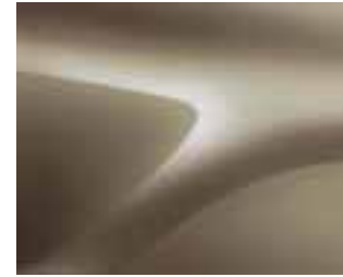
BEŽ DUNE (HNP) (2)