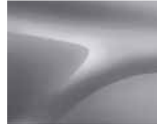
SIVA HIGHLAND (KQA) (2)