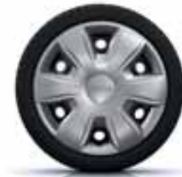
38 CM (15") OKRASNI POKROV TISA