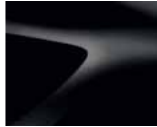
BISERNO ČRNA (676) (2)