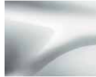
LEDENIŠKO BELA (369) (1)