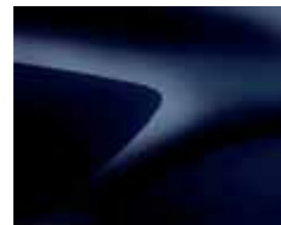
MORNARSKO MODRA (D42)