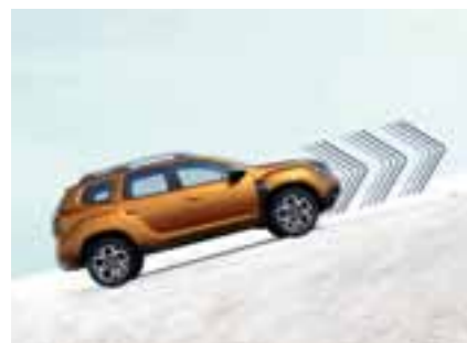
POMOČ PRI SPELJEVANJU V KLANEC

Tako pri vožnji po utrjenih kot tudi po neutrjenih poteh ima Dacia Duster vedno ustrezno rešitev: pomoč pri speljevanju navkreber za hitro in preprosto obvladovanje gorskih cest, sistem za nadzor hitrosti pri vožnji po klancu navzdol pa skrbi za enakomerno hitrost spuščanja. Ker pa pregled nad vsem včasih preprosto ni mogoč, vam kamera za prikaz različnih pogledov za lažjo vožnjo prikaže vse luknje, kamenje ali manjše ovire.