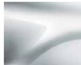
LEDENO BELA (369)