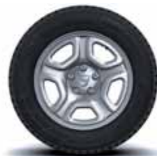
41 CM (16") PLATIŠČA FIDJI