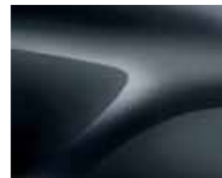
TEMNOSIVA COMETE (KNA)