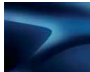
MODRA COSMOS (RPR)