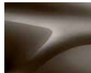
RJAVA VISION (CNM)