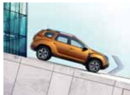
POMOČ PRI VOŽNJI PO KLANCU NAVZDOL