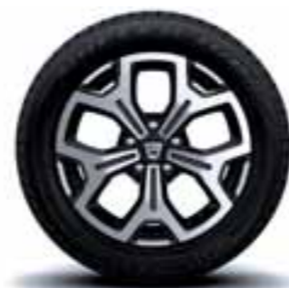
43 CM (17") PLATIŠČA MALDIVES