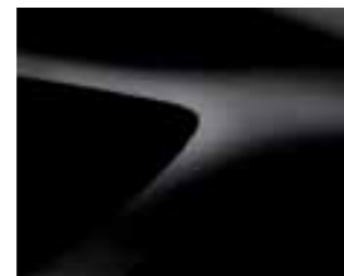
BISERNO ČRNA (676)