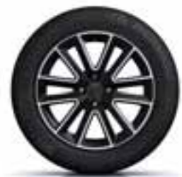
41 CM (16") LITO PLATIŠČE ALTICA Z DIAMANTNIM LESKOM ČRNA*