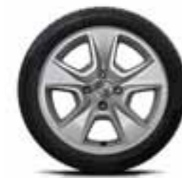
38 CM (15") LITO PLATIŠČE NEPTA