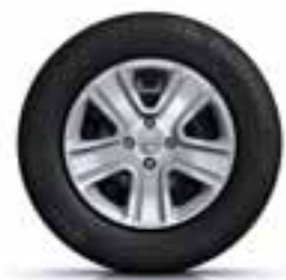
38 CM (15") OKRASNI POKROVI POPSTER*