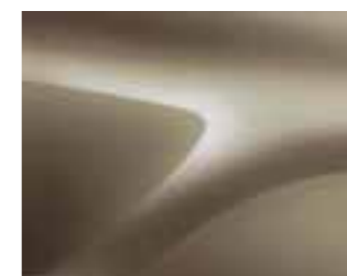
BEŽ DUNE (HNP) (2)