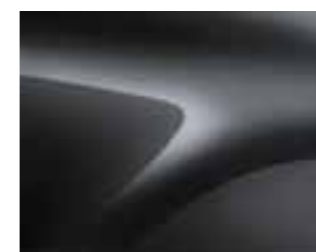
ISLANDE SIVA (KPV) (2)