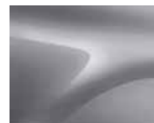
SIVA HIGHLAND (KQA) (2)