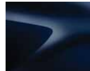
NAVY MODRA (D42)* (1)