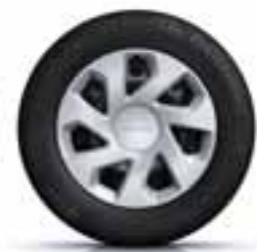
38 CM (15") OKRASNI POKROVI GROOMY*