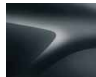
COMÈTE SIVA (KNA) (2)