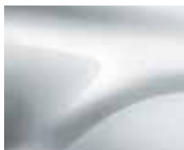
LEDENO BELA (369)