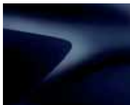
MORNARSKO MODRA (D42)