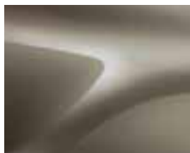
BEŽ DUNE (HNP)