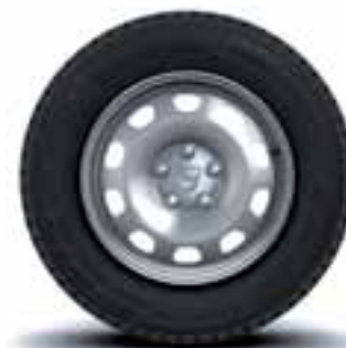
41 CM (16") TÔLE PLATIŠČA