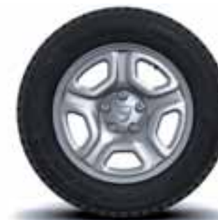
41 CM (16") PLATIŠČA FIDJI