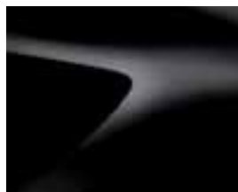
BISERNO ČRNA (676)