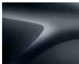
TEMNOSIVA COMETE (KNA)