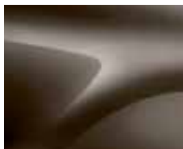
RJAVA VISION (CNM)