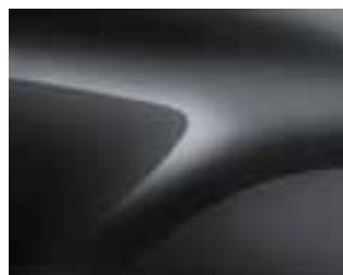
ISLANDE SIVA (KPV) (2)