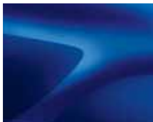
MODRA IRON (RQH) (2)