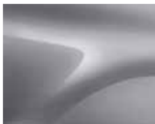
SIVA HIGHLAND (KQA) (2)