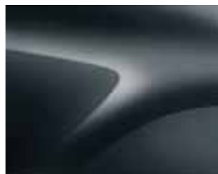
COMÈTE SIVA (KNA) (2)