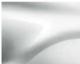
LEDENIŠKO BELA (369) (1)