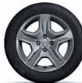
41 CM (16") OKRASNI POKROV BAYADERE DARK METAL*