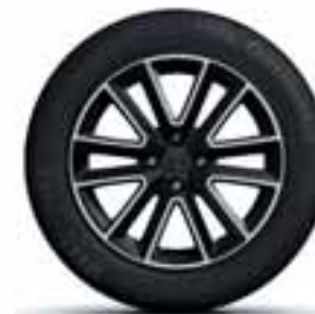
41 CM (16") LITO PLATIŠČE ALTICA ČRNE BARVE Z DIAMANTNIM LESKOM**