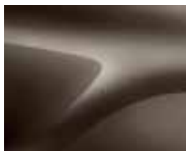
RJAVA VISON (CNM) (2)