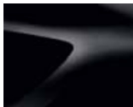
ČRNA NACRE (676) (2)