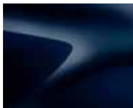
MODRA NAVY (D42) *(1)