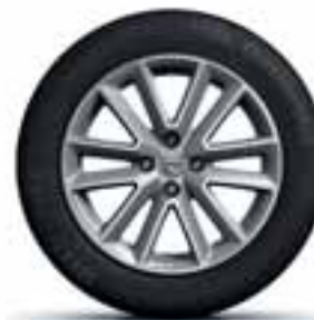
41 CM (16") LITO PLATIŠČE ALTICA*