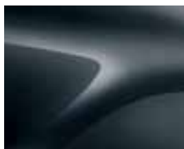
SIVA COMETE (KNA) (2)