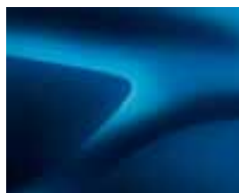
MODRA AZURITE (RPL) ** (2)