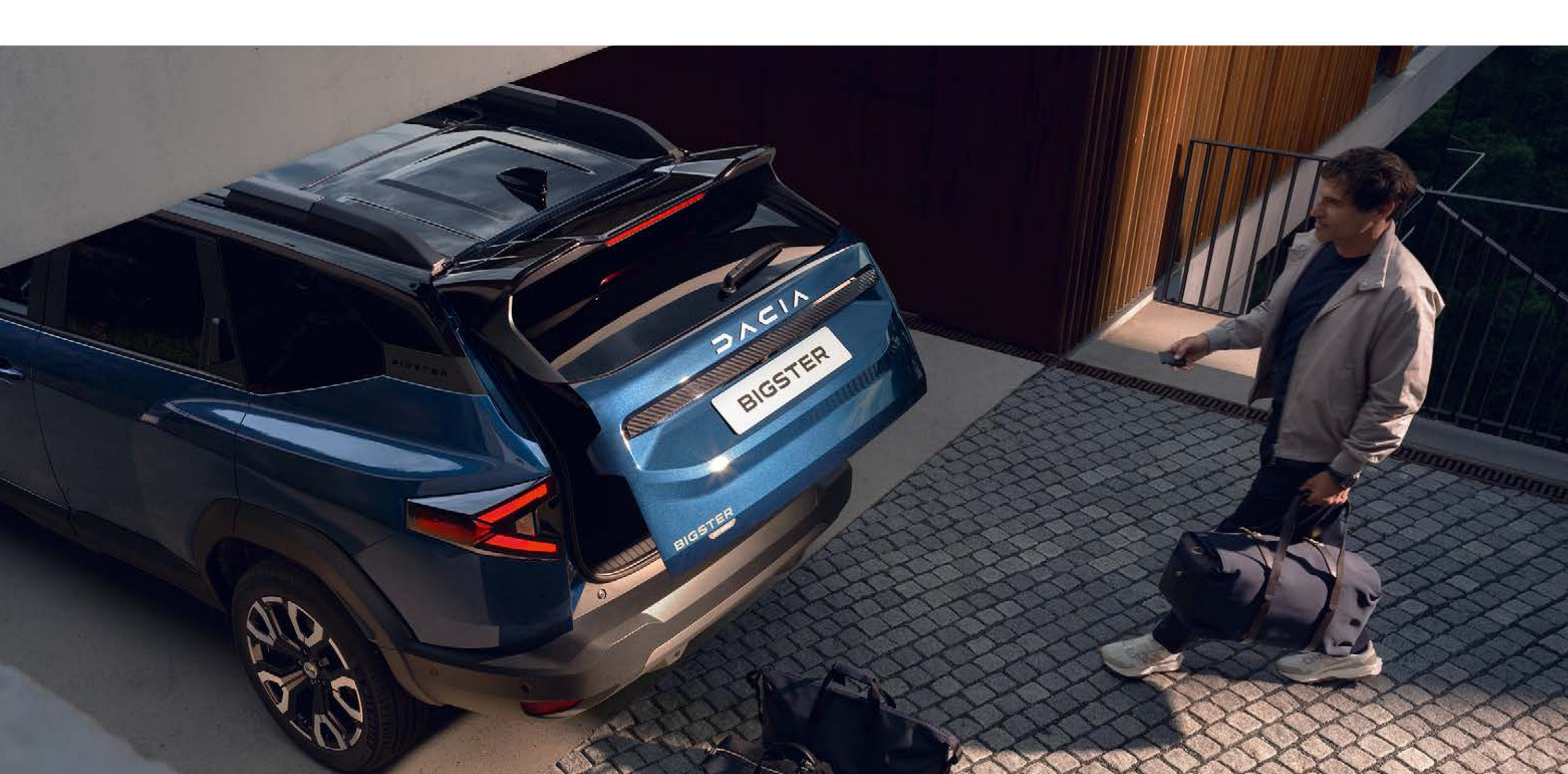
Elektricky otváratelné veko batožinového priestoru