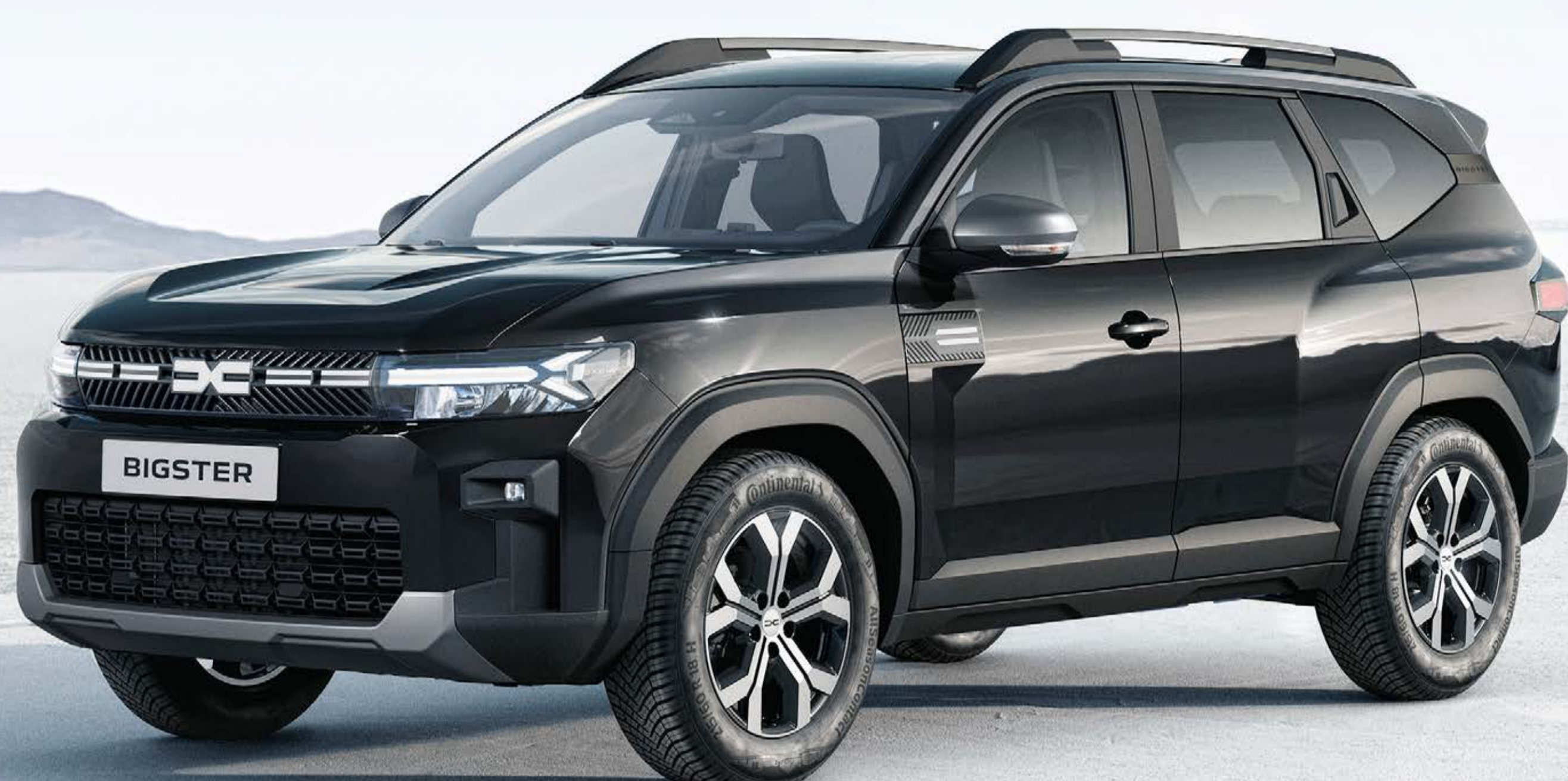
ČIERNA NACRÉ (2)