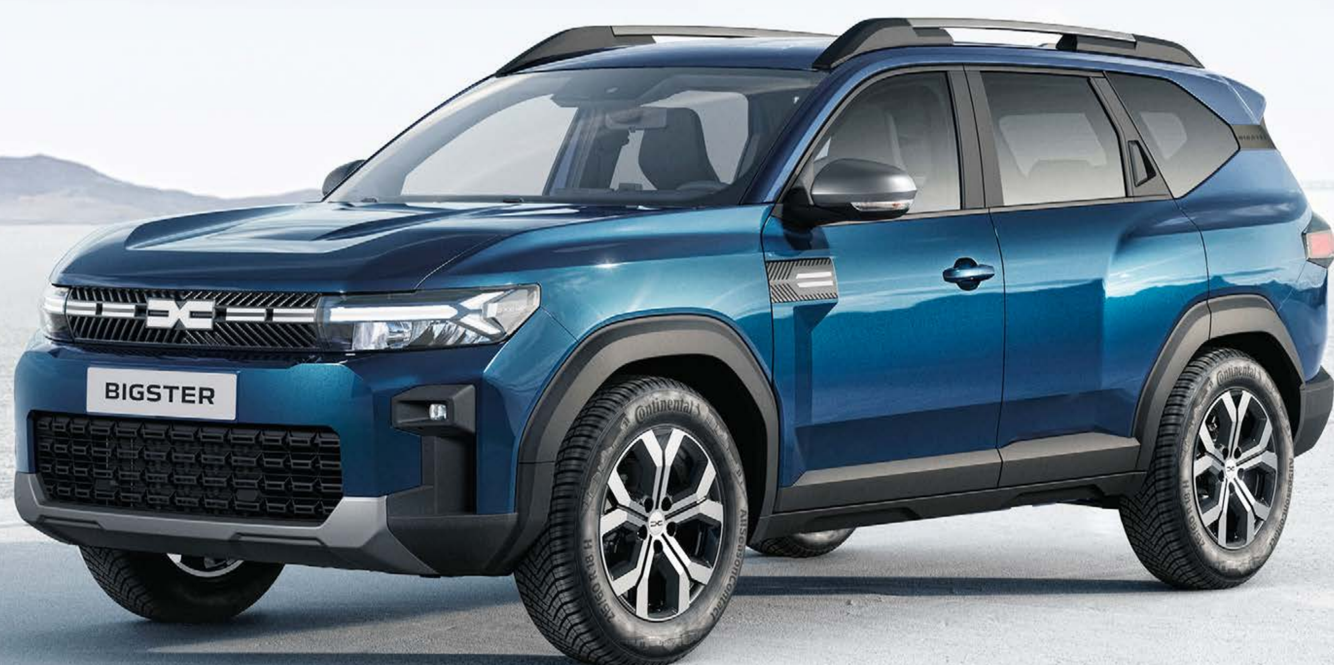
MODRÁ INDIGO (2)