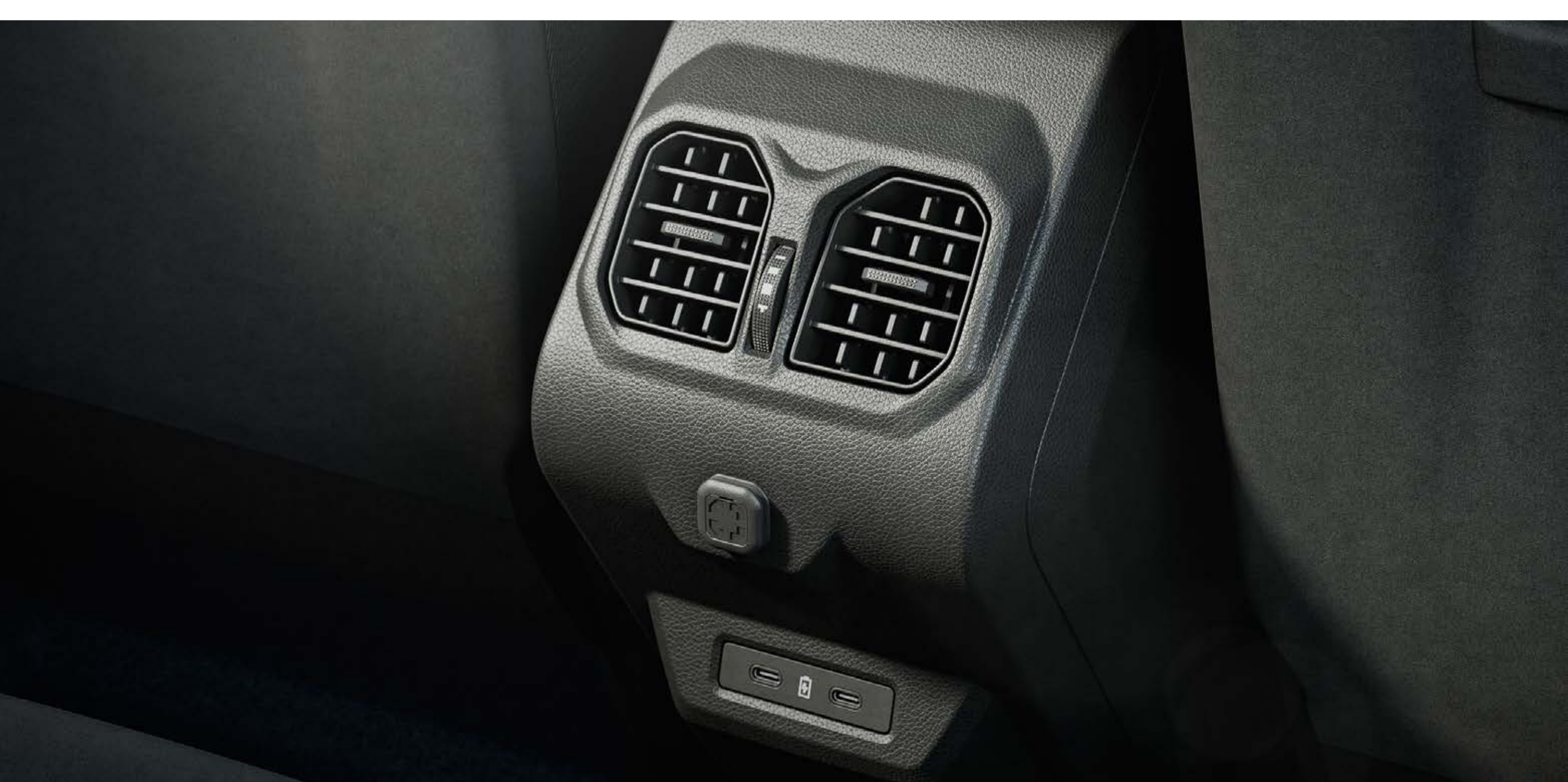
Výduchy klimatizácie vzadu