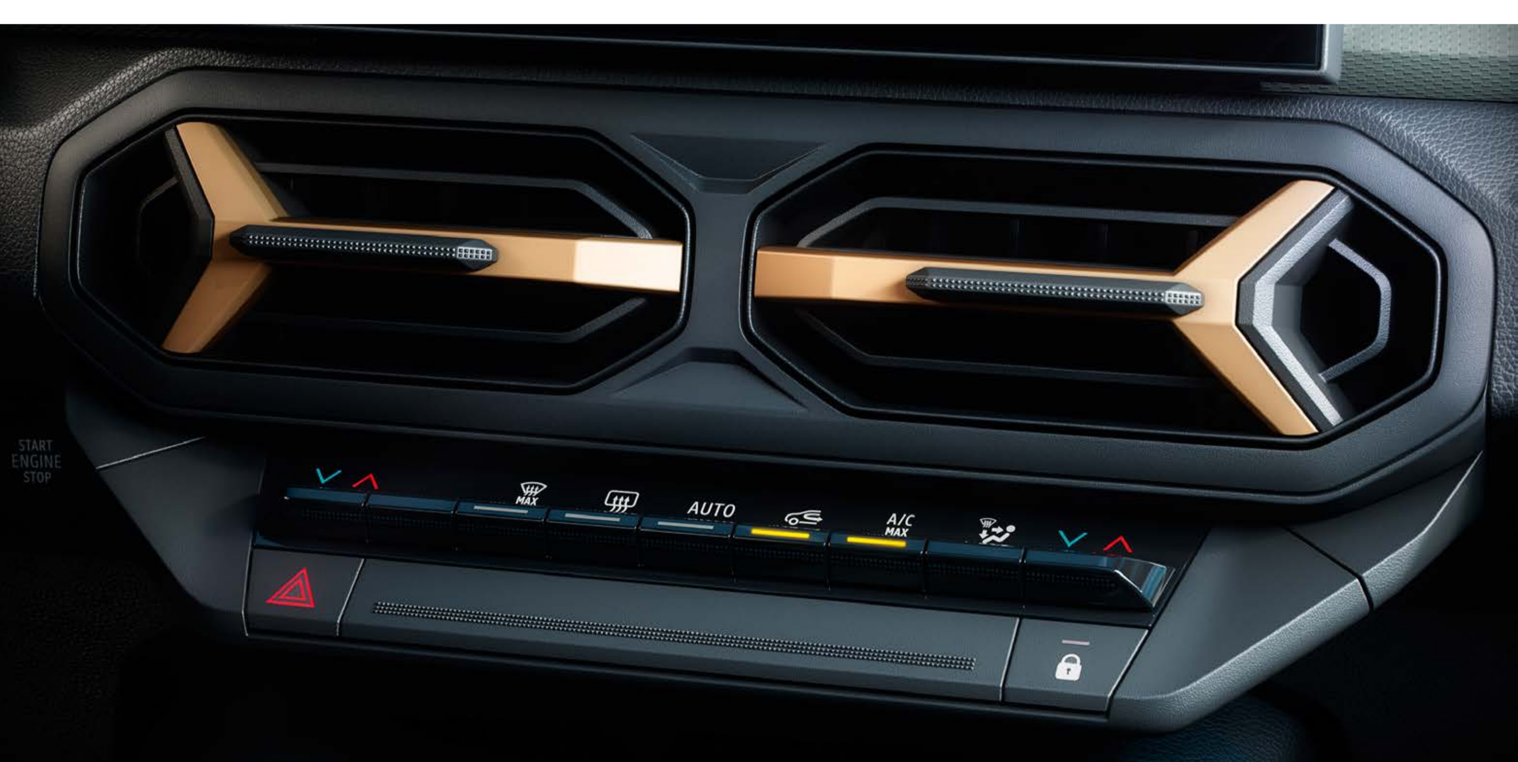
Automatická dvojfónová klimatizácia a vykurovanie

Interiér navrhnutý pre úplné pohodlie piatich cestujúcich je vybavený audiosystémom Arkamys® 3D so šiestimi reproduktormi a automatickou dvojfónovou klimatizáciou s výduchmi vpredu aj vzadu.