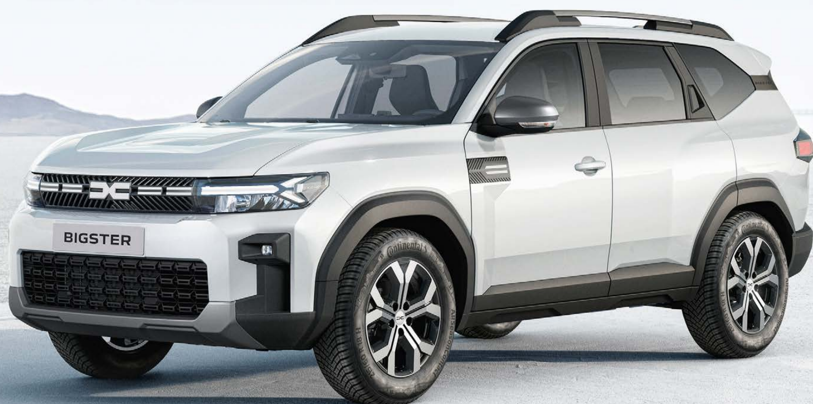
BIELA GLACIER (1)