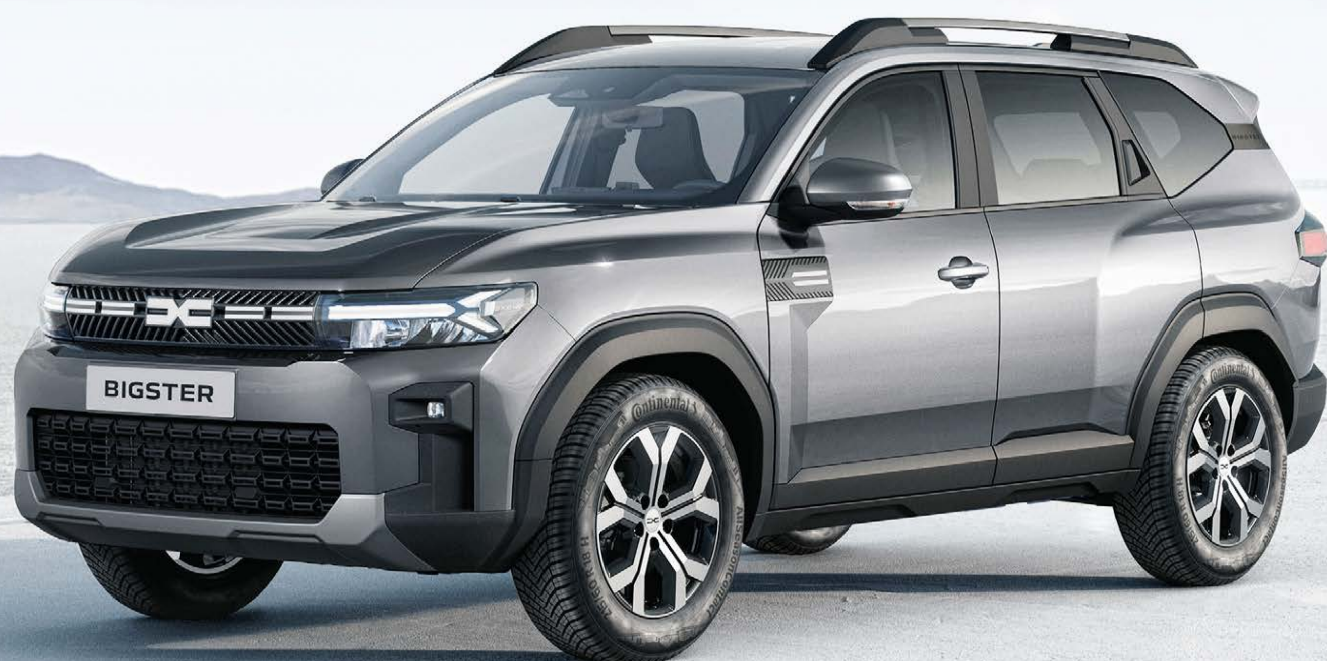
SIVÁ SCHISTE (2)