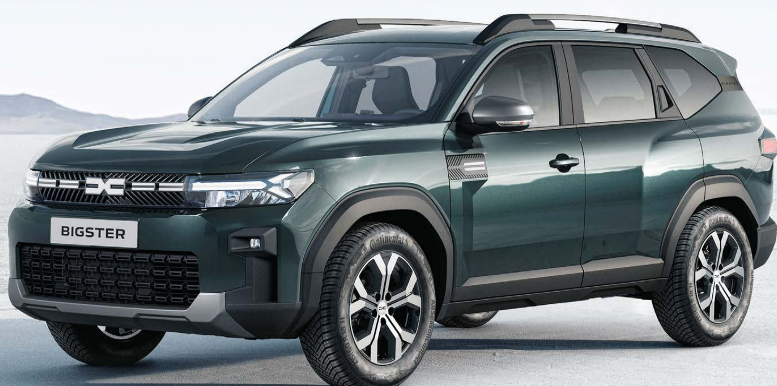
ZELENÁ CÈDRE (2)