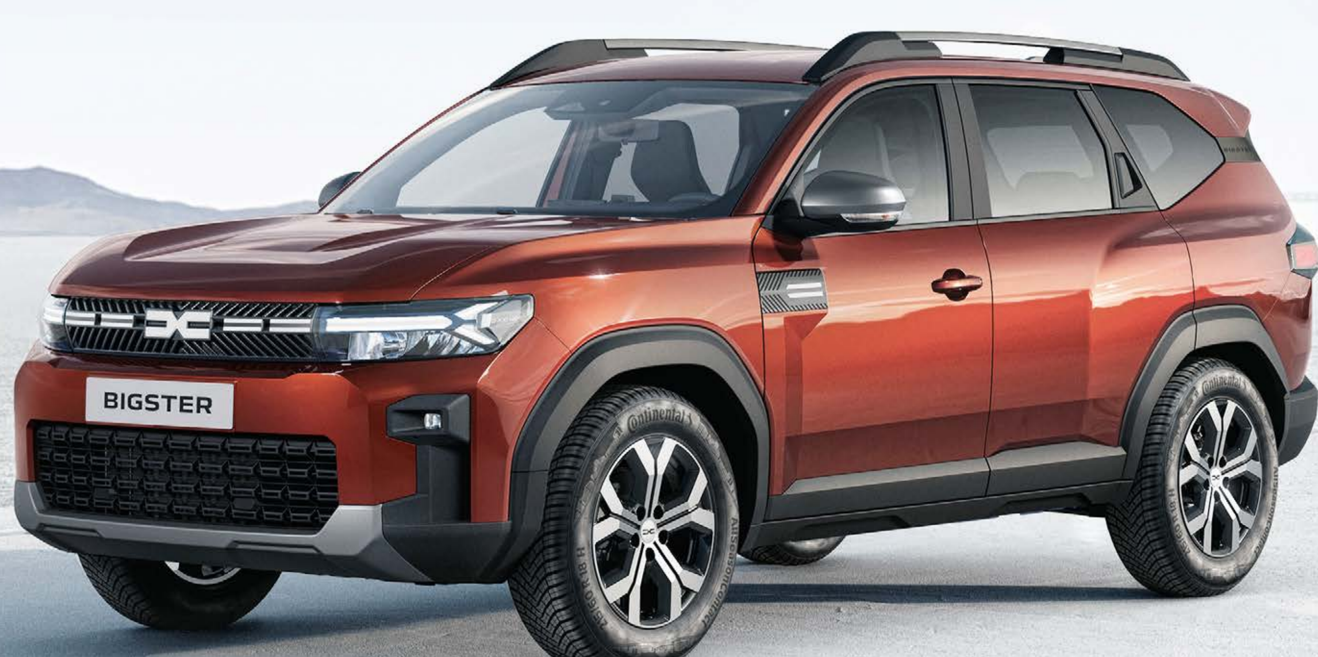
HNEDÁ TERRACOTTA (2)

(1) Nemetický lak. (2) Metalický lak. Fotografie nie sú zmluvne záväzné.